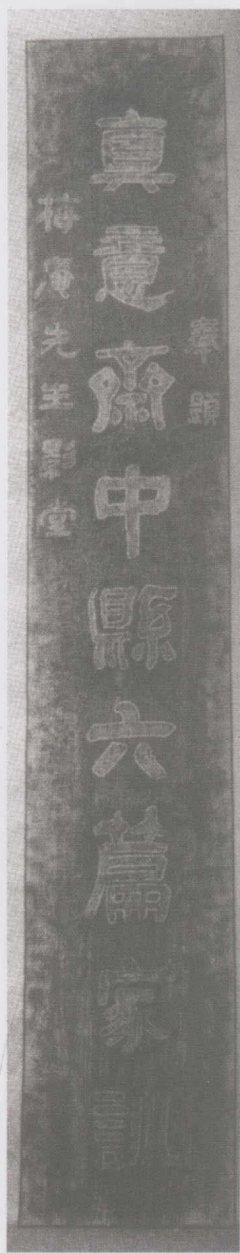
清·俞樾撰并书（联语印刷体见第125页）