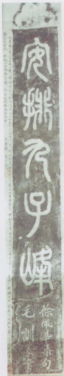
徐佩華集句 毛訓書 (聯語印刷体見第13頁)