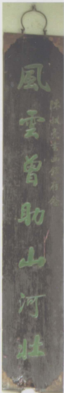
赵朴初撰并书（联语印刷体见第16页）