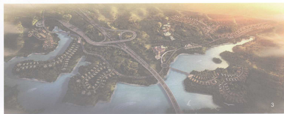
3 涪陵水磨滩旅游度假区