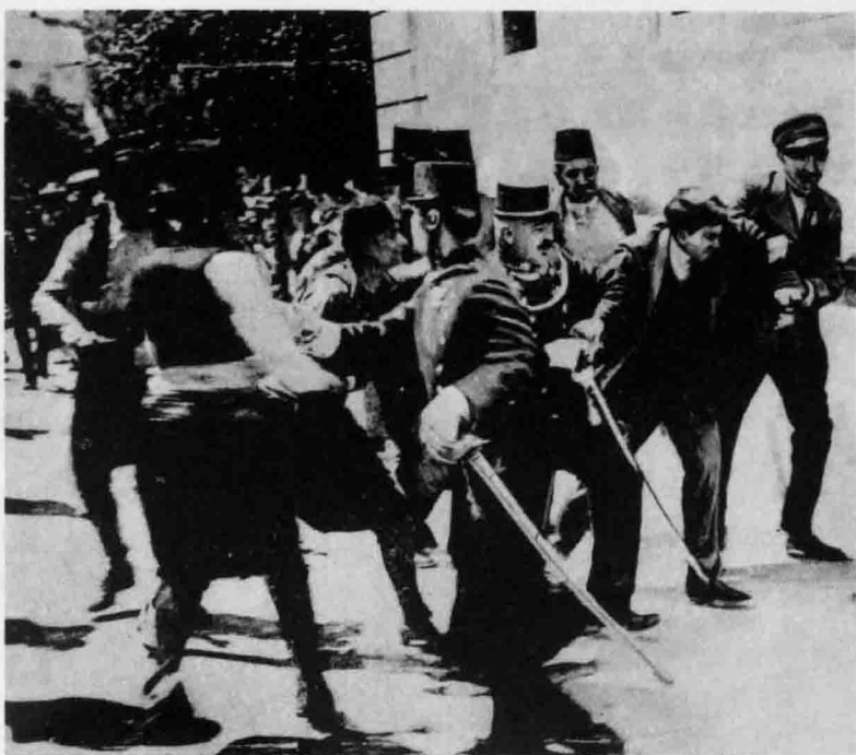
↑照片中的场景据称是加尔利诺·普林西普在实施暗杀后被捕。

在那个民族主义蔓延的年代，欧洲列强之间的相互猜忌很容易为军国主义所利用，这一点在德国表现得最为明显。基于“先下手为强，后下手遭殃”的共同认知，在竞争中处于对立状态的各个国家纷纷摩拳擦掌，意图夺取战争先机。德国意识到即将面临的是两头作战的考验，所以自己必须抢在数量远胜于己的法俄大军开入战场之前率先发动进攻。在大战来临前的几年时间里，上至将军下至百姓，人人都觉得这场战争应该是无可避免的了；但绝对没人会想到，这一切竟是由1914年6月28日那一对寂寂无名的奥匈帝国皇储夫妇被刺身亡来拉开序幕的。