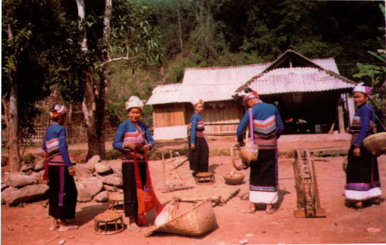
6. 曼底傣泐老人们当年拉火堆穿的服装