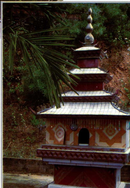
11. 重新建盖的独幢竜社