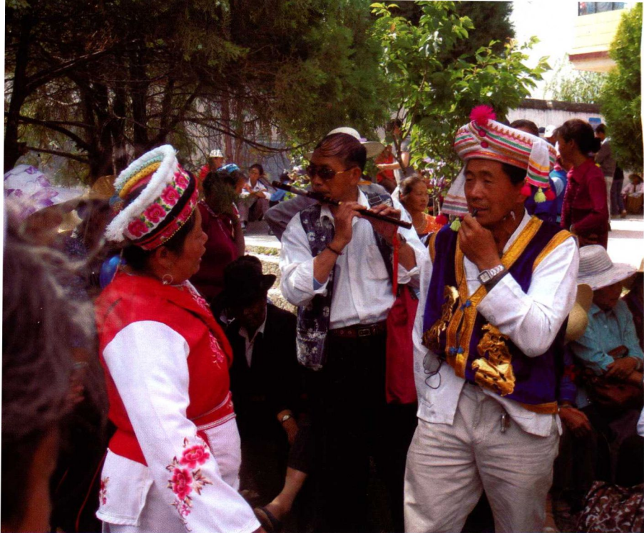
18. “绕三灵” 河湟城对歌