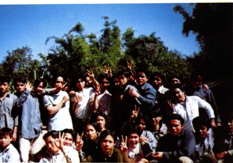
8. 曼底“时髦”的男人们