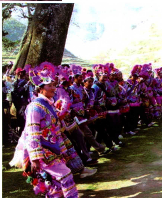
13. 直苴赛装节上跳脚的妇女