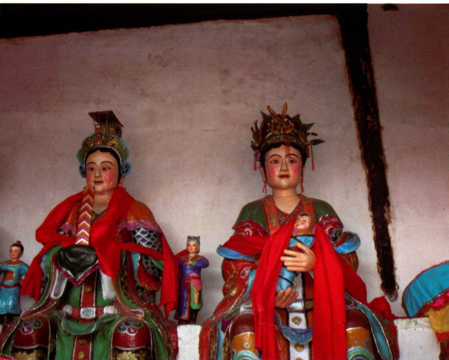
19. 大理庙中供奉的生育神 本请在线购买： www.ertongbook.com