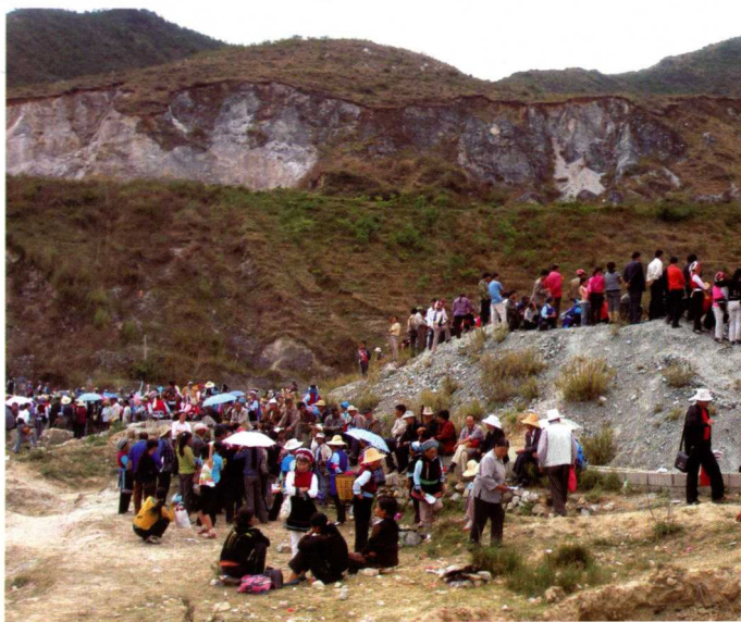
17. “绕三灵”采石场白天 人们的欢娱