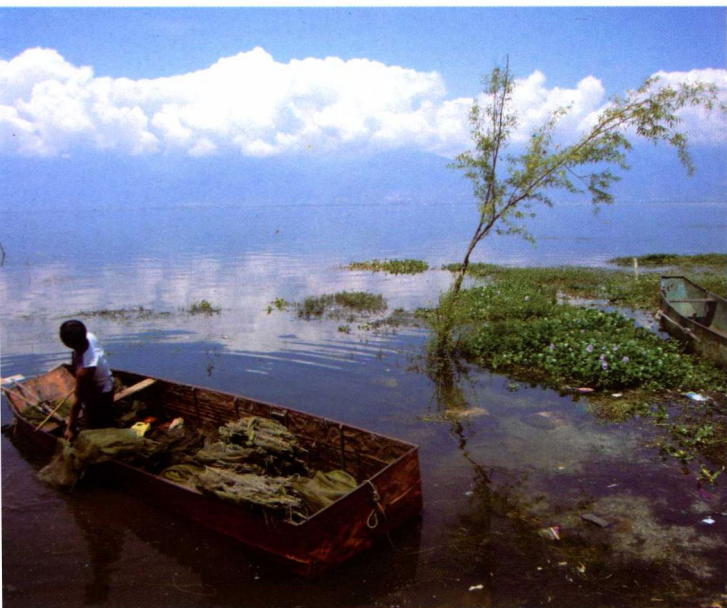
4. 洱海边捕鱼的 渔民