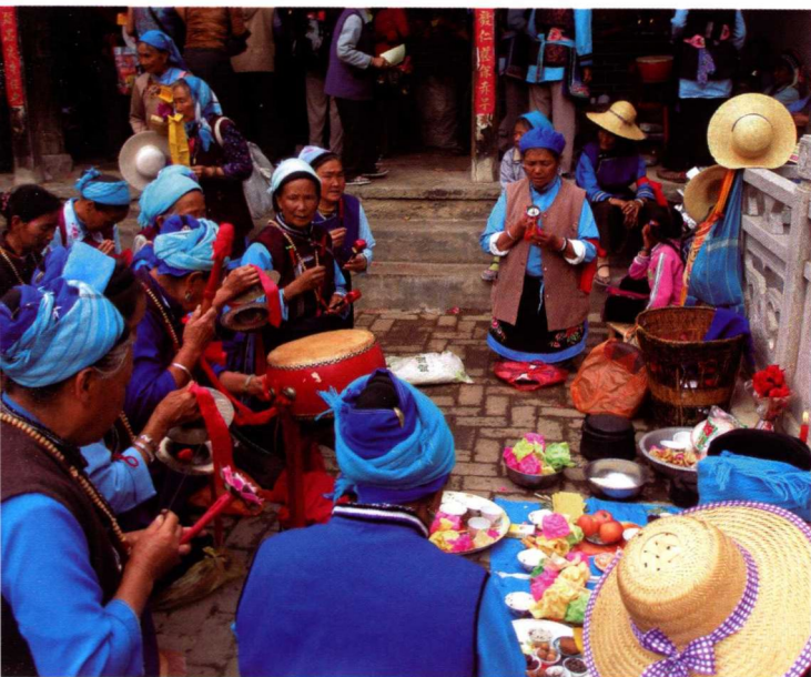
16. 大理白族“绕三灵”中 在神都护神的老斋奶