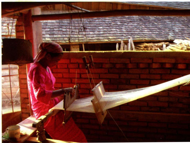
5. 西双版纳曼底傣族 妇女织布