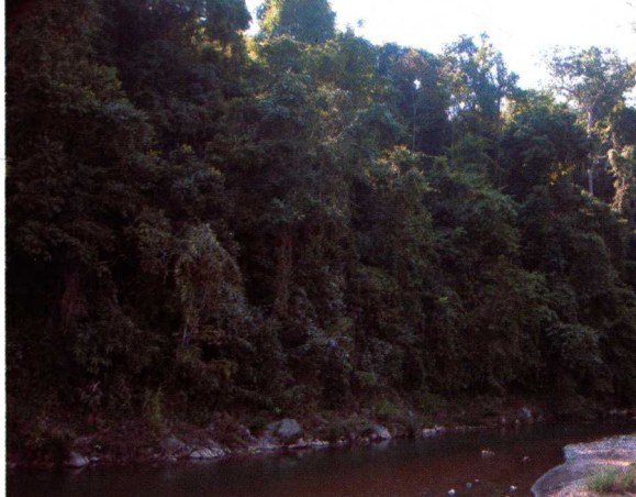
9. 曼底河边葱郁的竜林