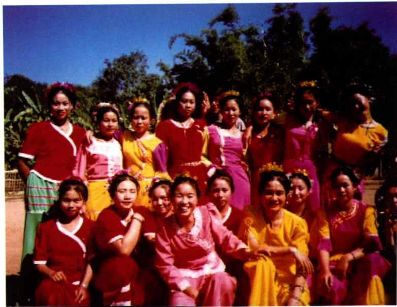
7. 曼底“守旧”的女人们