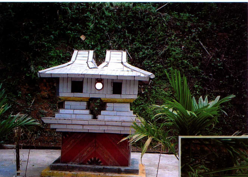
10. 曼底双拼式的竜社