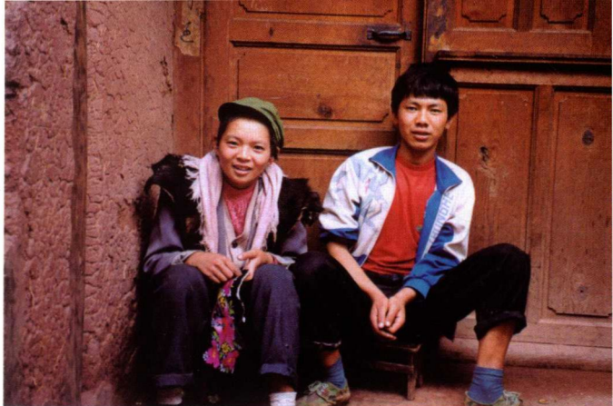
15. 等待领取结婚证的 直苴年轻夫妇