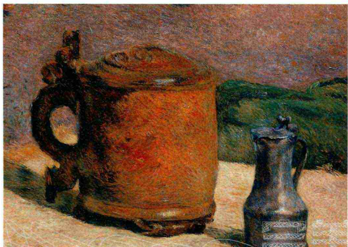
陶土壶和铁杯静物 (局部) 保罗·高更 (法国) 油画

大家可以看到画面中有的地方并没有具体画，只是概括了一下，没画并不是就表示没有，其实是存在的，是通过画了的地方间接地表现出来的。像盘子的投影和布纹的厚度就全都表现出来了，近处投影的位置画得很重、很实，远处的盘子与布的交接处也强调了一下，通过这样的前后夹击就形成了盘子整体形的感觉，给大家造成了一种假象，只要你把关键的点画到了，该有的就都会有了！如果把盘子的整个形全部都画出来反而不好了，就会显得平。