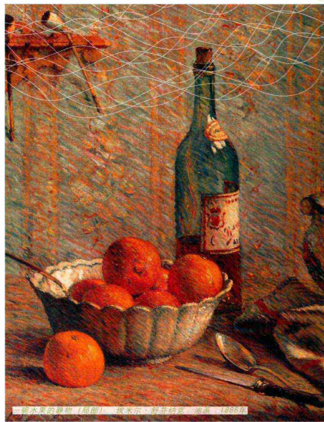
静物水果（局部） 埃米尔·诺尔·科芬特克 油画 1886年

白布近处的颜色暖一些，远处颜色冷一些，空间感非常强。边线的用笔很松动，极其熟练、大气，几种颜色交织出来的感觉非常漂亮。作者在画面右上角很随意地画了一块绿色，我们甚至都不知道它具体是什么，但它却丰富了整个画面的色彩。还有就是底下的这块咖色的布，近处的地方颜色偏暖一些、纯一些，远处的地方颜色偏冷一些、灰一些，这种关系处理得都很好。大家一定要认真地研究、临摹。