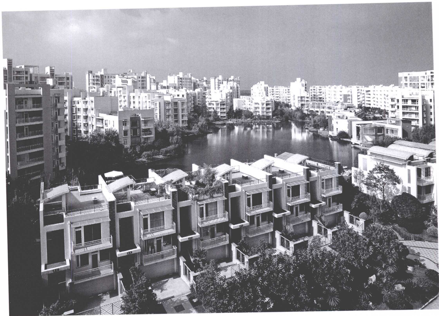
图 1—1 昆明市“湖畔之梦”住宅小区良好的景观和生态环境

良好的居住区景观设计能够促进城市发展、改善城市生态、丰富城市景观、体现城市文化，同时可将自然环境、社会环境和人文环境等有机地结合起来，为人们创造出安全、卫生、便捷、舒适、优雅、和谐的生活空间，如昆明市“湖畔之梦”住宅小区，便利用了原有的凹地形形成小区的中心湖景，创造了良好的景观和生态环境（图 1—1）。