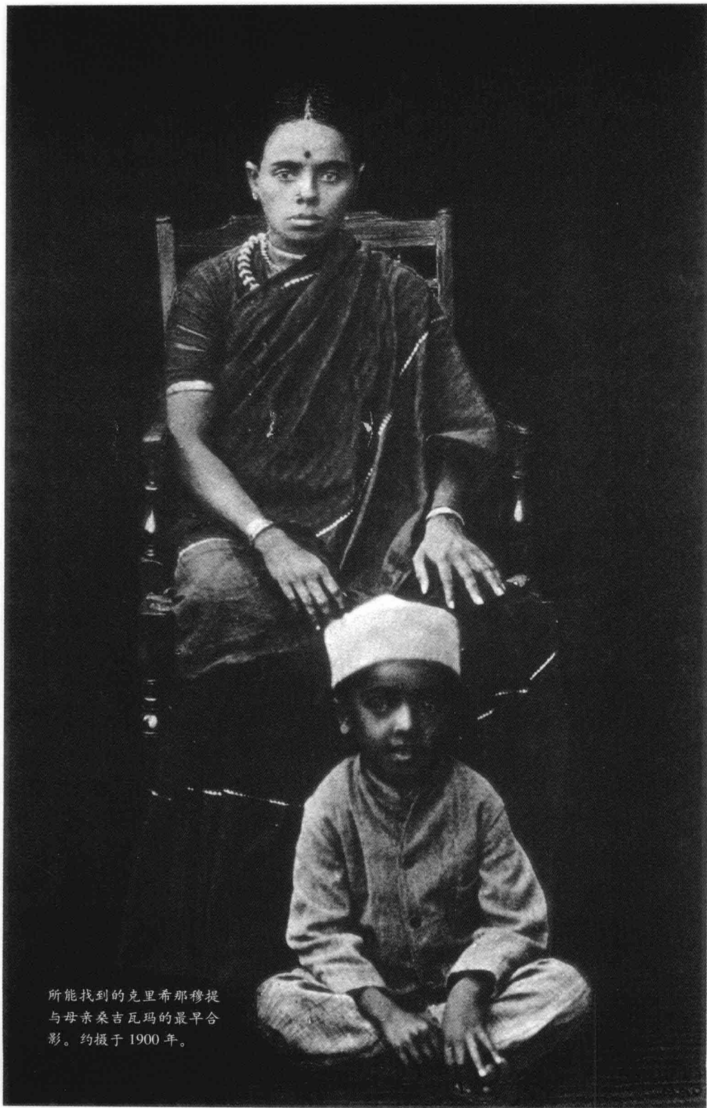
所能找到的克里希那穆提 与母亲桑吉瓦玛的最早合 影。约摄于1900年。