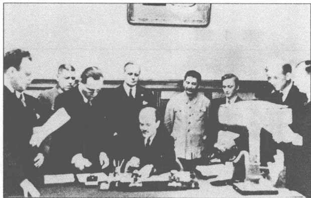
左图：1939年8月，纳粹德国外交部长冯·里宾特洛甫注视着自己的同行——苏联外交部长莫洛托夫在《苏德互不侵犯条约》上签字。

在20世纪20—30年代的演讲和著作中，于1933年建立“第三帝国”的希特勒将反犹太主义和对布尔什维克主义的刻骨仇恨融入自己慷慨激昂却黑白颠倒的演讲之中，这些极富煽动性的说辞打动了德国听众，使他们逐渐相信共产党人是德国的仇敌，是这些人在第一次世界大战中击败了德国，造成德国在20世纪20年代的穷困潦倒。