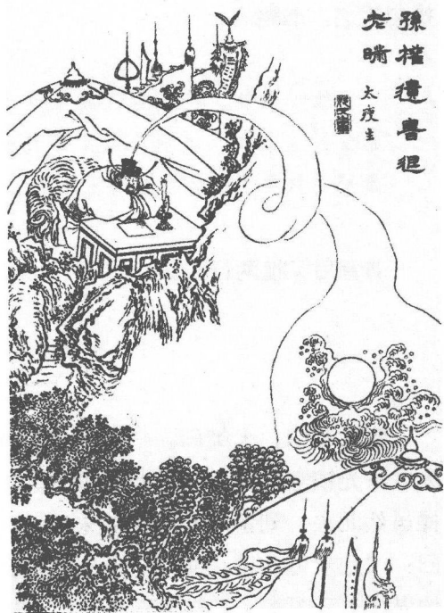
孫權遺書退 大度主

且说曹操大军至濡须，先差曹洪领三万铁甲马军，哨至江边。回报云：“遥望沿江一带，旗旛无数，不知兵聚何处。”操放心不下，自领兵前进，就濡须口排开军阵。操领百余人上山坡，遥望战船，各分队伍，依次摆列。旗分五色，兵器鲜明。当中大船上青罗伞下坐着孙权，左右文武侍立两边。操以鞭指曰：“生子当如孙仲谋！若刘景升儿子，豚犬耳！”忽一声响动，南船一齐飞奔过来。濡须坞内又一军出，冲动曹兵。曹操军马退后便走，止喝不住。忽有千百骑赶到山边，为首马上一人，碧眼紫髯。众人认得正是孙权。权自引一队马军来击曹操。操大惊，急回马时，东吴大将韩当、周泰，两骑马直冲将上来。操背后许褚纵马舞刀，敌住二将，曹操得脱归寨。许褚与二将战三十合方回。操回寨，重赏许褚，责骂众将：“临敌先退，挫吾锐气！后若如此，尽皆斩首！”是夜二更时分，忽寨外喊声大震。操急上马，见四下里火起，却被吴兵劫入大寨。杀至天明，曹兵退五十余里下寨。操心中郁闷，闲看兵书。程昱曰：“丞相既知兵法，岂不知兵贵神速乎？丞相起兵，迁延日久，故孙权得以