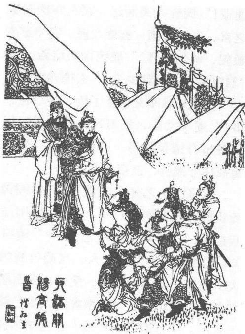
杨怀高沛 行刺 刘备

却说杨怀、高沛二人身边各藏利刃，带二百军兵，牵羊送酒，直至军前。见并无准备，心中暗喜，以为中计。人至帐下，见玄德正与庞统坐于帐中。二将声喏曰：“闻皇叔远回，特具薄礼相送。”遂进酒劝玄德。玄德曰：“二将军守关不易，当先饮此杯。”二将饮酒毕，玄德曰：“吾有密事与二将军商议。闲人退避。”遂将带来二百人尽赶出中军。玄德叱曰：“左右与吾捉下二贼！”帐后刘封、关平应声而出。杨、高二人急待争斗，刘封、关平各捉住一人。玄德喝曰：“吾与汝主是同宗兄弟，汝二人何故同谋，离间亲情？”庞统叱左右搜其身畔，果然各搜出利刃一口。统便喝斩二人。玄德还犹未决。统曰：“二人本意欲杀吾主，罪不容诛。”遂叱刀斧手斩杨怀、高沛于帐前。黄忠、魏延早将二百从人，先自捉下，不曾走了一个。玄德唤人，各赐酒压惊。玄德曰：“杨怀、高沛离间吾兄弟，又藏利刃行刺，故行诛戮。尔等无罪，不必惊疑。”众各拜谢。庞统曰：“吾今即用汝等引路，带吾军取关。各有重赏。”众皆应允。是夜二百人先行，大军随后。前军至关下叫曰：“二将军有急事回，可速开关。”城上听得是自家军，即时开关。大军一拥而入，兵不血刃，得了涪关。蜀兵皆降。玄德各加重赏，遂即分兵前后守把。次日劳军，设宴于公厅。玄德酒酣，顾庞统曰：“今日之会，可为乐乎？”庞统曰：“伐人之国而以为乐，非仁者之兵也。”玄德曰：“吾闻昔日武王伐纣，作乐象功，此亦非仁者之兵欤？汝言何不合道理？可