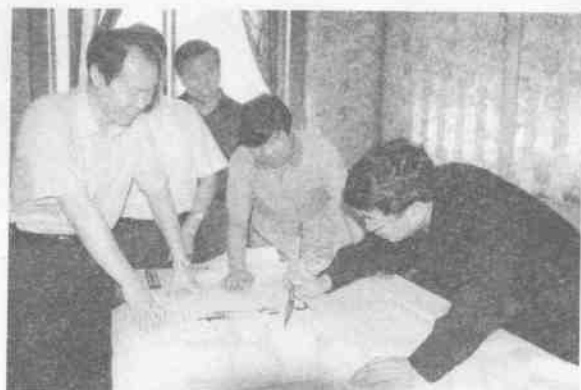
著名学者余秋雨为“新作文”题字