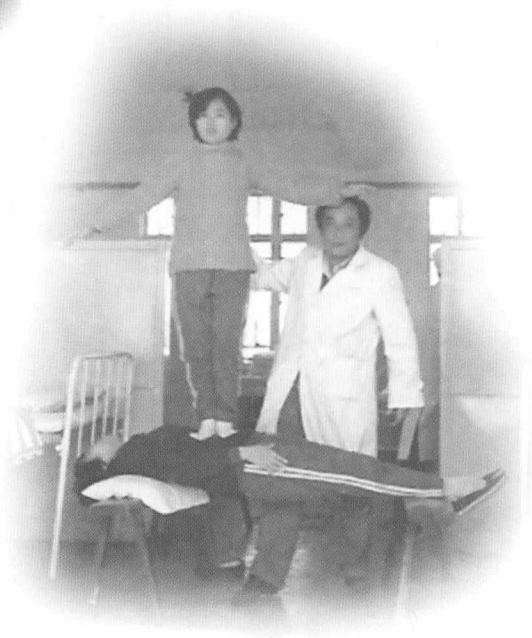
受术者躯体强直，身承另一人体站立