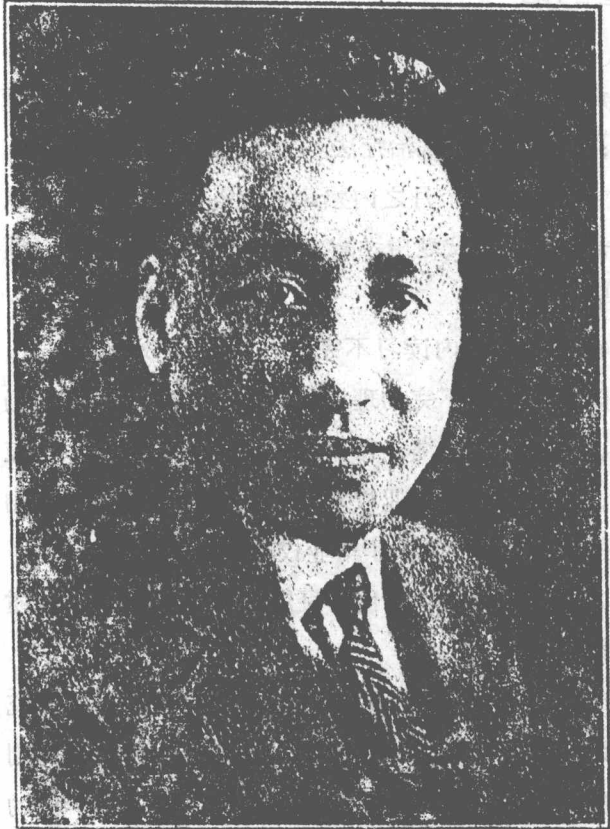
—— 氏客泮余 ——