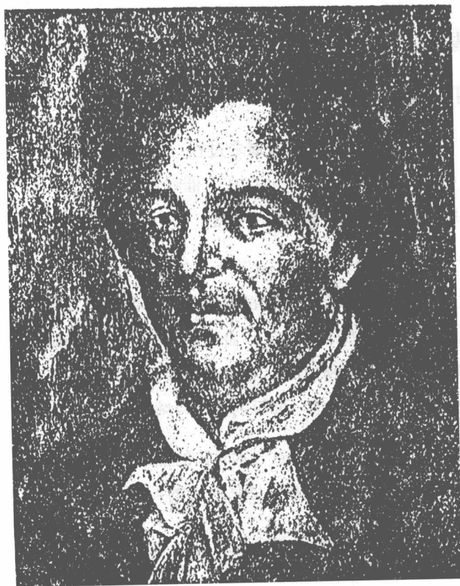
—— 氏馬士美 ——