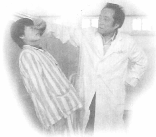
受术者痛觉消失，针刺面颊不痛