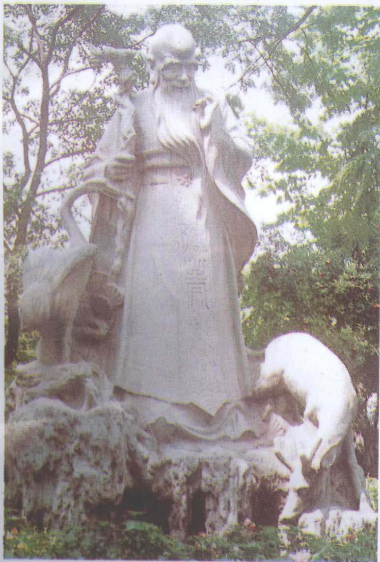
上：长寿老人（城雕）