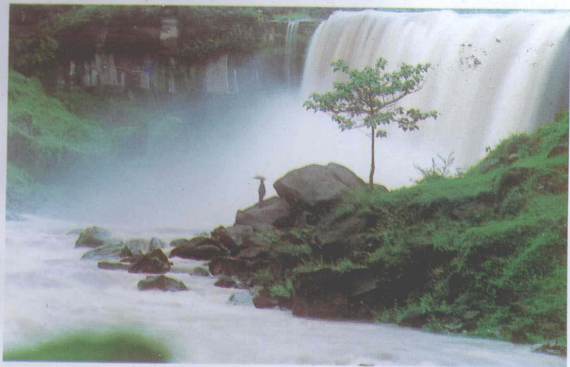
下：山洞沟瀑布