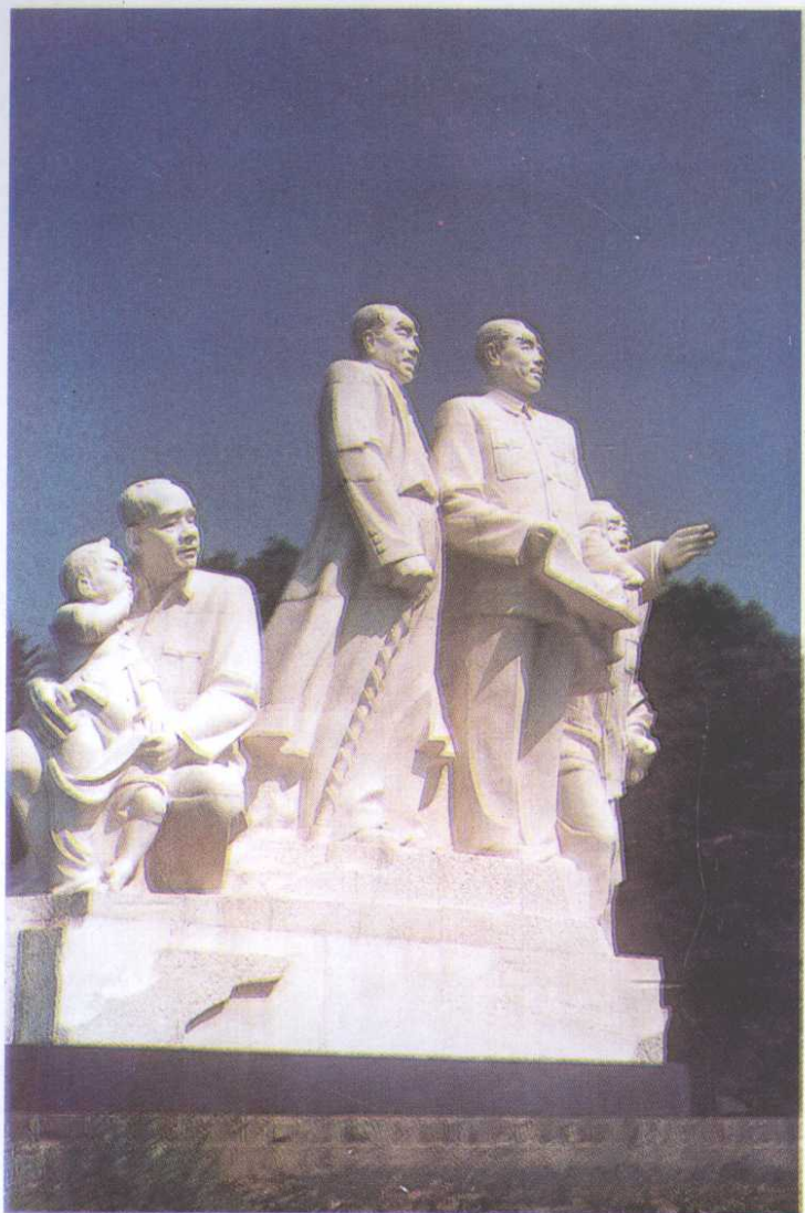
上：周恩来总理来到长寿湖（城雕）