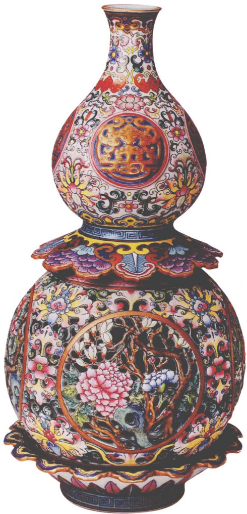
18-1 清乾隆粉彩万福万寿纹葫芦转心瓶

档案上所提这些器物，因名称与现代提法有出入，所以在清宫旧藏品中，有些很难与之相对，但有些是能够与传世品相对应的。例如，乾隆二十九年档案中提到的洋彩万福万寿纹葫芦转璇瓶，就是故宫现存的粉彩万福万寿纹葫芦转心瓶（18-1），那两件青云红龙宝月瓶，实际上是指传世品中的青花釉里红龙纹宝月瓶（18-2）。此瓶小口、直颈、圆腹，颈部饰双耳，腹部青花绘云纹，正面龙纹为釉里红色。另二件霁青釉描金多喜瓶，是指传世品中的霁蓝釉描金三果图瓶（18-3）。此瓶呈椭圆形，通体以霁蓝釉为地，金彩描绘缠枝花卉纹饰，腹部四面开光，均绘粉彩桃、石榴、佛手图，寓意“福寿三多”亦称“福寿三喜”。此外档案中提到的成对洋彩万福万寿玲珑香筒，同样也可与一件粉彩镂空亭式香筒相对应。乾隆档案中所提的洋彩，即今日粉彩。此香筒在器身镂空部位以金彩书100个变形寿字，器口、足径处在蓝地锦纹上又各绘五只红彩蝙蝠，器座以酱釉仿檀木效果，龙形器盖钮施金彩仿铜鎏金。此香筒不仅制作精美，创新也相当独特，它使香气带着万福万寿之意在整个皇宫中扩散（18-4）。