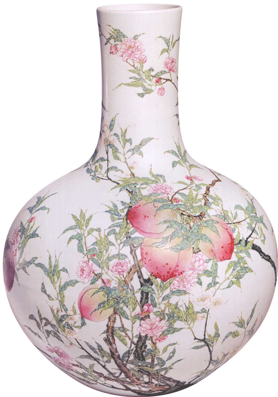
18-12 清雍正粉彩桃纹天球瓶