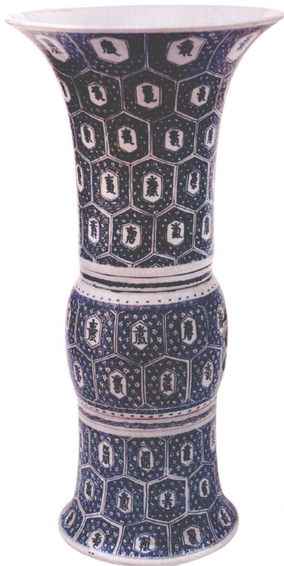
18-6 清康熙青花百寿字花瓶

寿字大瓶，但仍营造了一种浓浓的吉祥气氛（18-6、7、8、9、10）。另外一件光绪时期盖碗，器身与盖面在黄色釉地上各开四个圆形开光，内书金彩万寿无疆4字，并配以蝙蝠、寿桃、卍字纹等，其意更加明确。从档案记载看此盖碗为慈禧60寿辰的器物，这种纹饰的器物还见有大碗、渣斗、盘、羹匙等，说明当时是成套烧制的（18-11）。