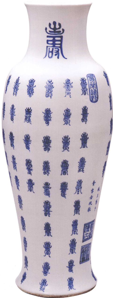
18-7 清康熙青花百寿字瓶