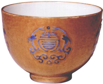
18-10 清康熙金地团寿字小盅