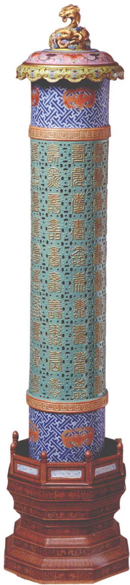
18-4 清乾隆粉彩万福万寿纹镂空亭式香筒