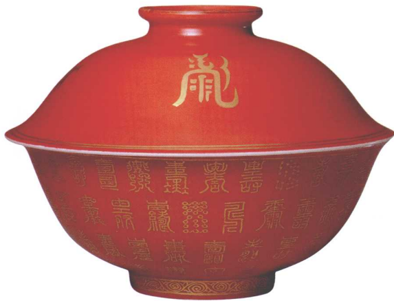
18-9 清康熙红地描金寿字盖碗