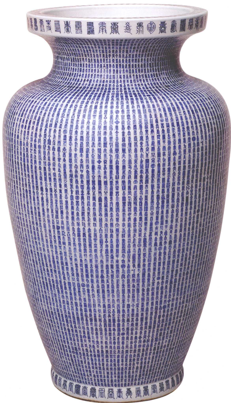
18-5 清康熙青花万寿字大瓶