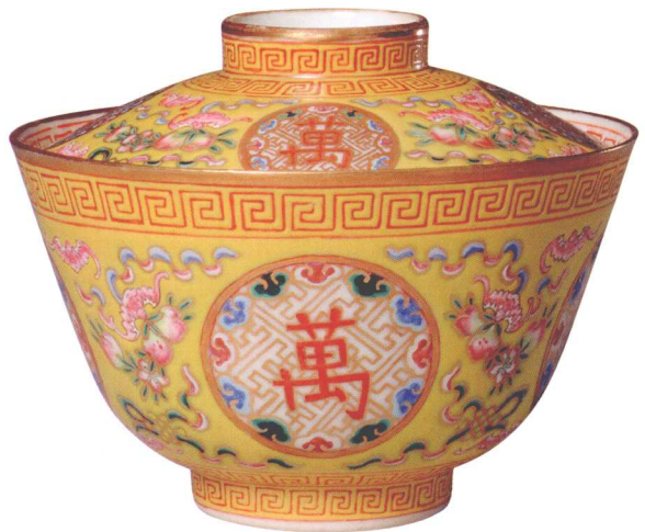
18-11 清光绪粉彩万寿无疆茶盏