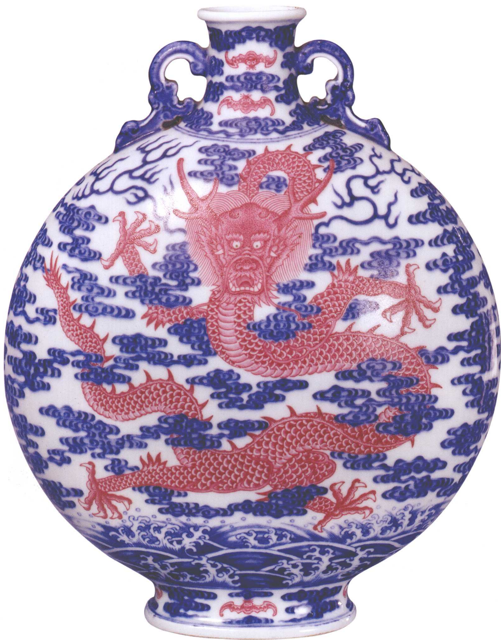
18-2 清乾隆青花釉里红龙纹宝月瓶