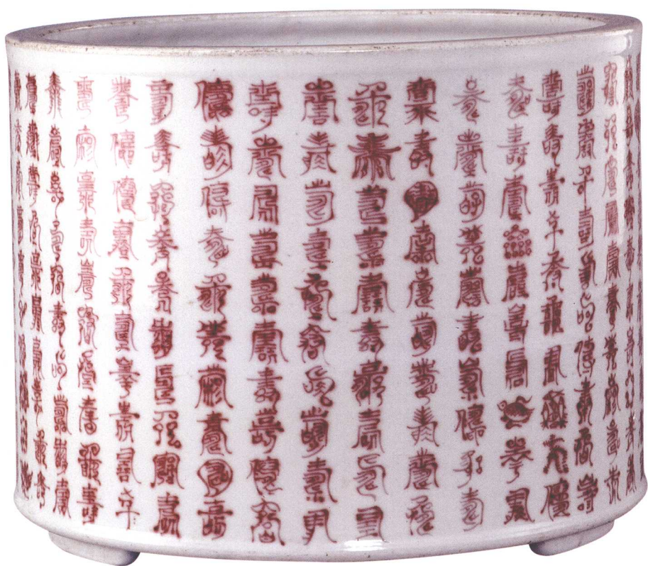
18-8 清康熙釉里红百寿字笔筒