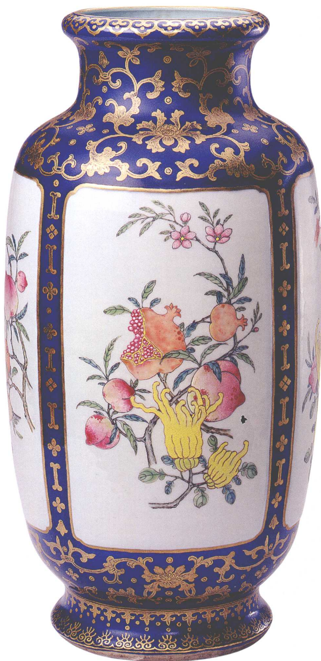
18-3 清乾隆霁蓝釉描金三果图瓶