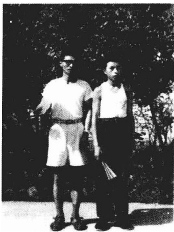
作者和小弟 1970年摄于北碚