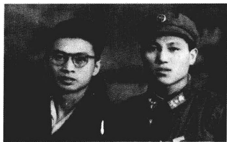
作者和大弟 1964年摄于达县