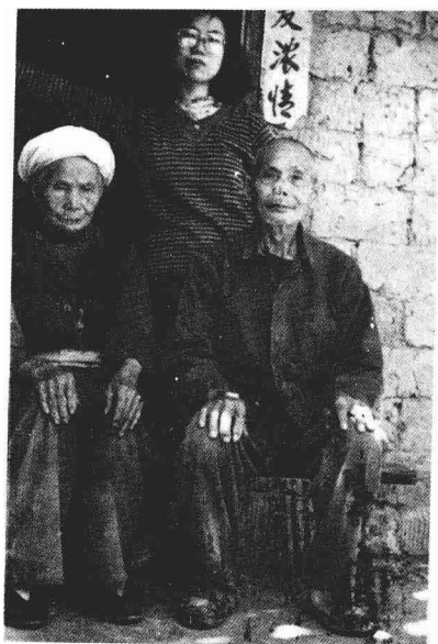
母亲、父亲和大女儿 1993 年6月初摄于老家。