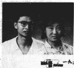
一九六三年 作者和妻子 1963年摄于北碚