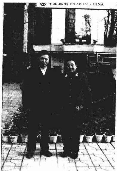
作者和妻子 2002年1月摄于北碚