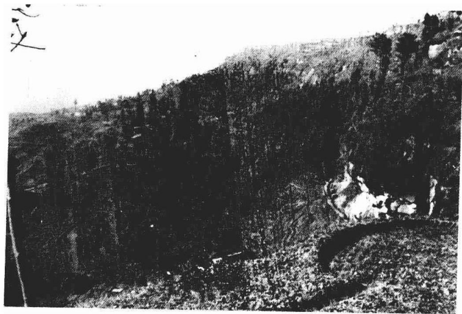
新屋塙全景 1985年10月摄