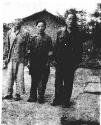
父亲、母亲和干 爹(从左到右)1991 年夏摄于家中。