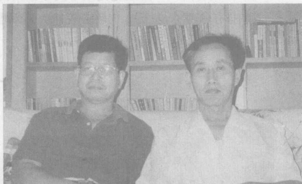
与公仲先生合影 (2001年)