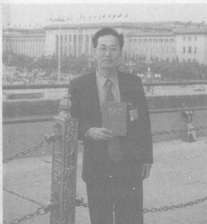
“祖国万岁”座谈会天安门 留影(2000年)