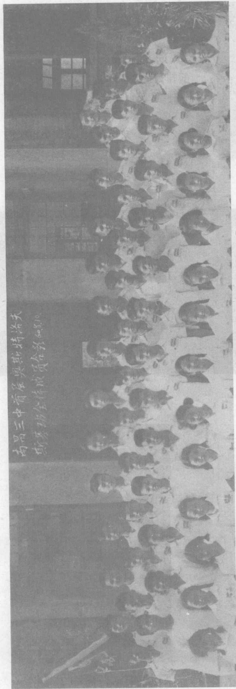
南昌三中首届奥斯特洛夫斯基班全体同学合影