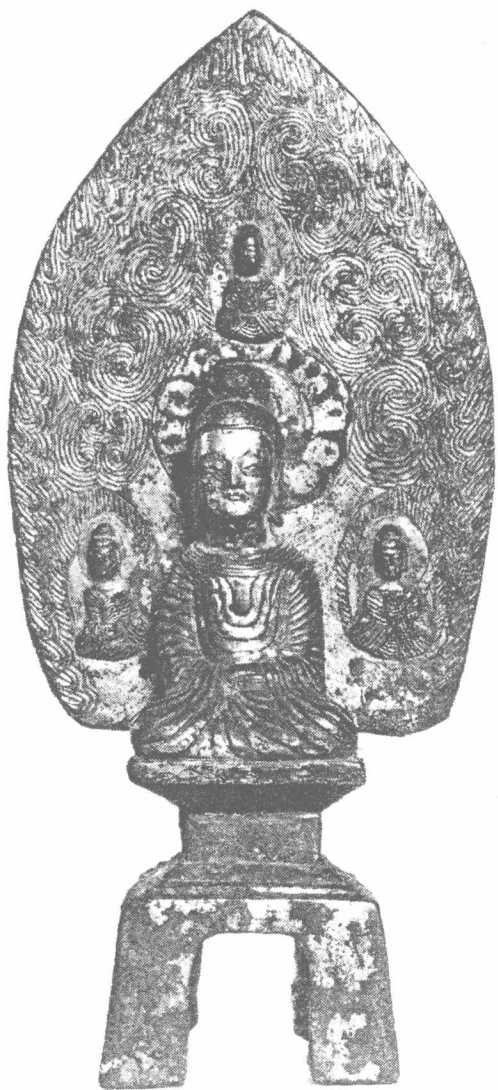
图003南朝元嘉十四年造佛铜像