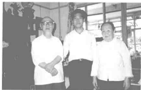
1992年5月29日，作者拜师入门，与师父及师母合影留念