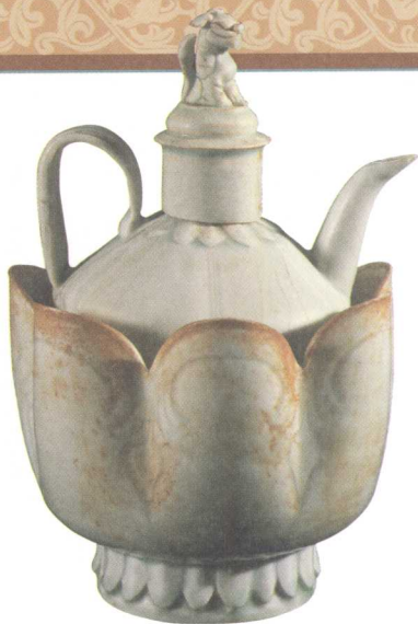
影青刻花注子注碗 宋

這是一組製工精美的酒具。下面是用於盪酒的注碗，上面是盛酒的注子，置於注碗內，蓋頂塑一蹲獅。造型美觀，釉色素雅，是宋代酒具中的精品。