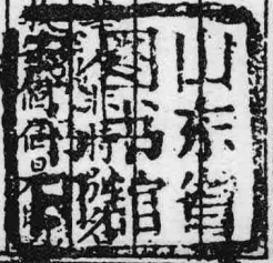
會文堂石印本《兩晉通俗演義》第一回