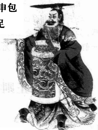
秦始皇（前259—前210），姓嬴，名政。首位完成中国统一的秦王朝的开国皇帝。

春秋时的伍子胥，为了报父兄之仇，誓言灭楚，终于破了楚的首都郢，鞭仇人之尸；而当时的申包胥则发誓保全楚国，终于获得秦军救援，使楚国不致灭亡。由此可见，人只要决心