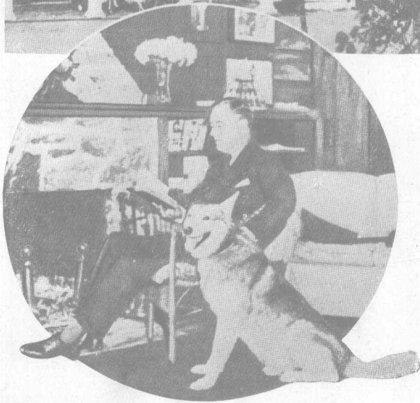
在溫泉別莊中的羅斯福