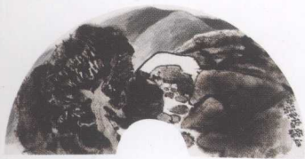
白龙桥(扇面) 1998年 纸本