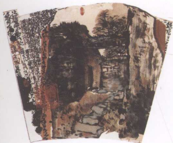
老屋记游(扇面) 1998年 纸本

变迁痕迹、错落有致的徽州黑瓦白墙的村落，皖南别具特色的“黑”而“湿”的山水，给他以无穷的灵感，成为他反复提炼的艺术素材。二是珍惜和发扬自己的个性。他生性崇尚自然，讲究朴实、率真，追求阳刚之气。这两者的有机结合，形成它艺术风格的基础。