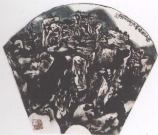
黄山始信峰(扇面) 2000年 纸本