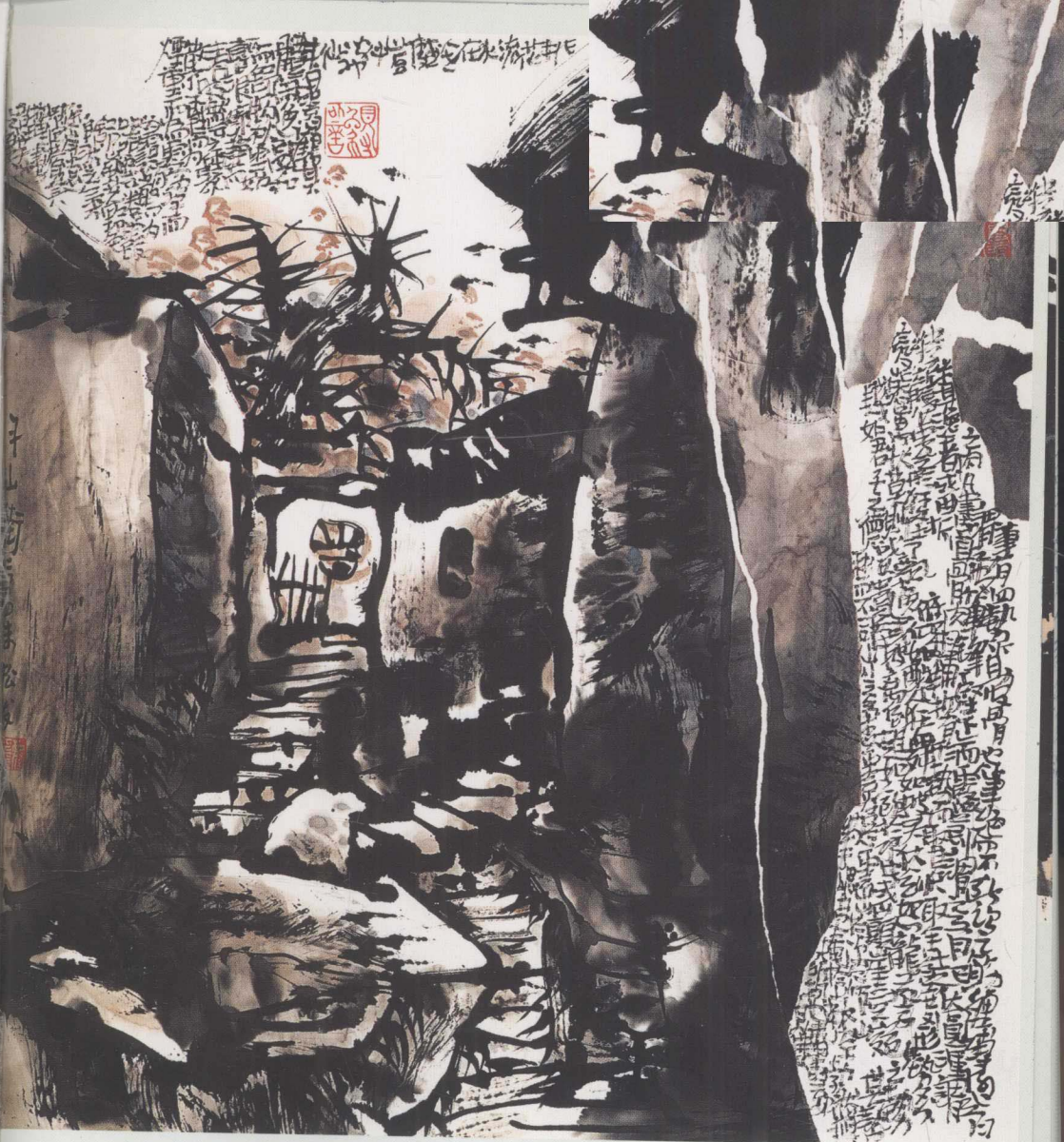
ZHU SONGFA SHUIMO WANNAN ZUOPIN