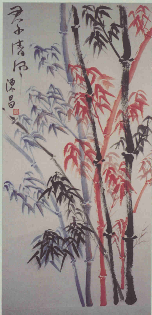
文人畫作品(藝術療法)