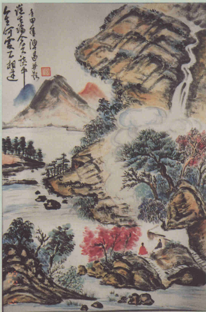
文人畫作品(藝術療法)