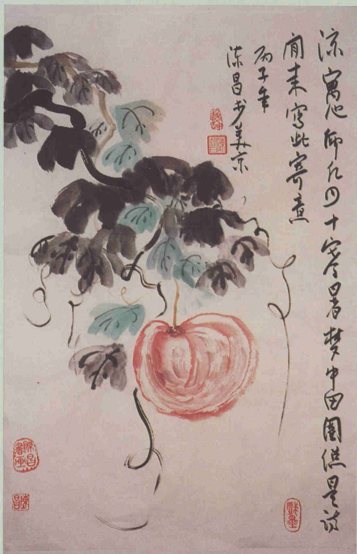
文人畫作品(藝術療法)