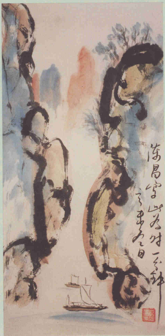
文人畫作品(藝術療法)