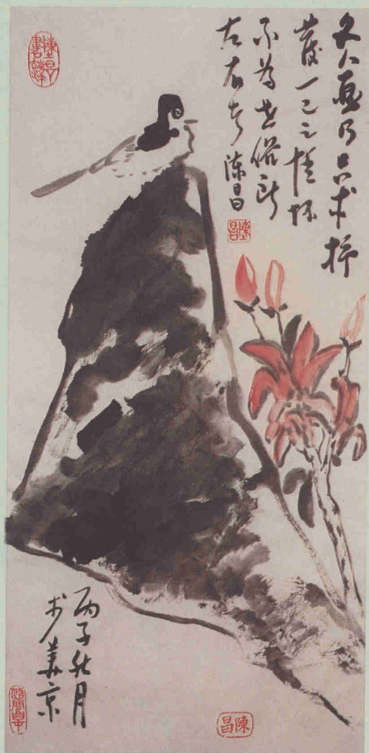
文人畫作品(藝術療法)