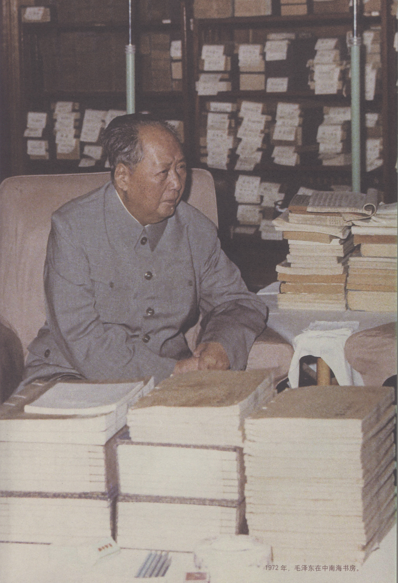
1972年，毛泽东在中南海书房。