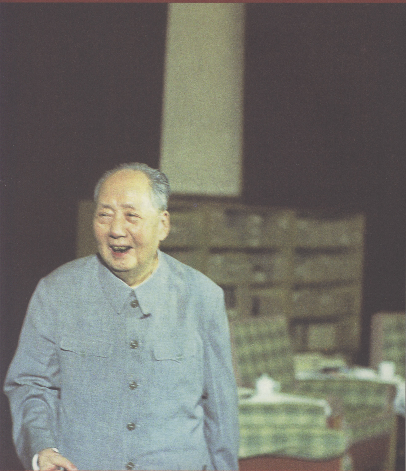
1974年，毛泽东在中南海书房。