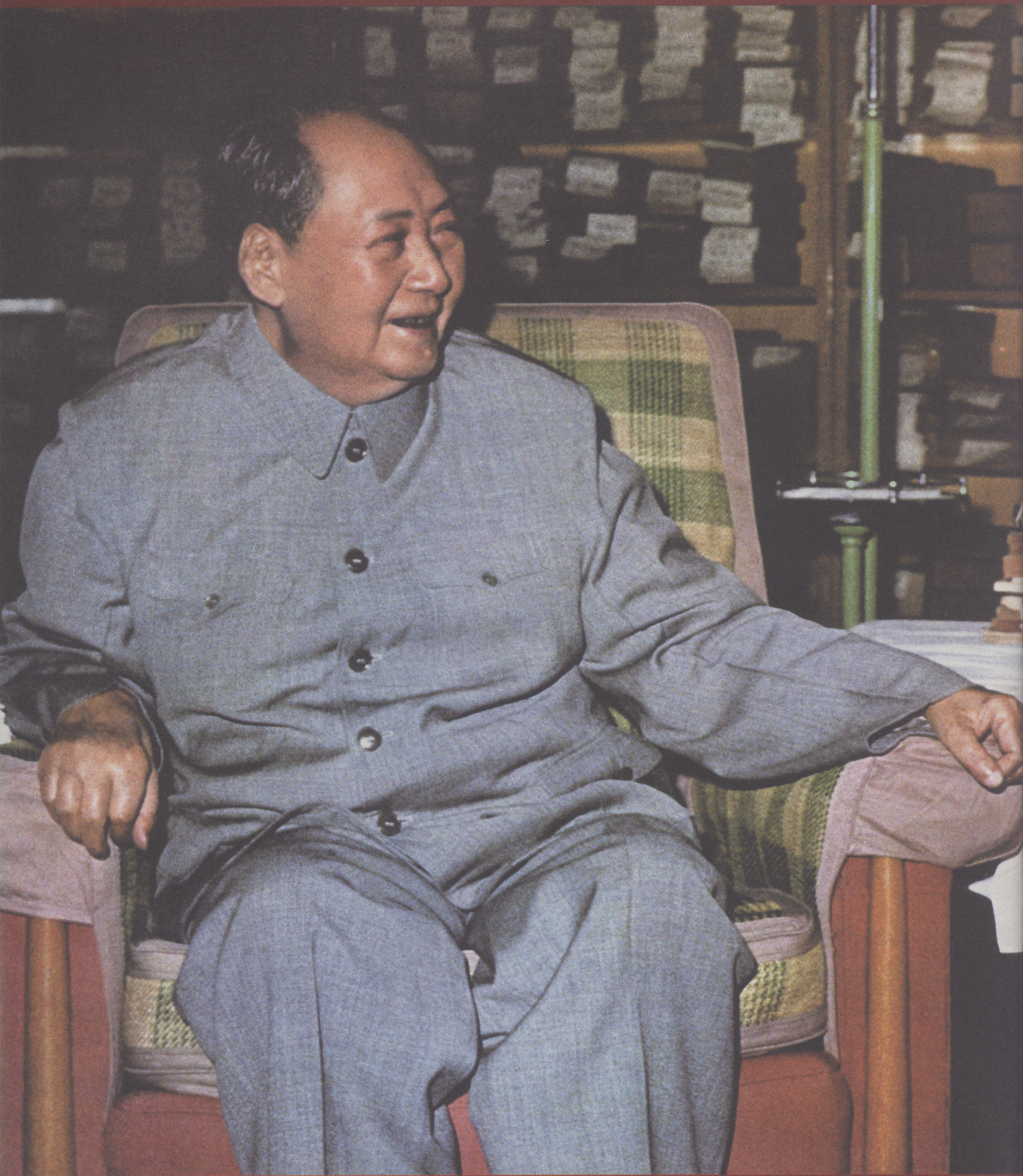
1973年，毛泽东在中南海书房。