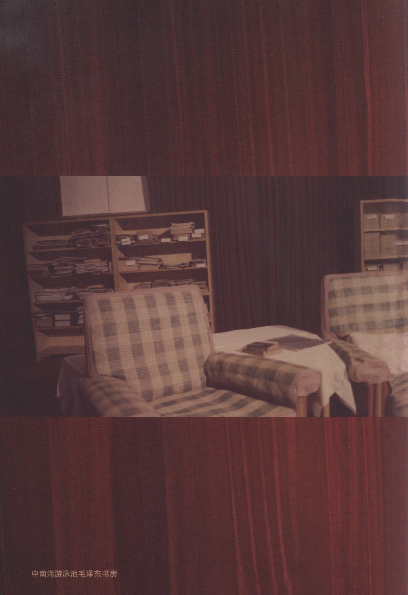
中南海游泳池毛泽东书房