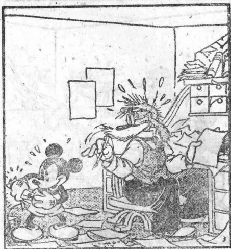
米凱的眼睛放光了