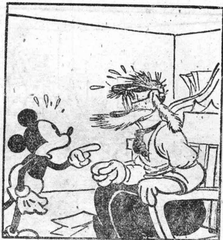
第 一 批 款 子