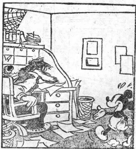
傅狐主筆轉過身來