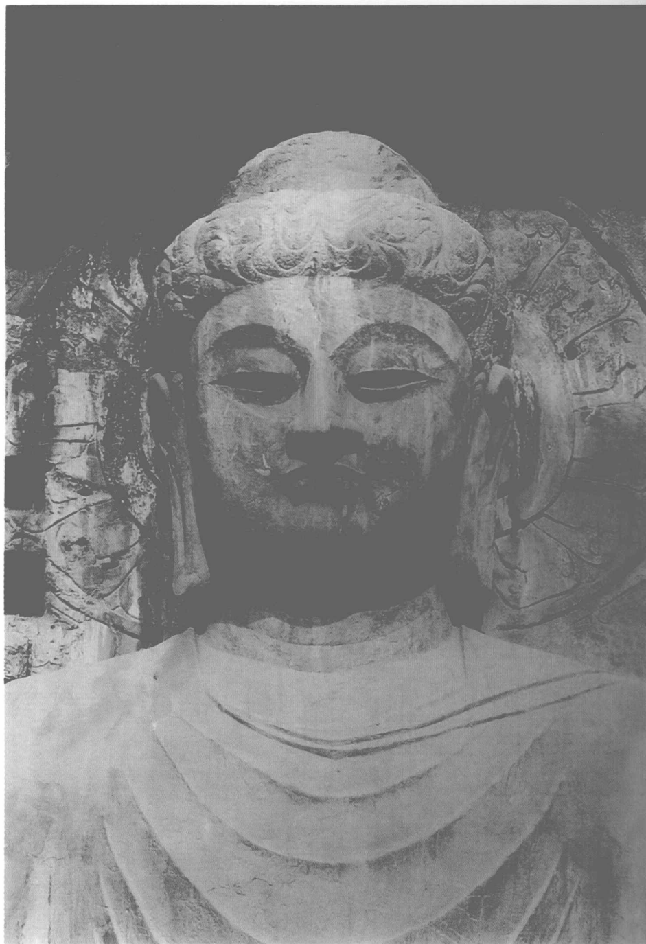
善導大師監造之龍門大佛