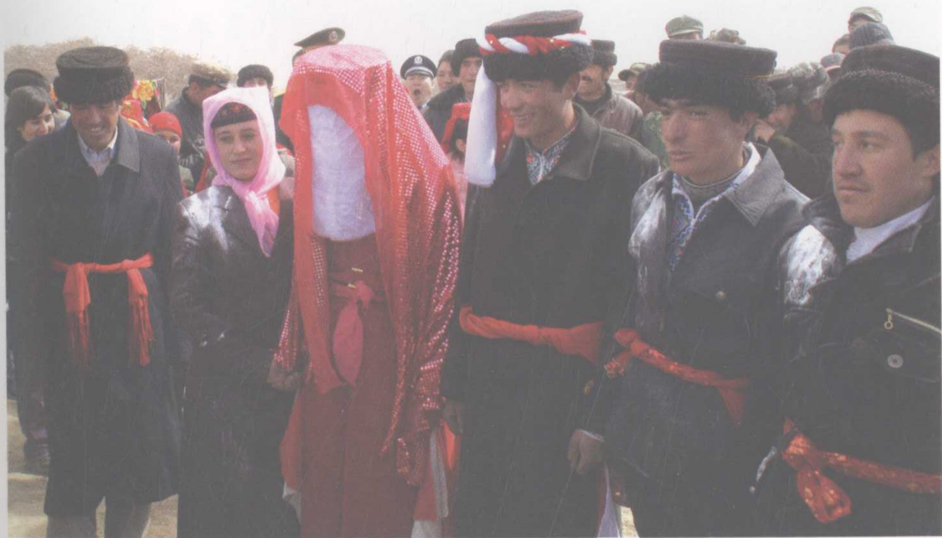
独特的迎亲仪式