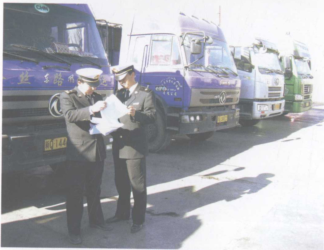
海关工作人员在查验 出入境货单