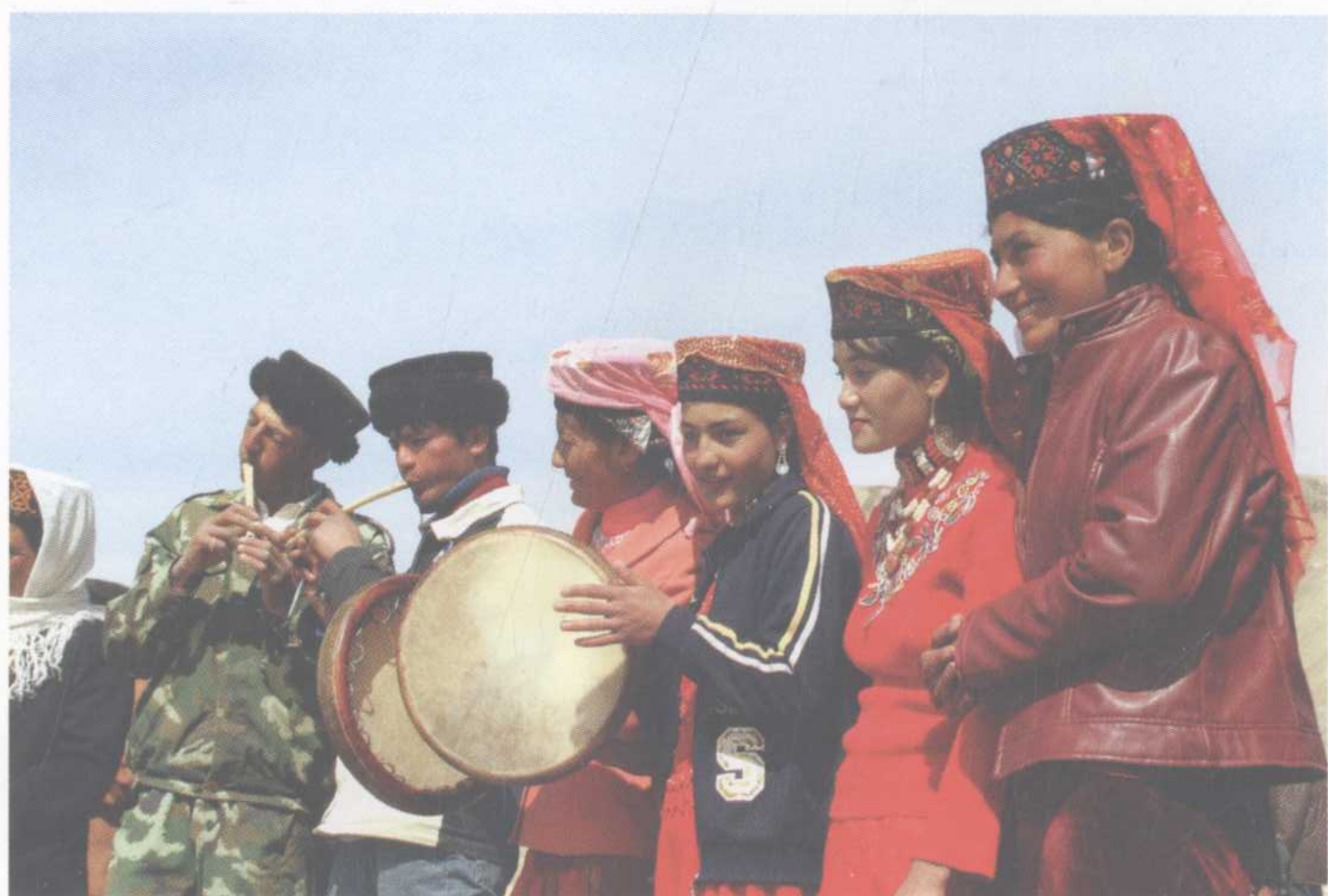
年轻人、鹰笛和手鼓