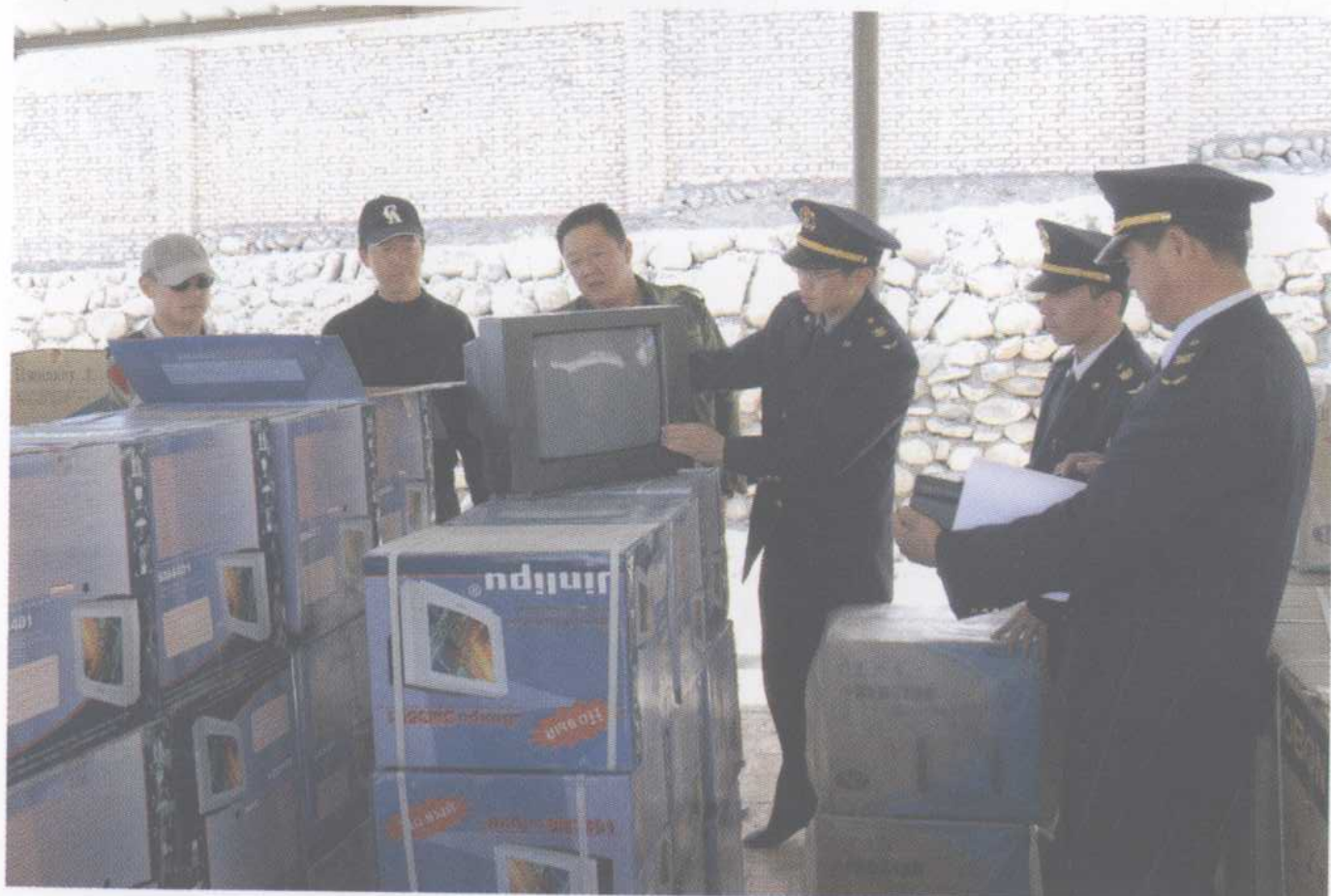
检验检疫人员在卡拉苏 口岸检查出口至塔吉克 斯坦的国产电视机