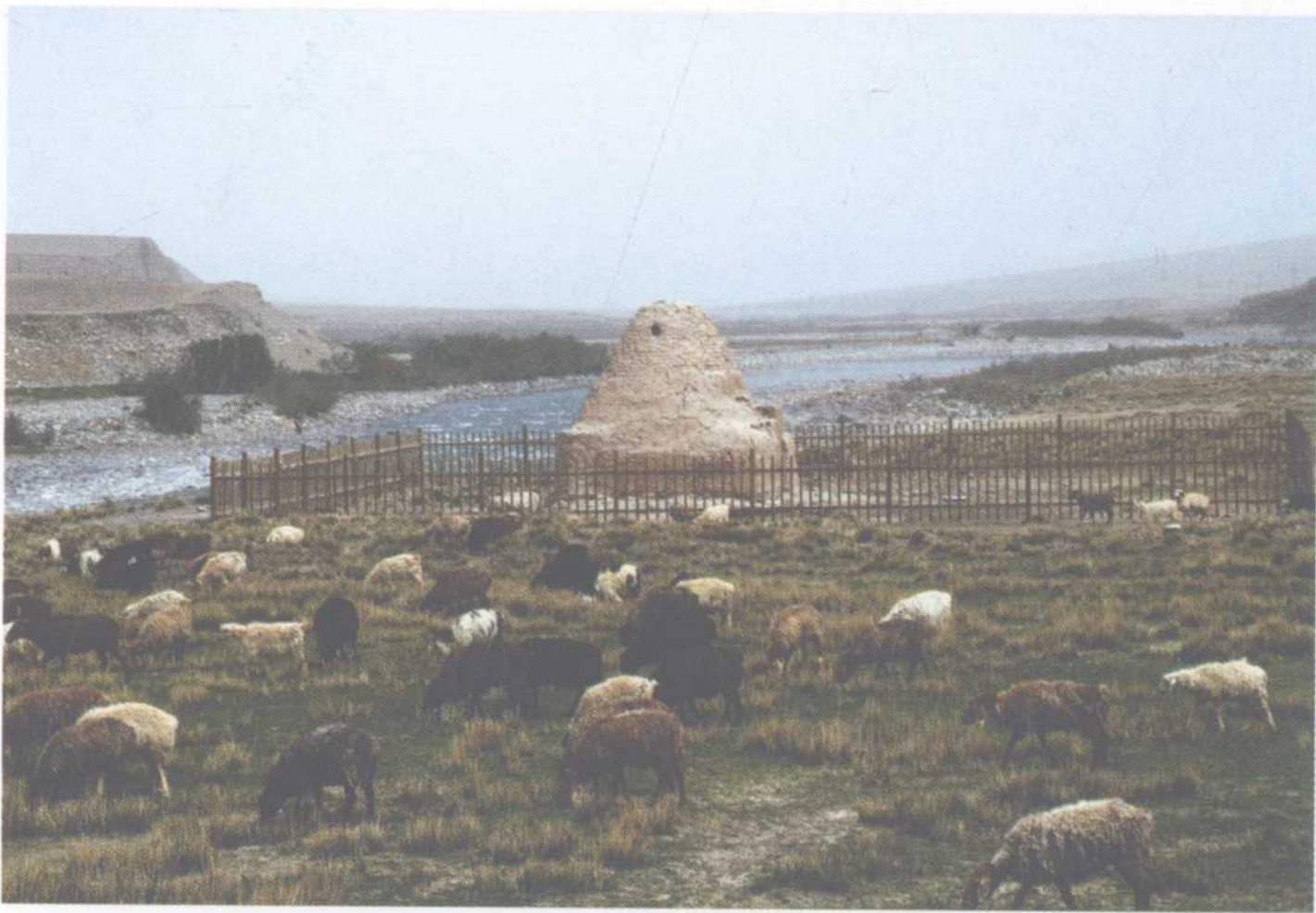
古丝绸之路上的驿站