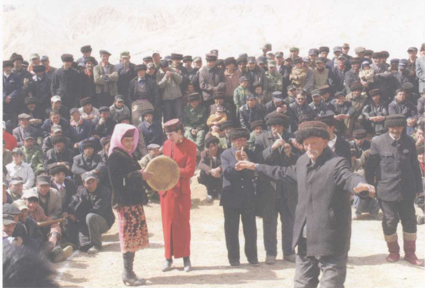
欢乐的塔吉克歌舞 (张开瑚 摄影)