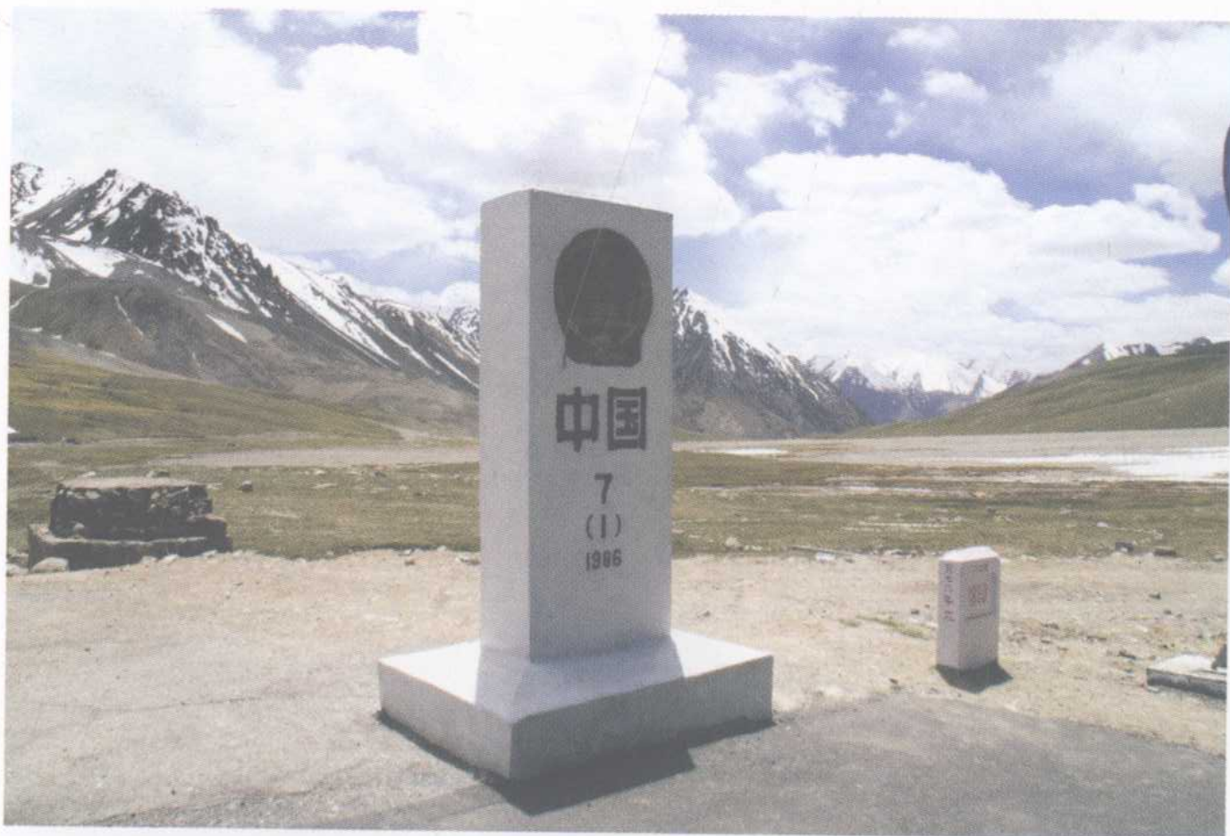
红其拉甫界碑