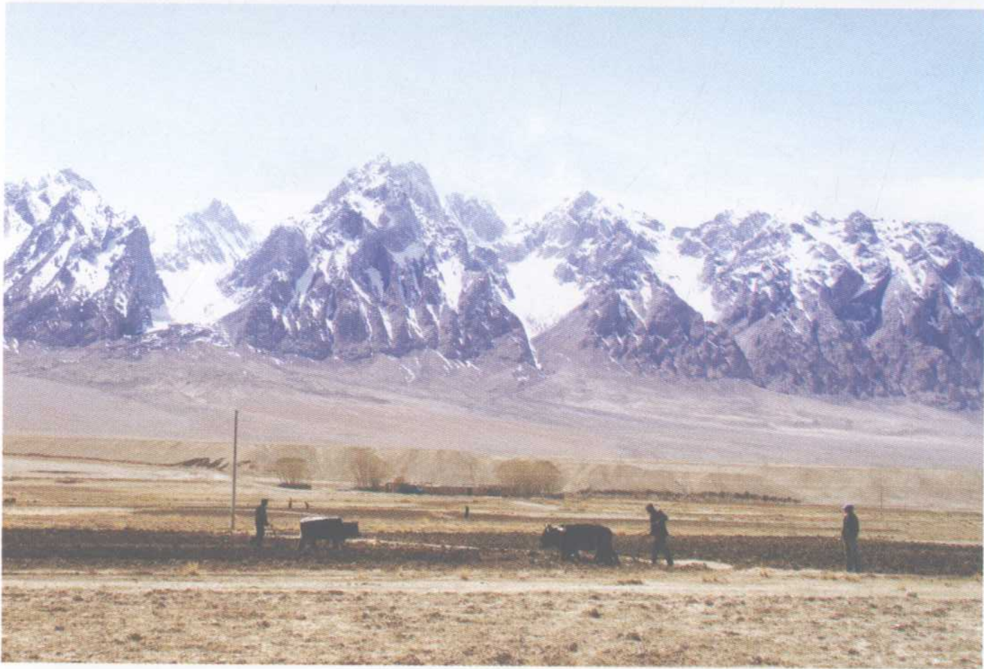
冰山脚下好耕田