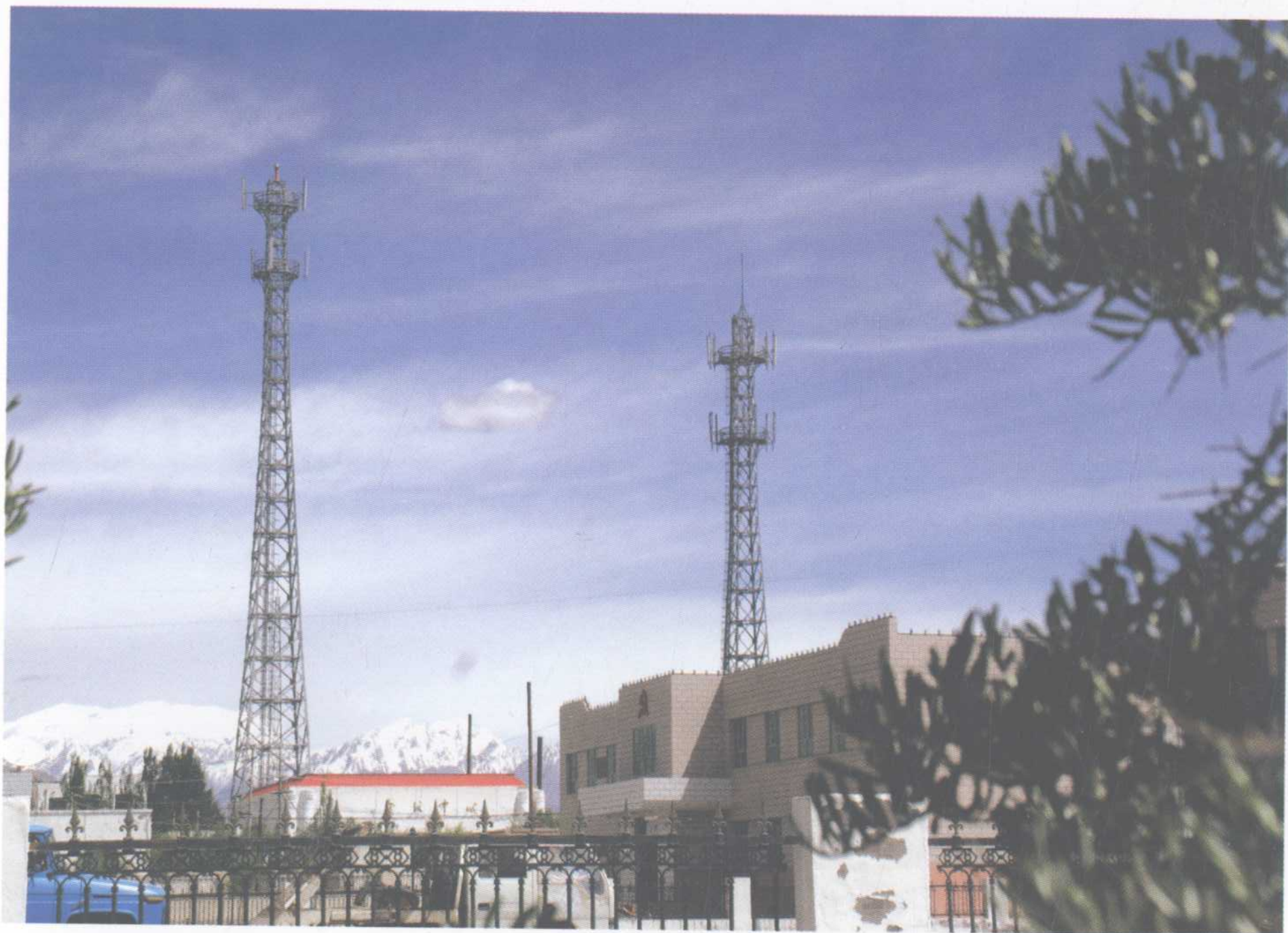
电信事业有了新的发展