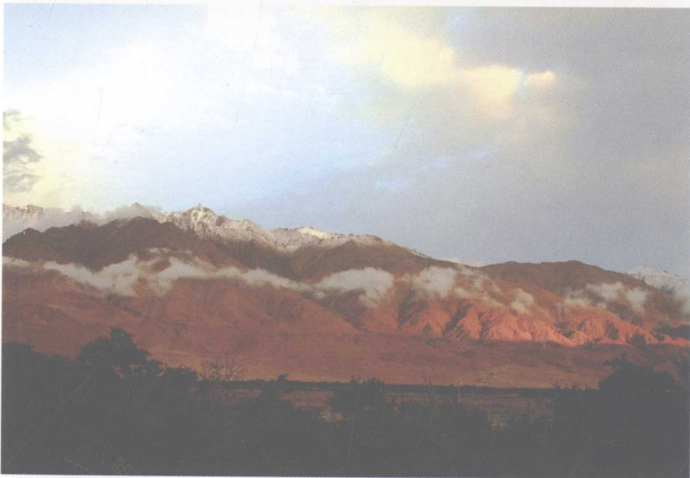
晨曦中的申关口