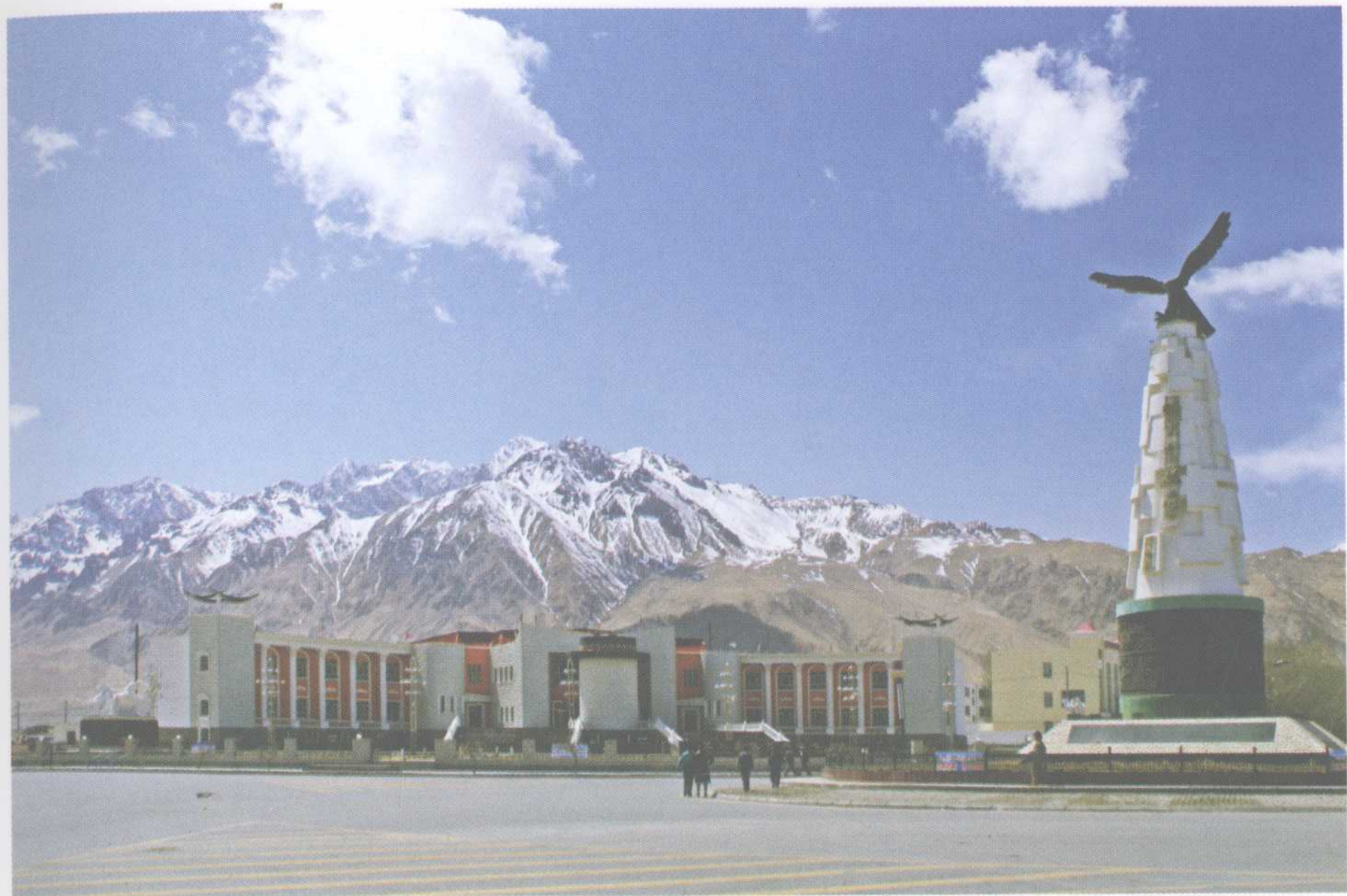
民族文化艺术中心和雄鹰纪念碑