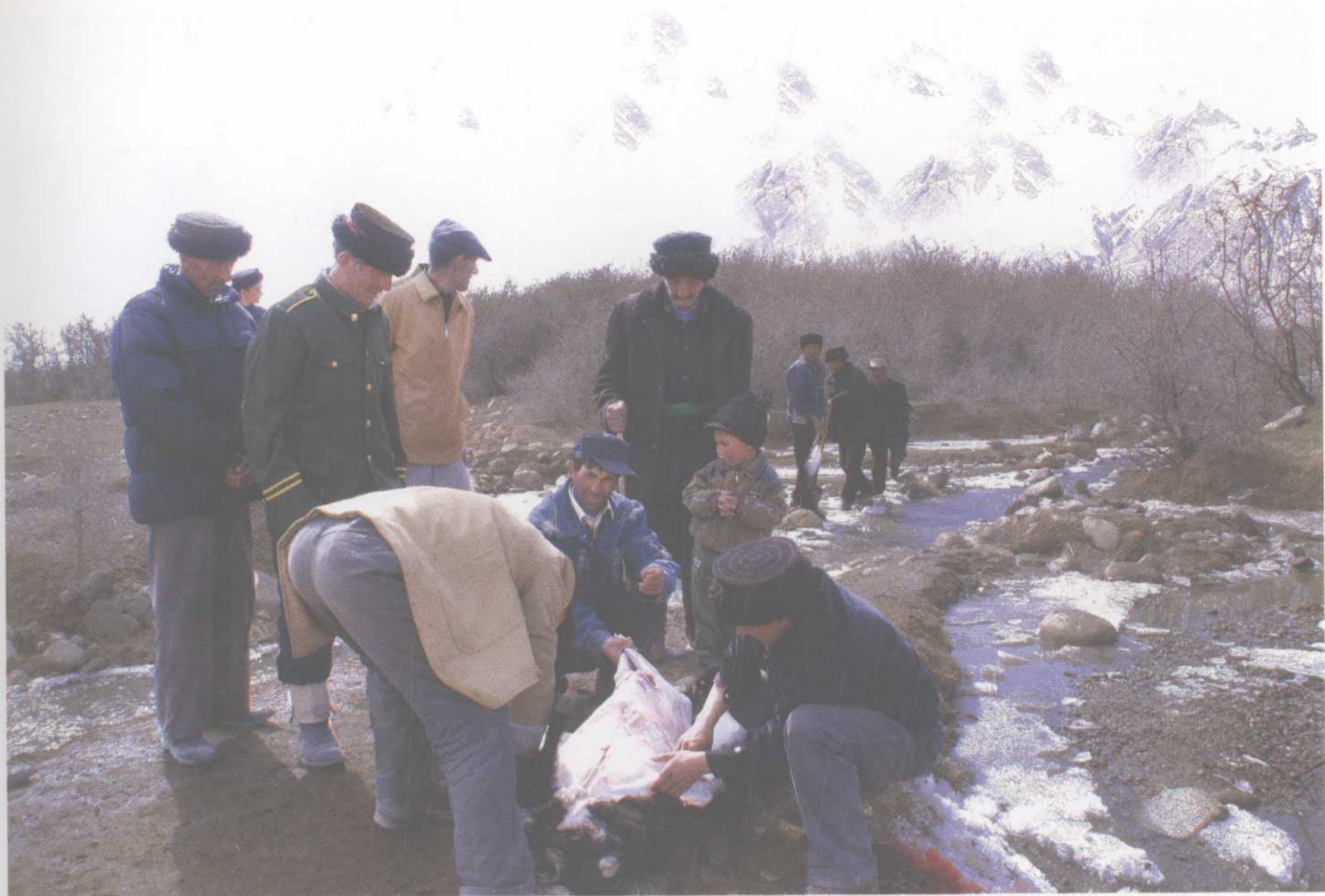
传统的塔吉克农事节日“祖吾尔”节