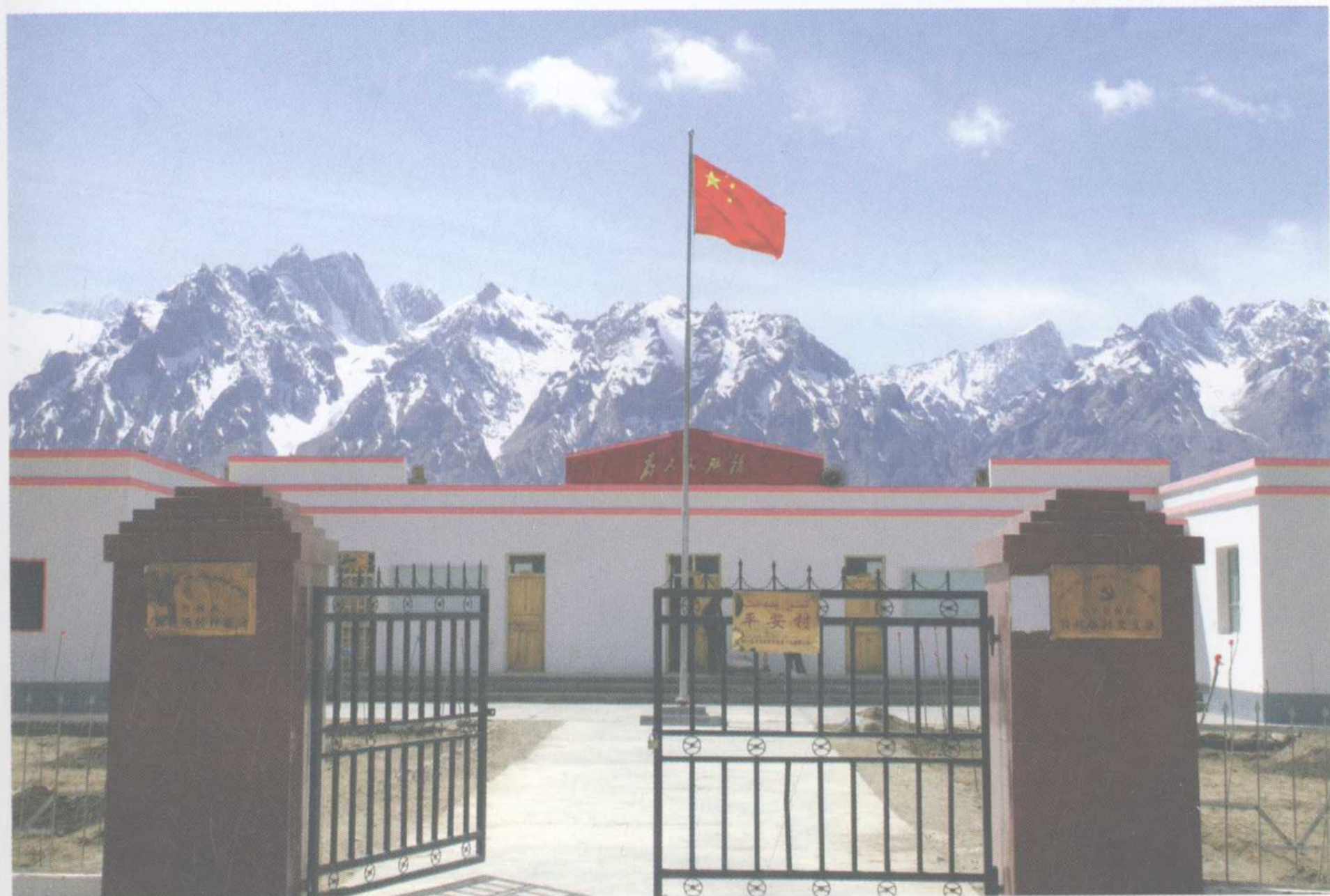
基层村级政权建设