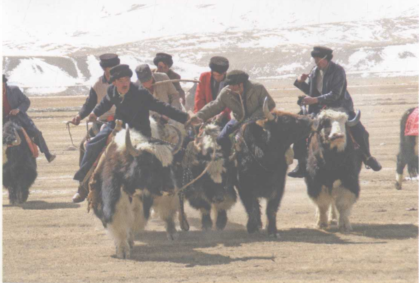
牦牛刁羊