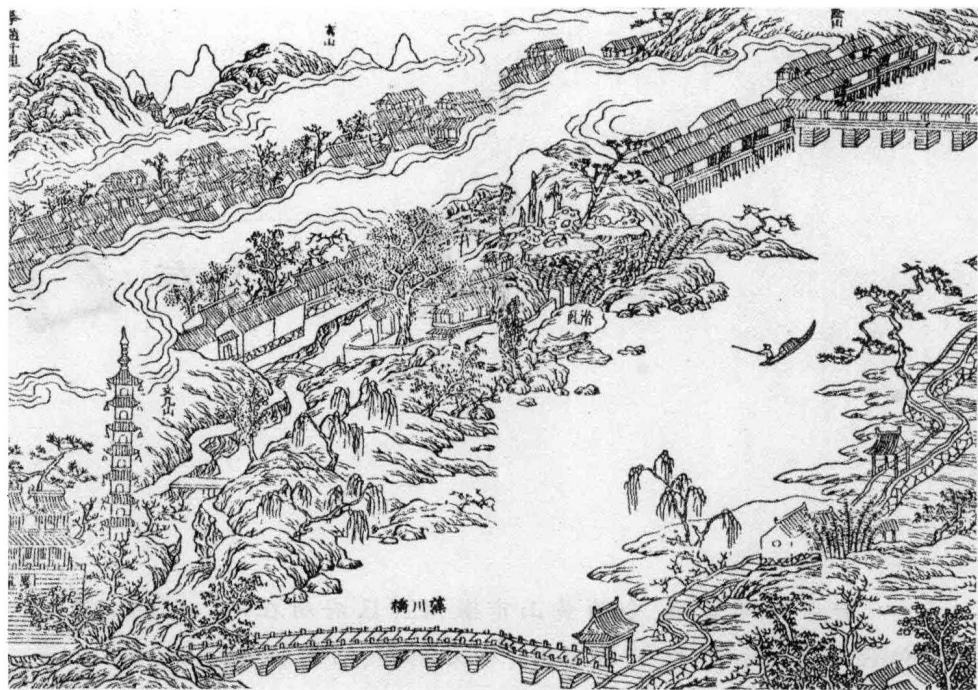
明代木刻版画岩寺全景

意思是说，俺们岩寺虽然不大，却独独能够以镇来命名——大约那时候“镇”很稀罕——并不是一般人认为的只是房多钱多车多人多故意虚张声势，而是大有来头的啊！