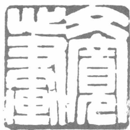
黃文寬印 文寬心畫