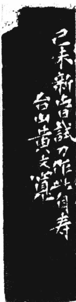
黃文寬印 文寬心畫 文寬古稀后作