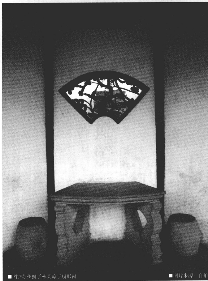
■图2#苏州狮子林某凉亭扇形窗

■□五色，东方谓之青，南方谓之赤，西方谓之白，北方谓之黑。天谓之玄，地谓之黄。地指的就是土，土的颜色是黄色，位于方位之中央。按居中观念，以黄为尊。如河南偃师县大郊寨村北路水岸边，有一座我国历史上最早的天文观测遗址——东汉灵台。土台的四周墙壁根据四方属性不同，分别涂了青、白、朱、黑14种颜色，青色代表东方的青龙，白色代表西方的白虎，朱色代表南方的朱雀，黑色代表北方的玄武。