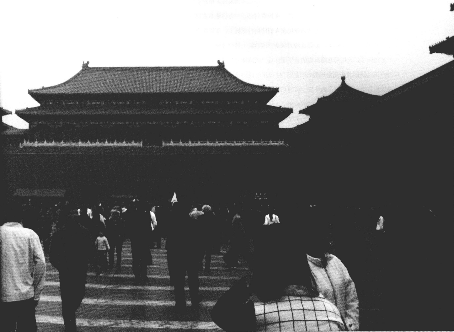
■图1 故宫午门