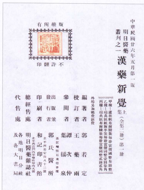
1937年版《汉药新觉》上集第一册之封面及版权页