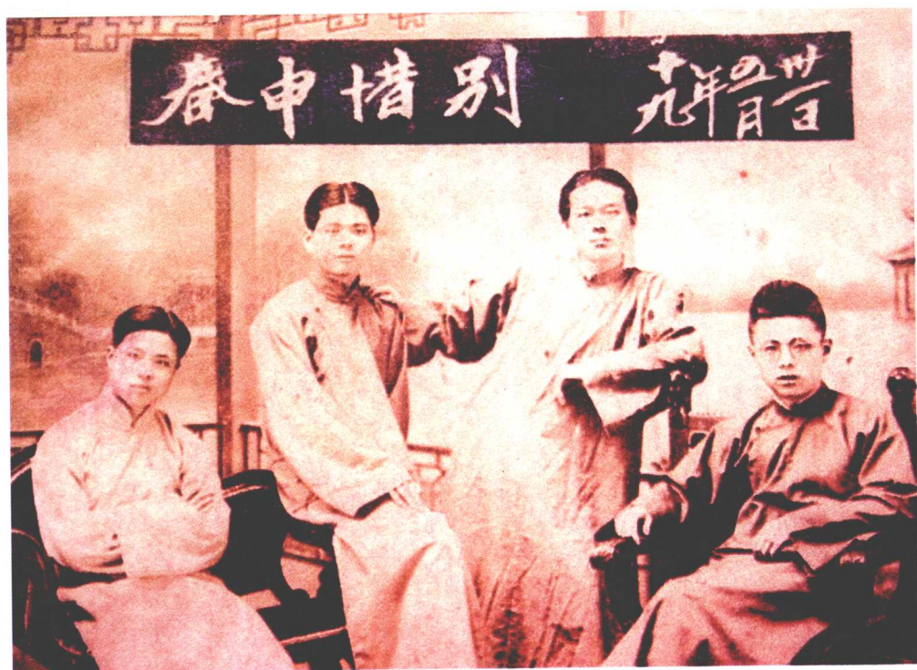
20世纪30年代倡导中药科学化的代表医家（左二为本书作者）