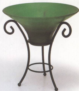
铁与玻璃组合花器

可以用来盛花的容器很多,信手拈来的一件家用物品,只要构思新颖,同样能做出好作品。日常生活中我们常见的一些杯、盘、碗、瓶以及一些精美而弃之可惜的包装盒,都可能成为一件很好的花器,本书中就有许多这样的例子,大家在后面可以看到。