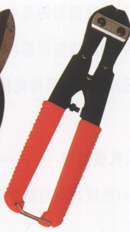
剪人造花的大力剪