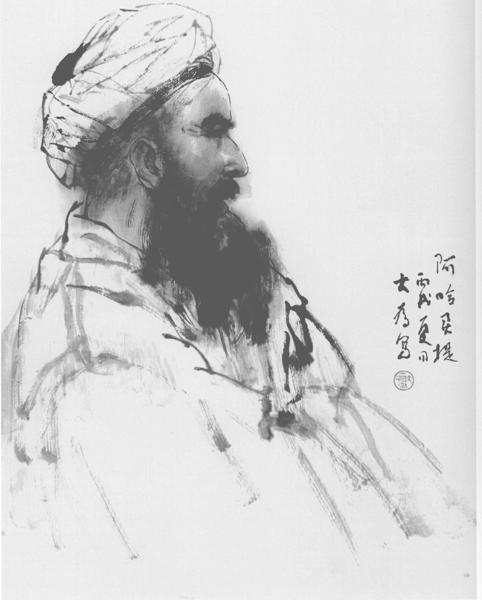
刘大为 水墨写生 90cm × 68cm 2006年