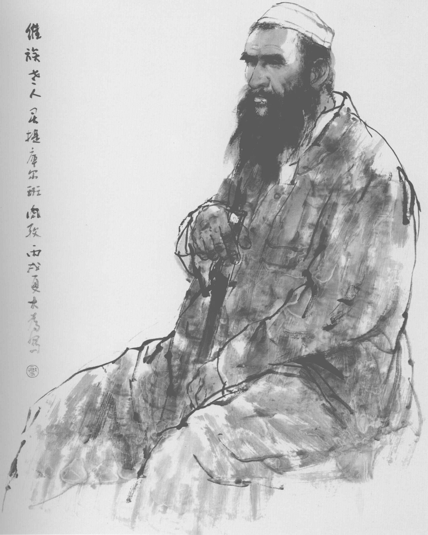
刘大为 水墨写生 75cm × 68cm 2006年