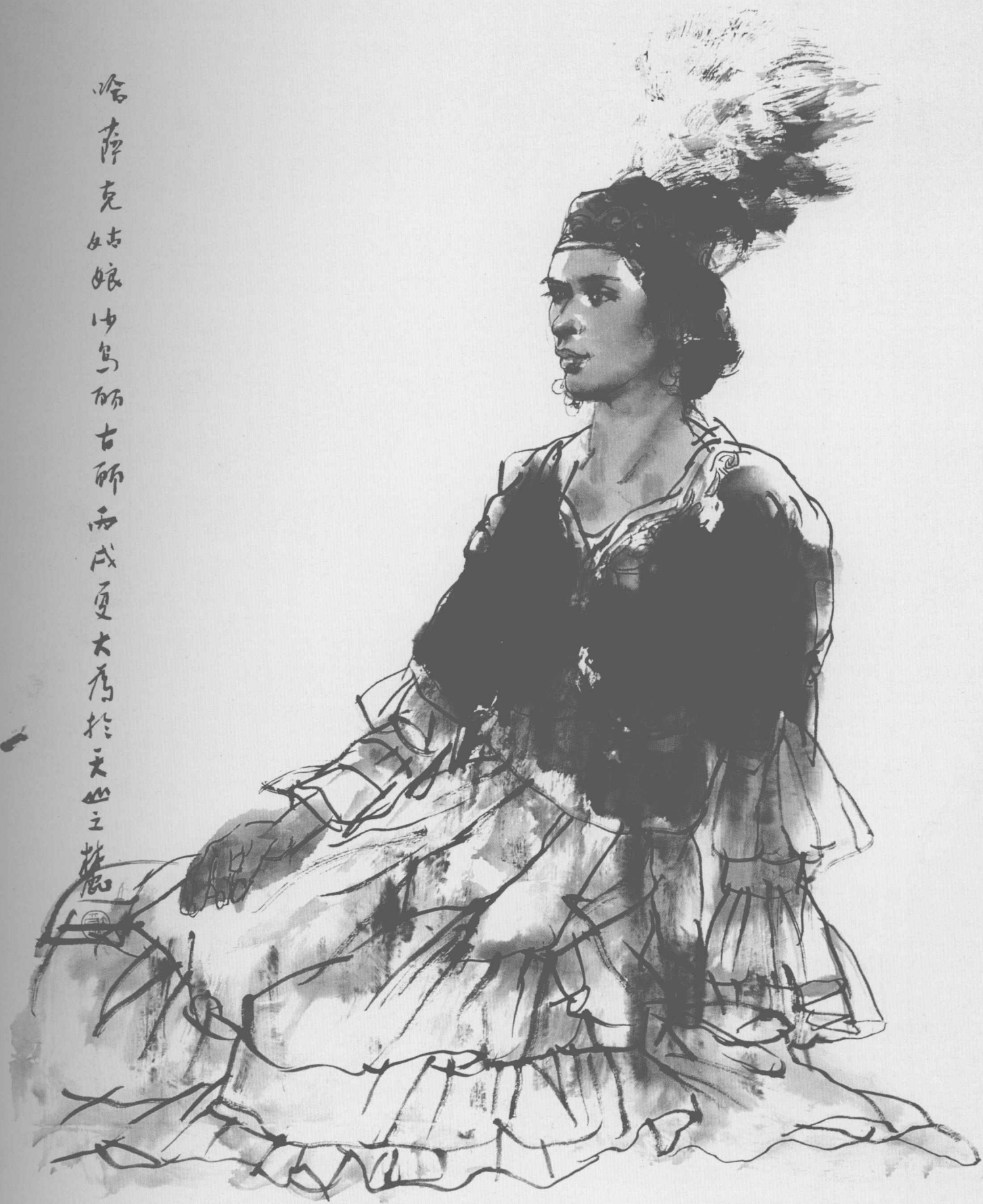
刘大为 水墨写生 100cm × 68cm 2006年