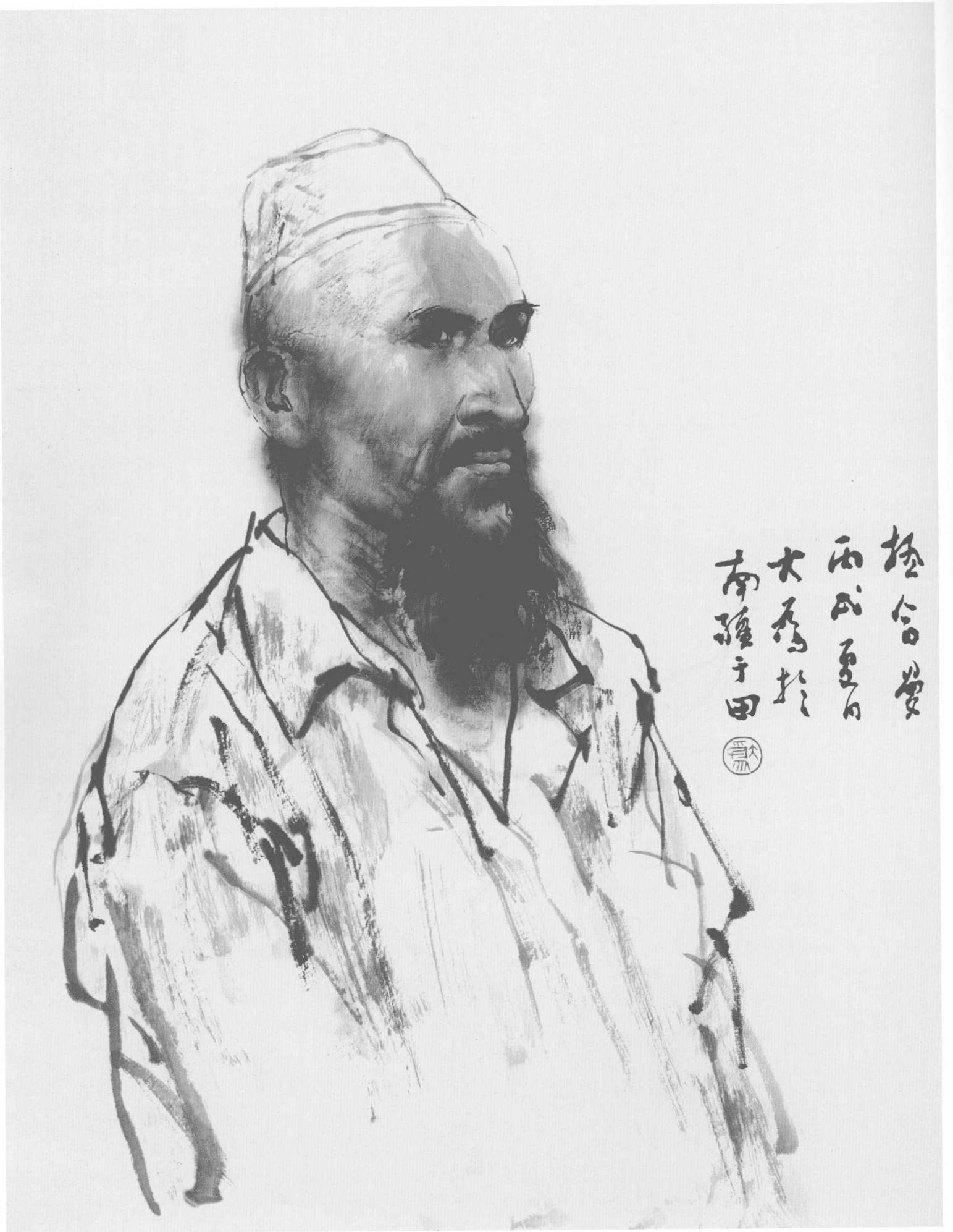
刘大为 水墨写生 90cm × 68cm 2006年