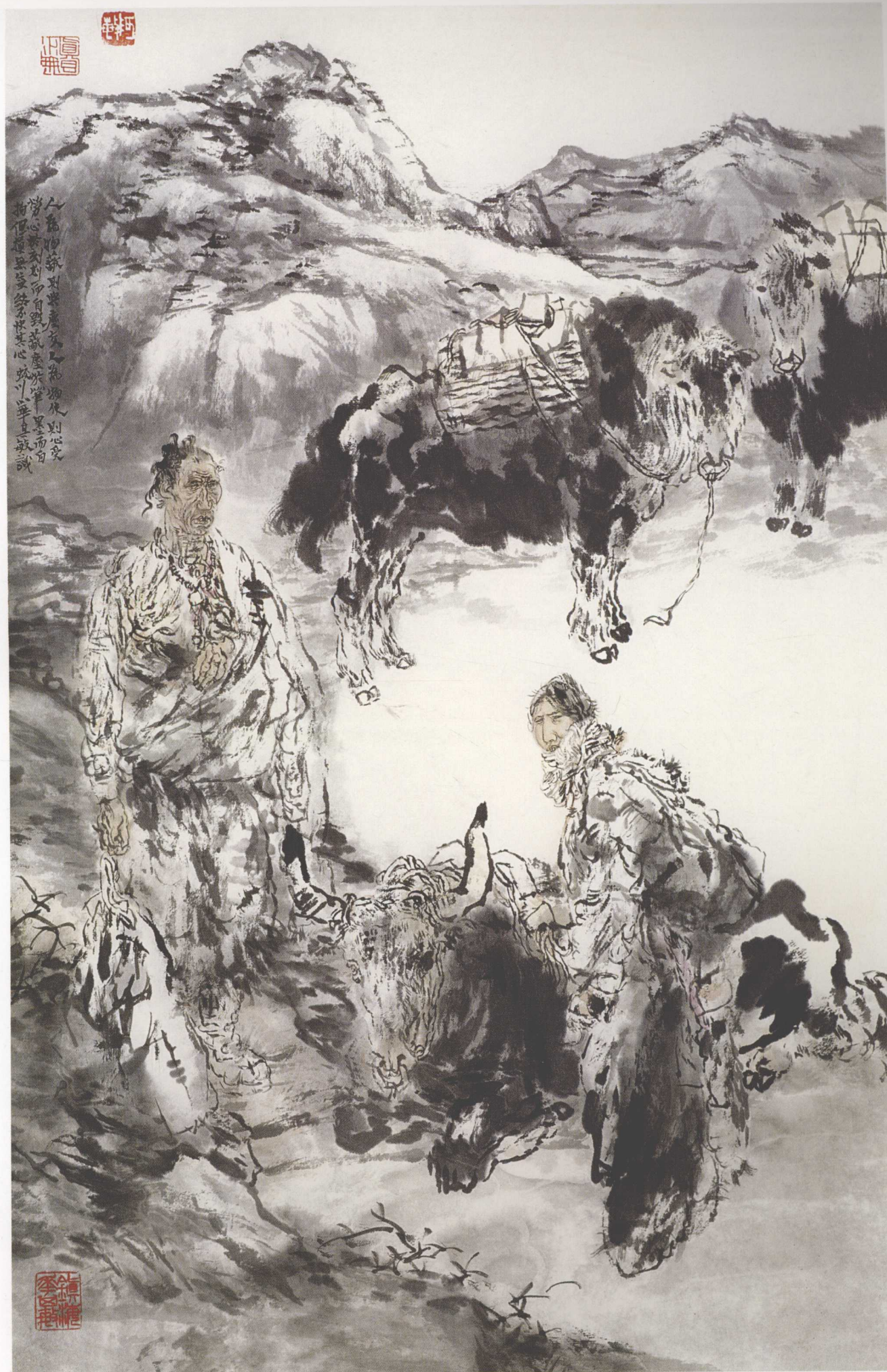
晨风 70cm x 45cm