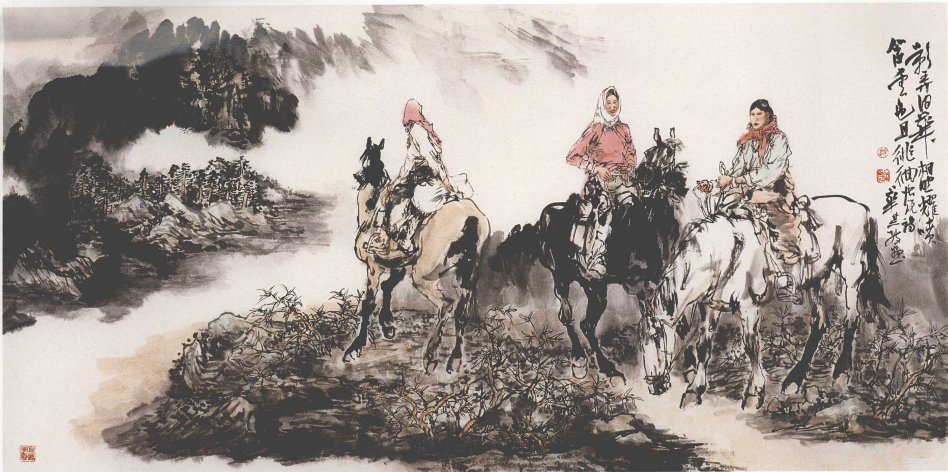
云色 136cm × 70cm