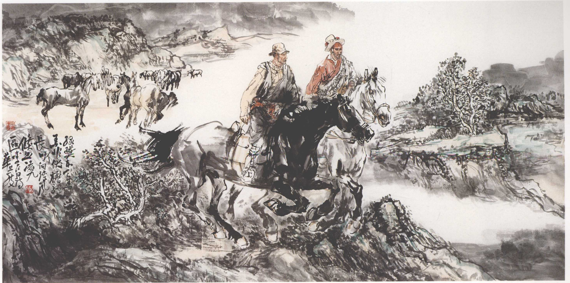
绿骥 150cm × 80cm