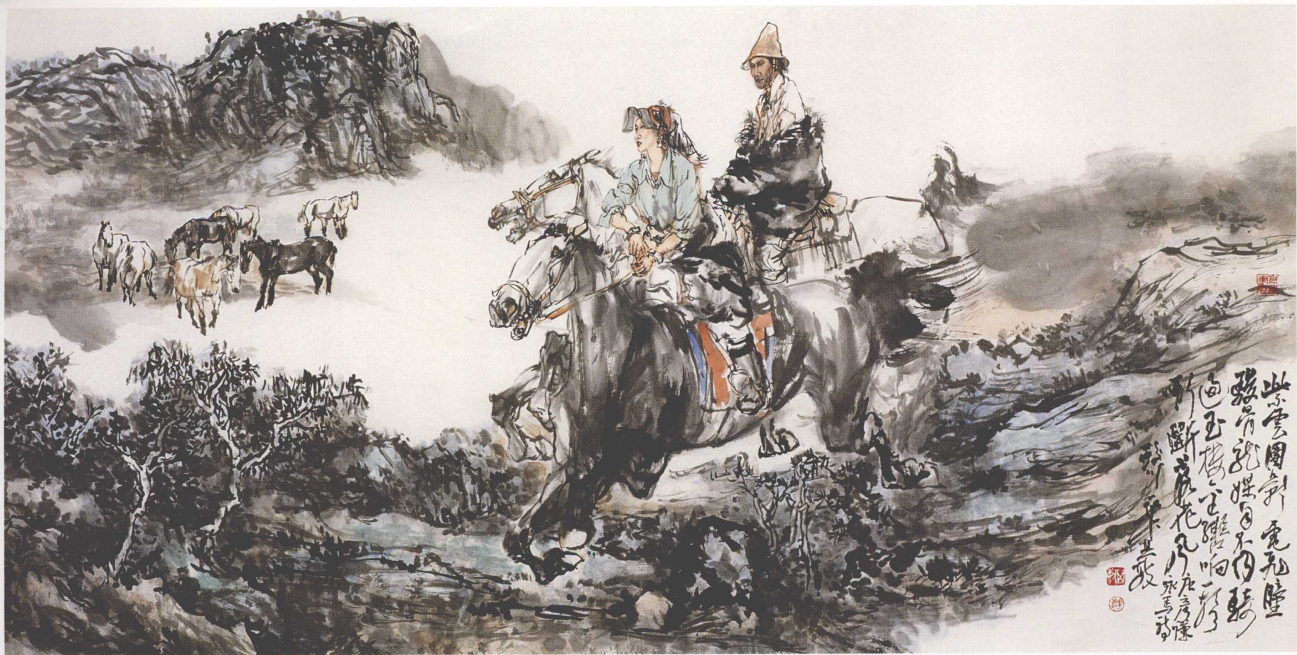
落花风 1360cm × 70cm