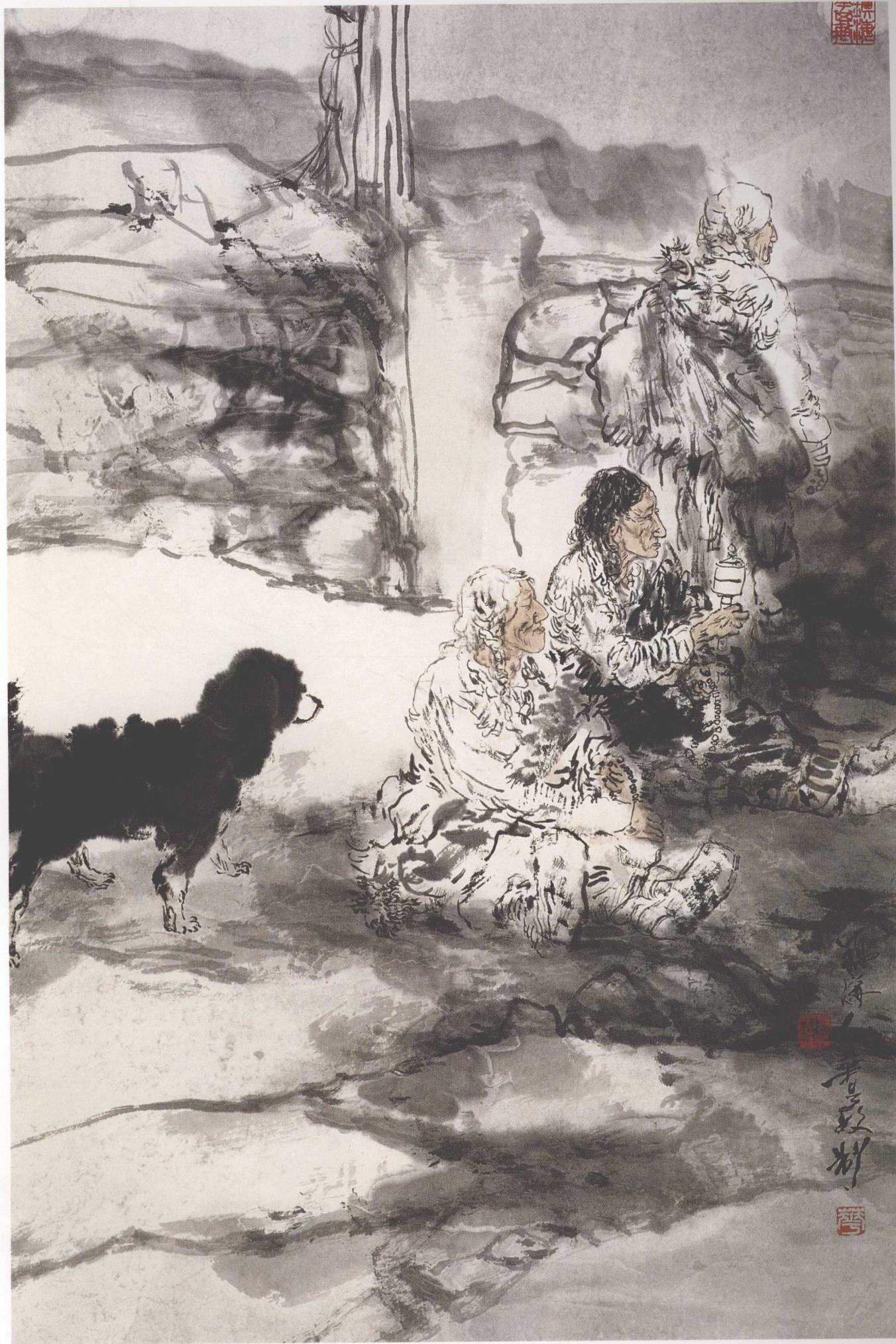
祈祷 70cm x 45cm