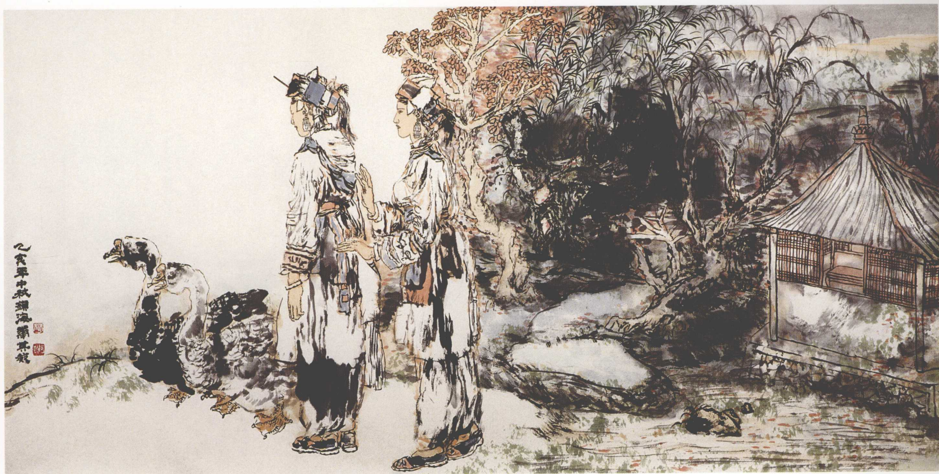
踏莎行 163cm × 70cm