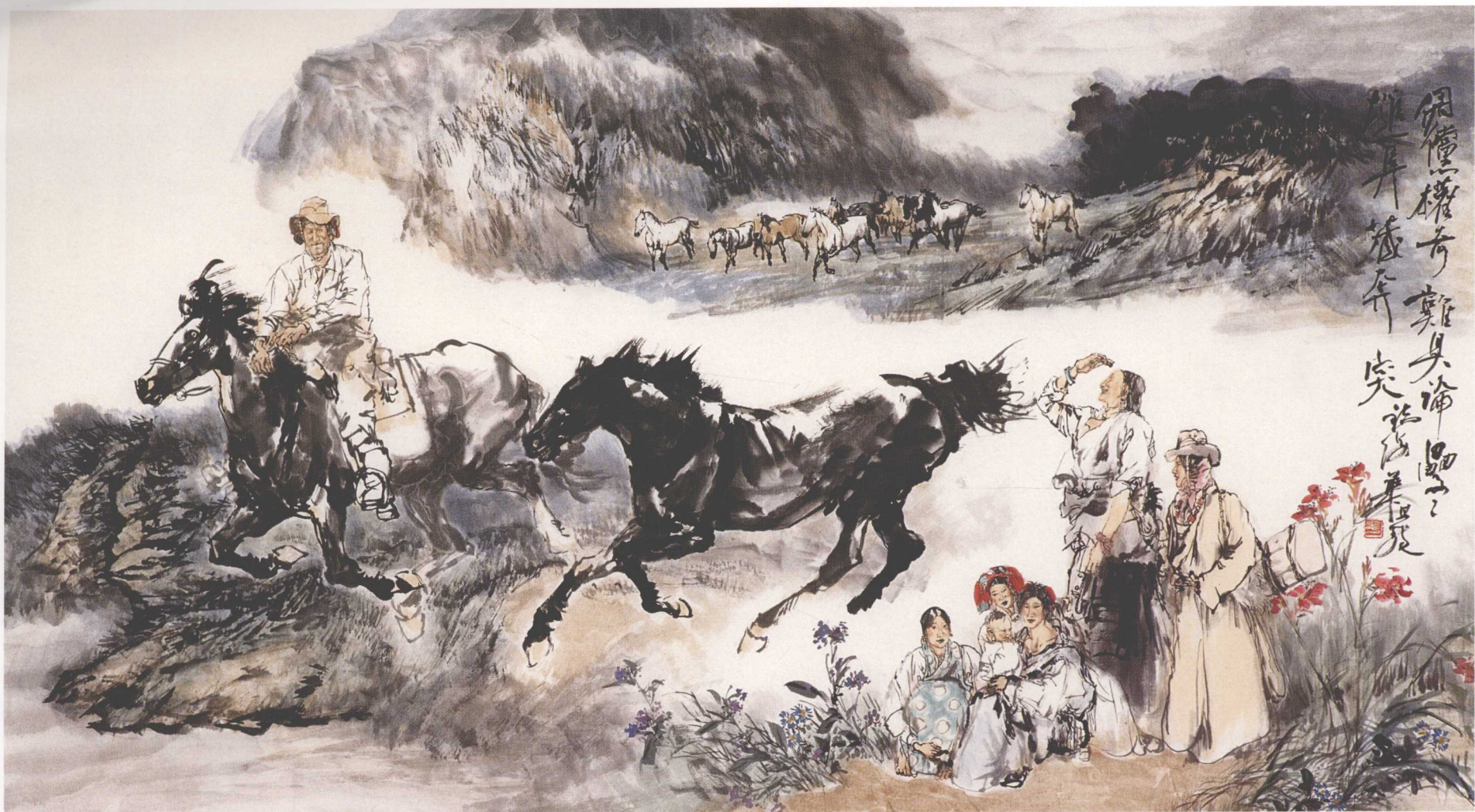
奔腾 150cm × 80cm