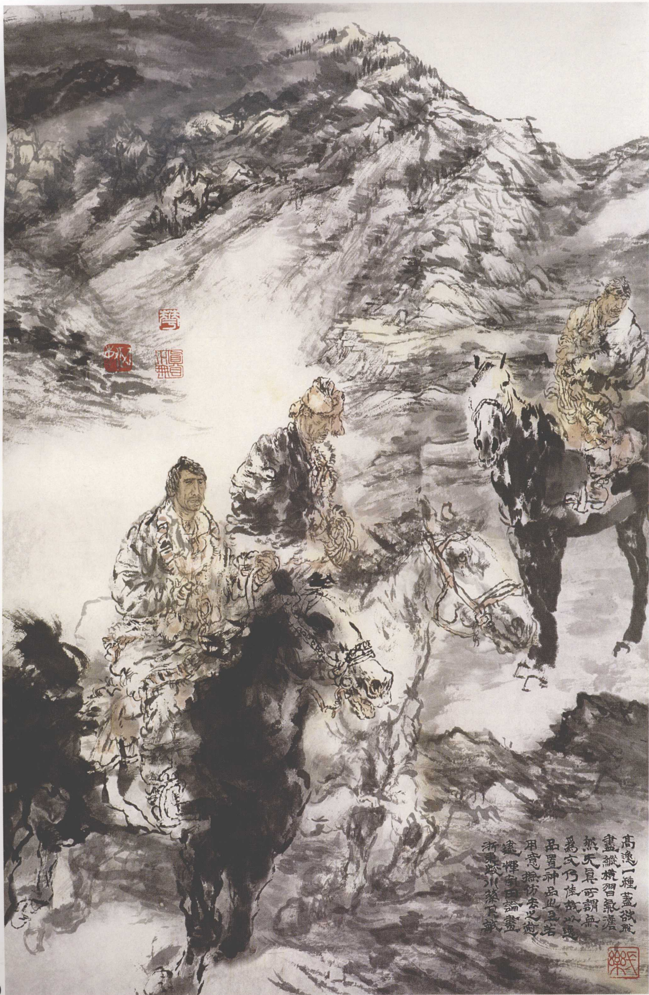
赛马 70cm x 45cm

高逸一種盡故脫 畫縱橫習氣澹 然天真可謂無 為文乃佳故以 品置神品也且若 用意撫仿去之 遂憚矣曰論畫 浙東吳川蔡其敏