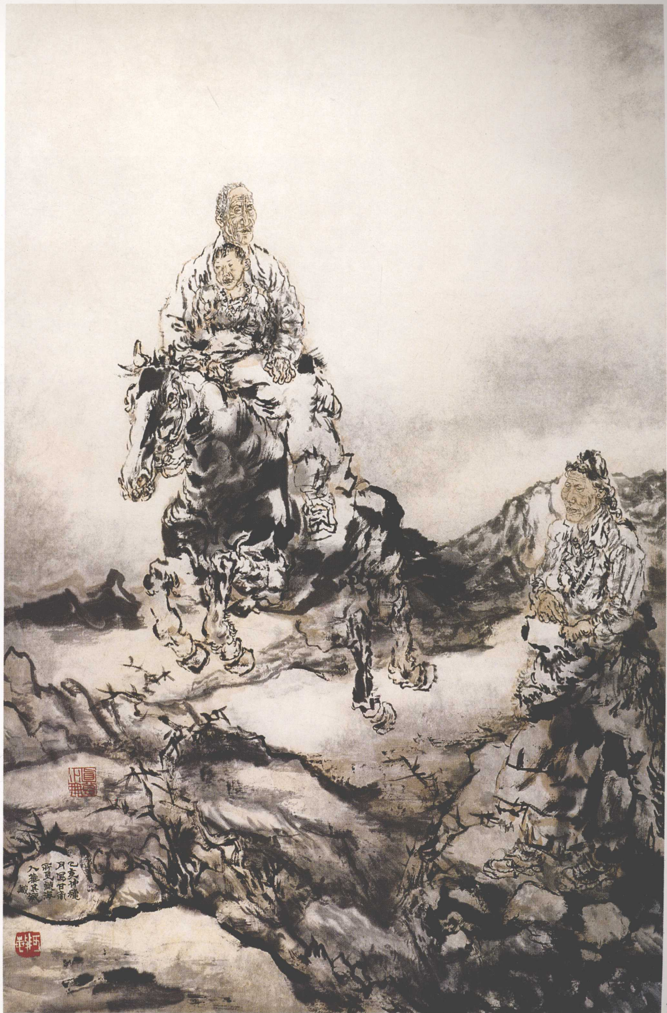
青鬃马 70cm x 45cm