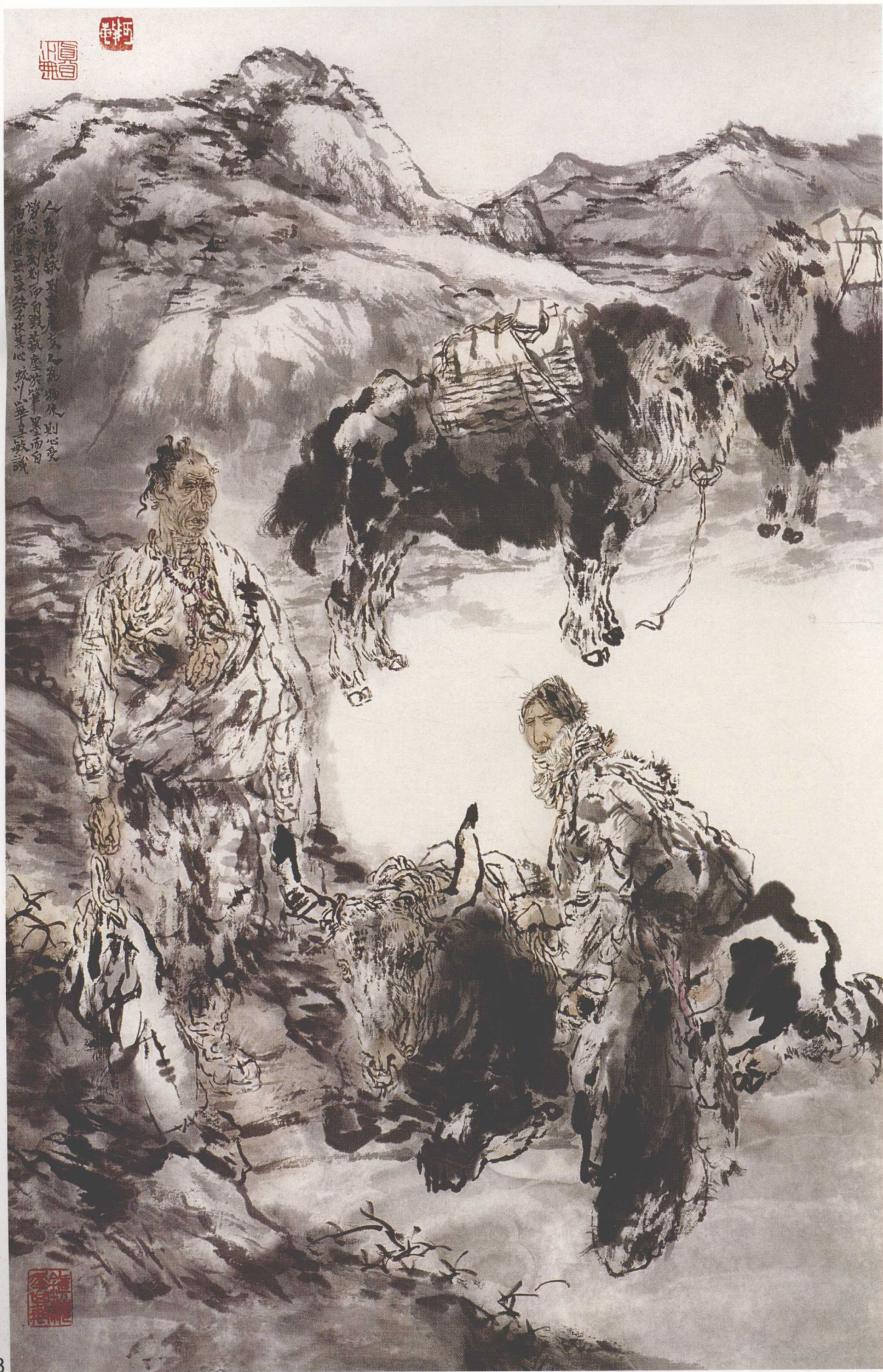
晨曦 70cm x 45cm