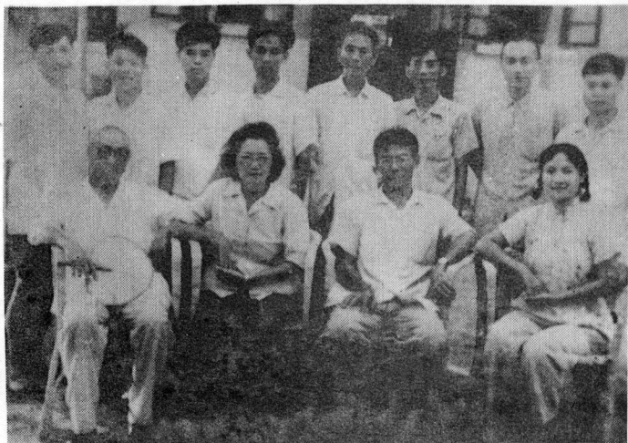
图十：1962年刘青云(前右二)陪著名戏剧家田汉及其夫人(前左一、二)在海南参观。图为在临高县接见宣传文化界负责人。