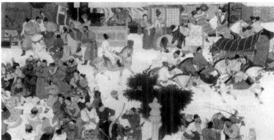
长安西市集中商贸区，波斯和大食商人云集于此，开店设肆，十分繁荣。