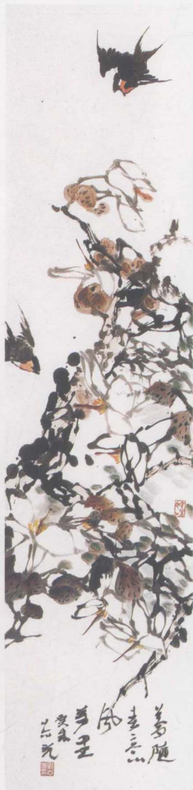
梦随春意风万里 136 × 34cm 郭志光 作