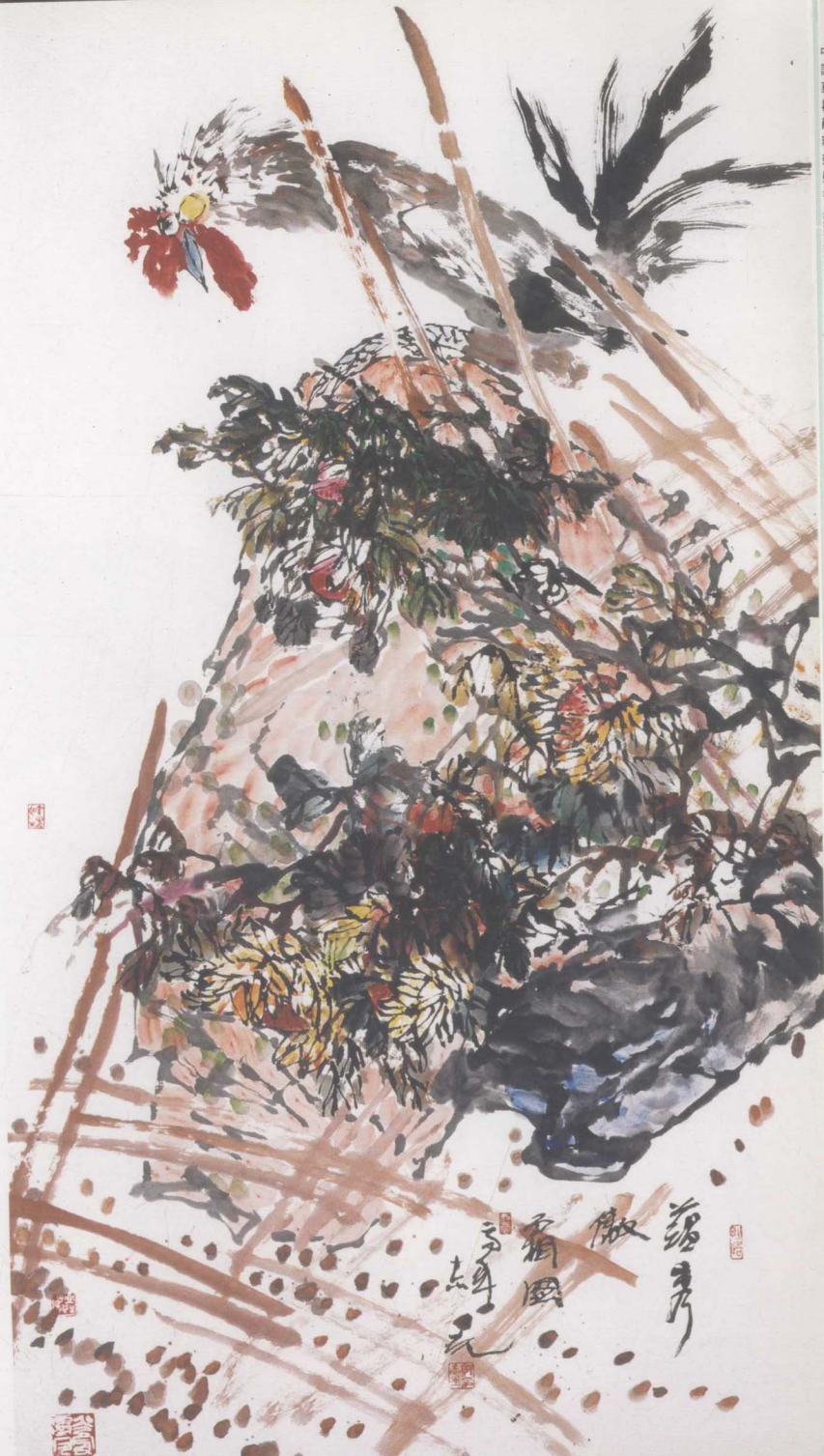
露秀傲霜 180 × 96cm 郭志光作