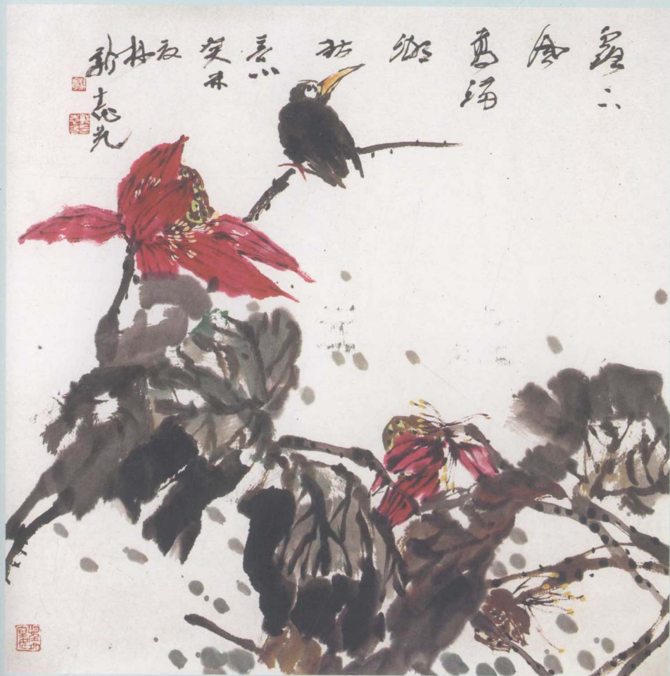
荷花图 68 × 68cm 郭志光 作