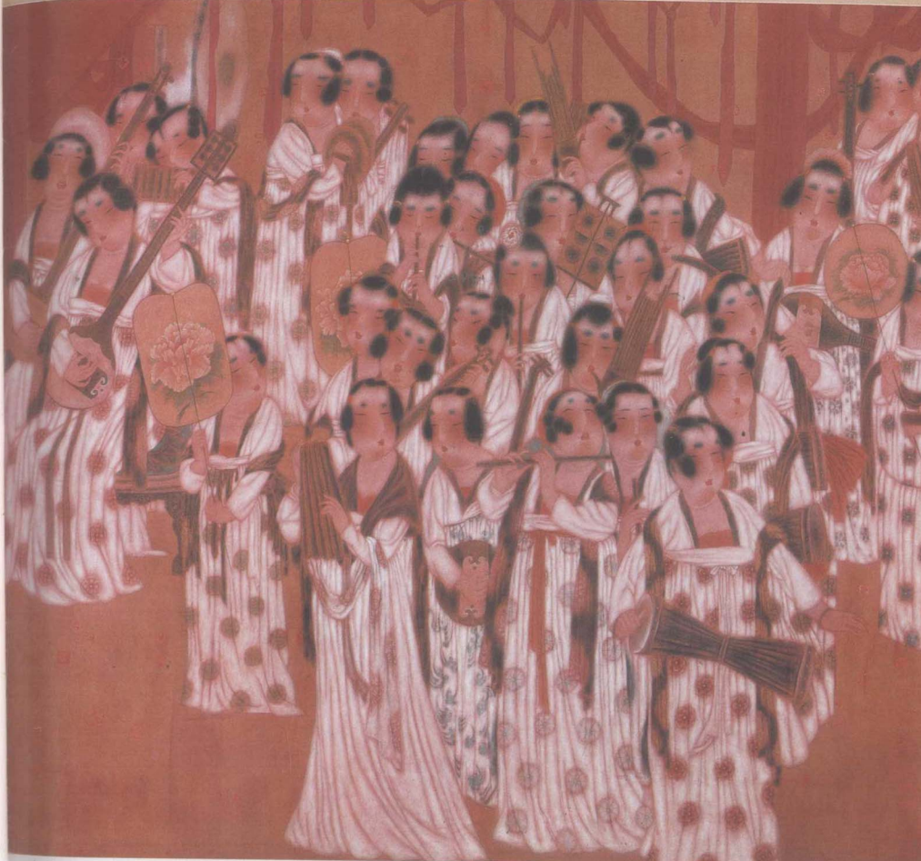
大唐遺韻圖 148 x 160cm 唐勇力 作