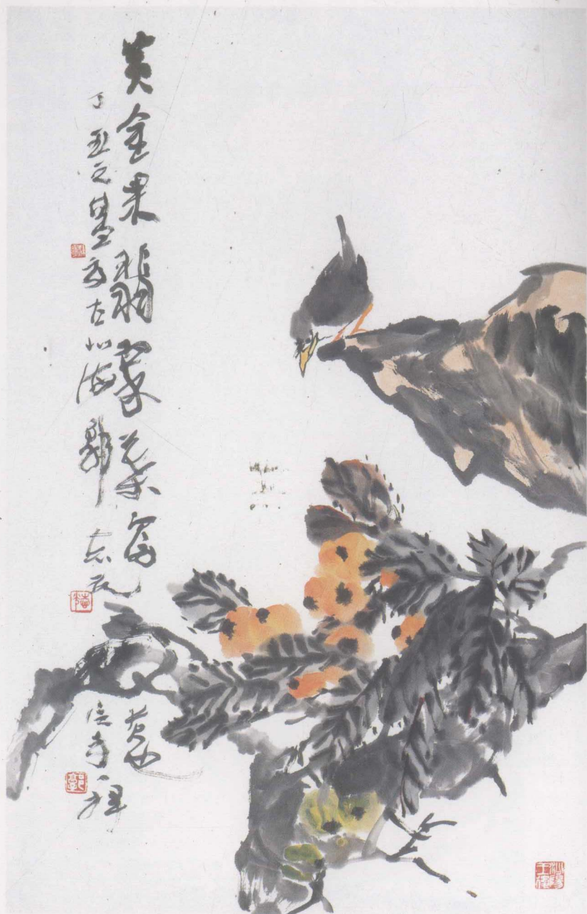
枇杷小鸟 98 × 60cm 郭志光 作