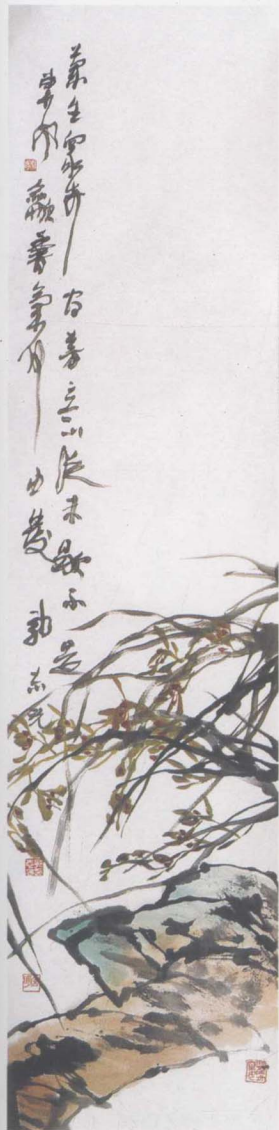
兰石图 136 × 34cm 郭志光 作

郭志光早年在浙江美院（今中国美院）学习，在花鸟画方面深得潘天寿学派之精髓，学成后回家乡任教于山东工艺美术学院。他的艺术风格，在笔墨、造型、构图等诸方面都对传统写意花鸟画在继承中有所突破和发展，体现了老、辣、奇、险的独特审美特征，使作品在视觉上产生强烈的冲击力，而在精神内涵中又透露出妩媚的韵致。郭志光是一个真正的写意花鸟画传统学派的学者。从这个意义上讲，与他同年龄段的其他画家很少能与他匹敌，所以他具备了成为花鸟画巨匠和大师的先决条件。他的传统笔墨功底和对传统花鸟画的深刻理解以及作品呈现出的气质是第一流的，而郭志光又是一位不事宣传、不求阔达、不喜张扬的画家。这就给他的艺术市场留下了相当大的升值空间，相信不要多久，全国更多的收藏家和投资家都会认识和注意郭志光。