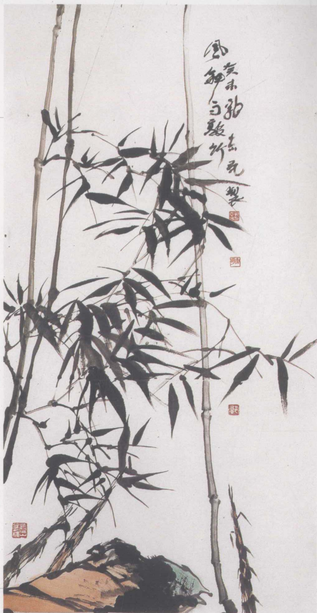
竹石图 130 × 68cm 郭志光 作