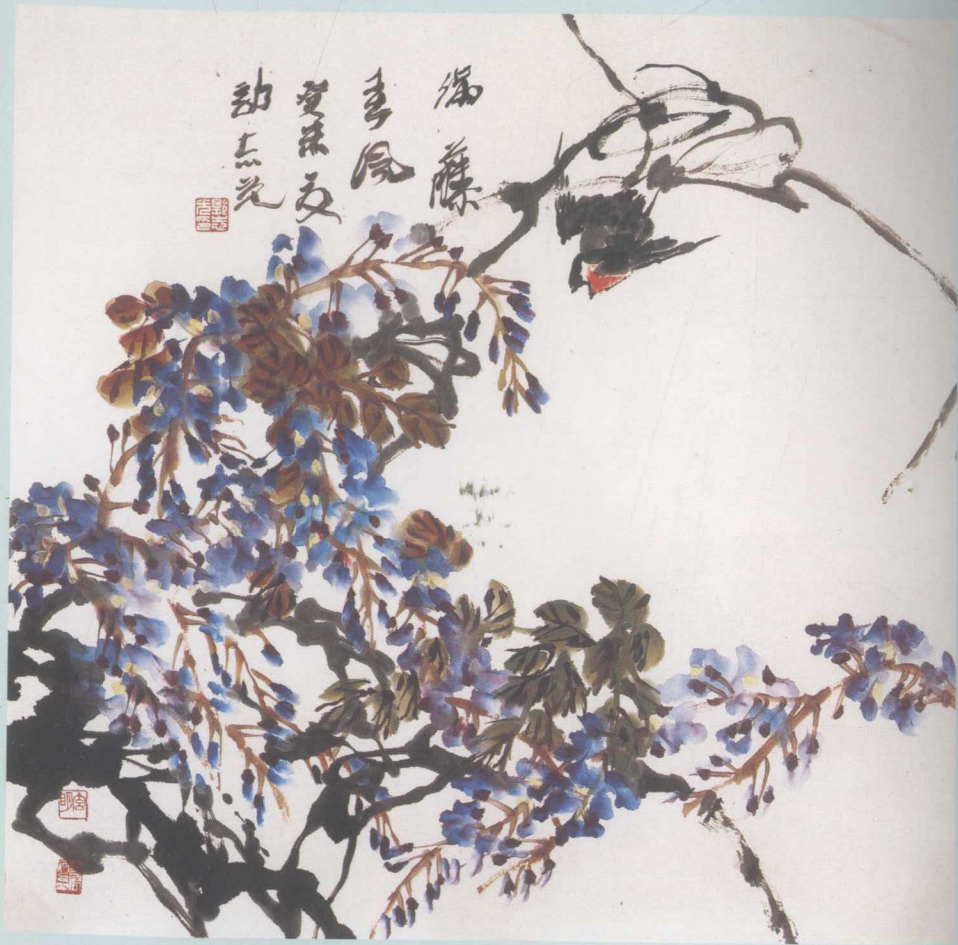
满藤春风 68 × 68cm 郭志光 作