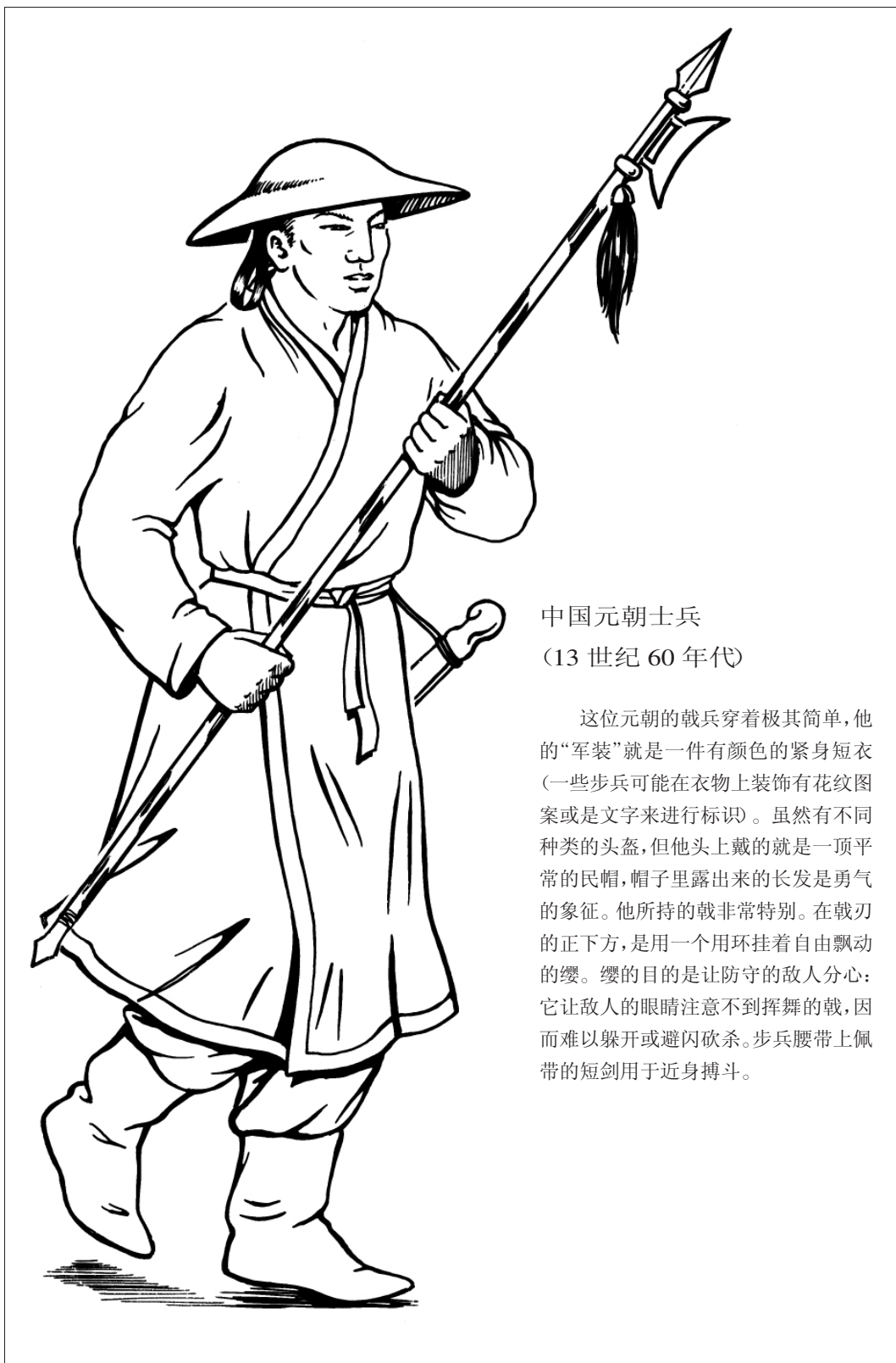
中国元朝士兵 (13世纪60年代)

这位元朝的戟兵穿着极其简单，他的“军装”就是一件有颜色的紧身短衣（一些步兵可能在衣物上装饰有花纹图案或是文字来进行标识）。虽然有不同种类的头盔，但他头上戴的就是一顶平常的民帽，帽子里露出来的长发是勇气的象征。他所持的戟非常特别。在戟刃的正下方，是用一个用环挂着自由飘动的缨。缨的目的是让防守的敌人分心：它让敌人的眼睛注意不到挥舞的戟，因而难以躲开或避闪砍杀。步兵腰带上佩带的短剑用于近身搏斗。