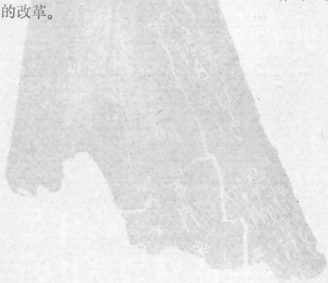
图三 甲骨文 商文 三图

元一八九九年在河南安阳殷墟遗址里被发见。甲骨文通行于商代，距今有三千多年。这种文字被刻在龟甲、兽骨上(图三)，是商代王朝占卜用的。所以我们管它叫甲骨文。又称“契文”、“卜辞”。已出土的甲骨文有十余万片，其中不重复的字约有四千五百个。考释出来的字近一千个。从甲骨文记载内容看，王室占卜祭祀频繁，祭祀祖先用牺牲(牛羊)甚多，刑法残酷。显而易见，在奴隶社会，文字被奴隶主把持而成为治人的工具了。从甲骨文的形体结构上看，笔画趋向线条式。这大概是下层百工之列持刀刻字的人，为方便而作的一次自发的改革。