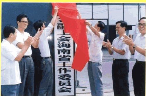
中国金融工会海南省工作委员会于1992年10月27日成立，举行揭牌仪式，省各家专业行、司行长、总经理前来庆贺