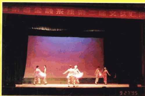
1995年9月27日在海口戏院举办“海南省金融系统第二届文艺汇演”

海南省工作委员会负责领导和指导海南省金融系统的工会工作。其下属有省人、工、农、中、建、交行和省保险公司、省国际信托投资公司6行2司等8个系统工会，是一个省级的大产业工会。中国金融工会海南省工作委员会在中国人民银行海南省分行党组的领导下，在上级工会的指导下，按照新《工会法》所赋予的“维护、建设、参与、教育”4项职能，独立自主地开展工作，组织全省金融系统各级工会联系并教育职工，不断提高职工队伍的政治和业务素质；团结、教育和组织职工积极完成各个时期的各项金融工作任务，促进金融系统全面深化改革，提高经济效益，从而促进我省经济建设；积极参与国家和社会事务的管理，参与企业的民主管理；把发展金融事业和维护职工利益结合起来，逐步改善职工的物质生活和文化生活，为继续加强海南省金融系统的物质与精神文明两个文明建设而努力奋斗。