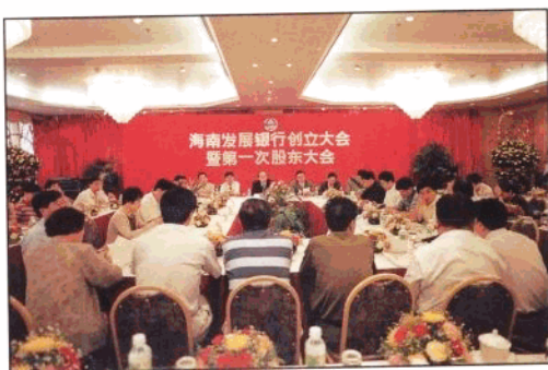
1995年8月18日,海南自1949年中华人民共和国成立后的第一家地方性股份制商业银行——海南发展银行成立。图为海发行成立大会会场。