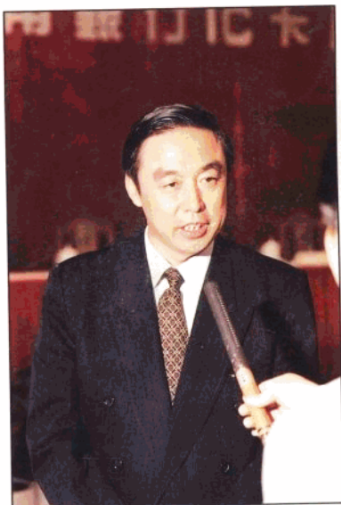
我国第一张跨行发行的银行信用卡于1995年1月8日在海南发行。人行海南省分行行长马蔚华在发行仪式上接受记者采访。