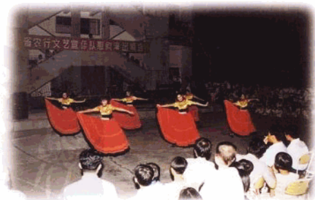
省行为丰富基层文化生活,组织文艺宣传队在全省各地进行慰问演出