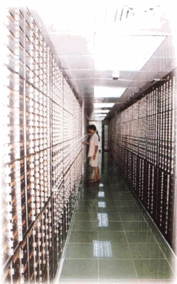
大力开展中介金融业务,图为保管箱业务室一角