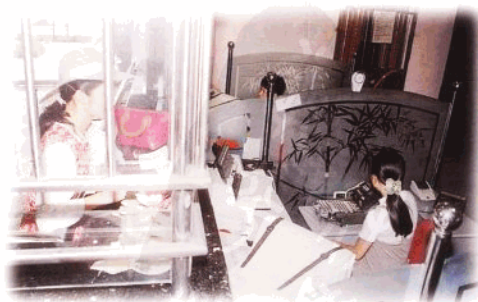
储蓄业务实行柜员制