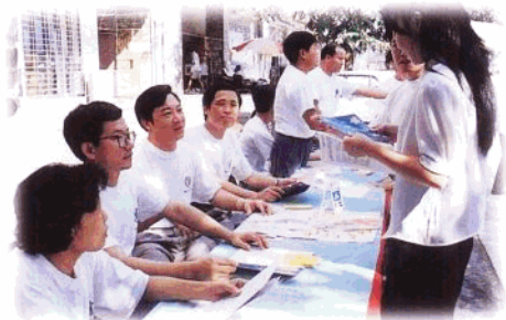
三亚分行领导上街宣传新业务