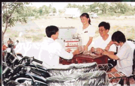
琼海支行员工上门为储户服务