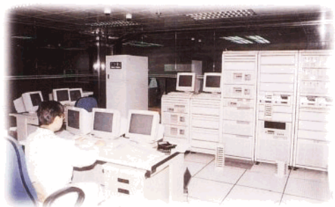
全省建行实行计算机联网,图为 A18 大型计算机主机