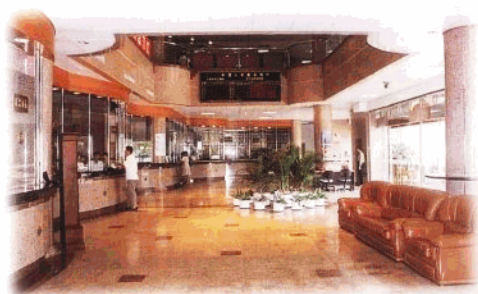
省建行营业部营业大厅