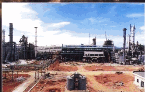
贷款支持的八所海南天然气化肥厂