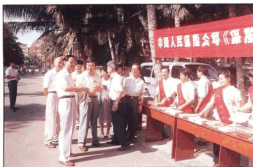
1995年6月30日《保险法》颁布后,人保公司干部职工上街宣传保险法。图为省委常委王厚宏在省人行行长马蔚华等陪同下参加保险法宣传活动。