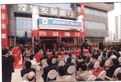
1995年12月22日深圳发展银行海口分行开业。