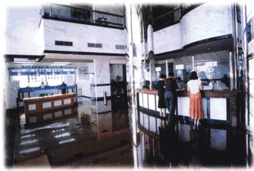
海口分行营业部大厅