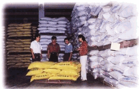
省行营业部支持的海南饲料工业