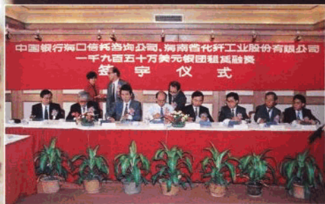
1950 万美元银团租赁融资签字仪式