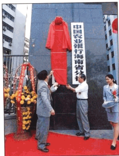
1995年1月23日海南第一家政策性银行——中国农业发展银行海南省分行成立。图为海南省副省长陈苏厚为农业发展银行揭牌。