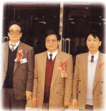
省建行领导班子成员

中国建设银行海南省分行成立于 1988 年,是以中长期信贷业务为主,兼办其他商业银行业务,既经办人民币业务又经办外汇业务的国有商业银行。目前全行员工 3515 人,其中具有中高级职称 525 人。1995 年末一般性存款余额 89.3 亿元,各项贷款余额 78.46 亿元。几年来,该行依托海南大特区的开发建设,积极开拓业务,服务建设,为特区的建设发展做出了应有的贡献。先后发放巨额人民币,外汇贷款重点支持了大广坝水库、三亚凤凰国际机场、海口美兰国际机场、昌江水泥厂、新大洲摩托车厂、海南汽车制造厂等重点项目的建设。