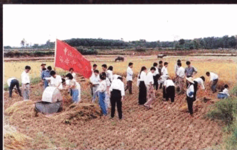
别开生面的海府中心办党日活动