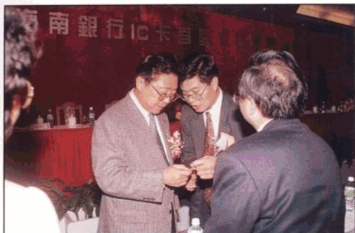
1996年1月8日,我国第一张在全省范围内跨行使用的银行IC卡在海南正式发行。图为海南省省长阮崇武听取省人行副行长张光华介绍银行IC卡的使用方法。