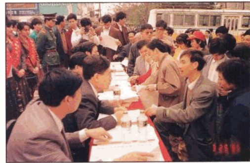
1995年3月18日,《中国人民银行法》颁布实施。海南省人行领导及干部职工上街宣传《人行法》。图为广大群众踊跃咨询《人行法》。