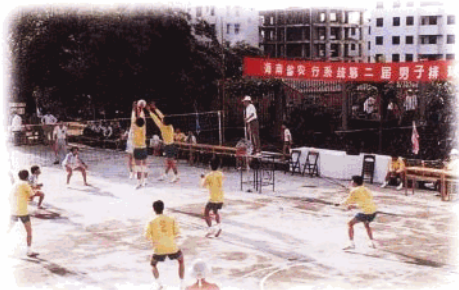
举办全省农行系统第二届男子排球赛