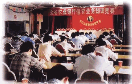
为适应市场竞争的需要,注重职工业务素质 的提高。图为省行举行全省农行信贷业务知 识竞赛。

中国农业银行海南省分行本着“服务第一、顾客至上”的宗旨和开拓、廉洁、高效的精神,竭诚为国内外客商提供周到、便捷、高效、可靠的配套服务。