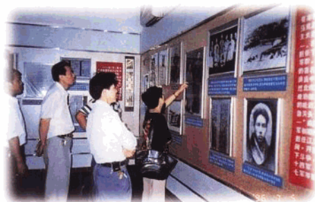
省行注重精神文明建设。图为省行组织干部 参观李硕勋烈士事迹展览,进行革命传统教育。