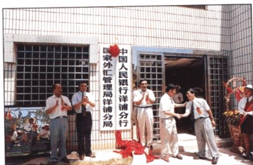
我国第一家境内关外的人民银行分行——中国人民银行洋浦分行于1995年7月17日正式挂牌。