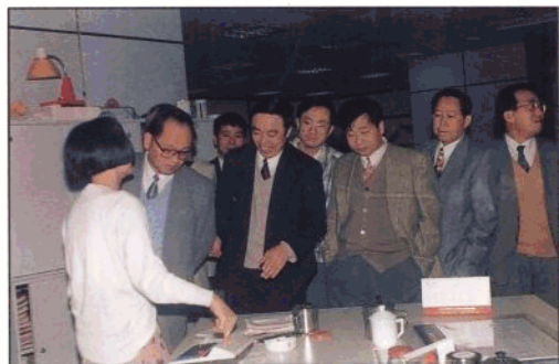
1996年春节,海南省常务副省长汪啸风在省人行马蔚华行长、喻柏议副行长、省农发行行长林鸿英陪同下慰问节日期间坚守岗位工作岗位的职工。