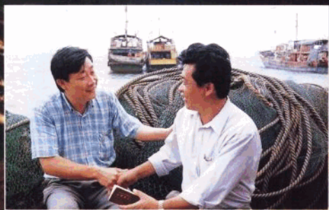
文昌支行清澜分理处领导上门为储户服务