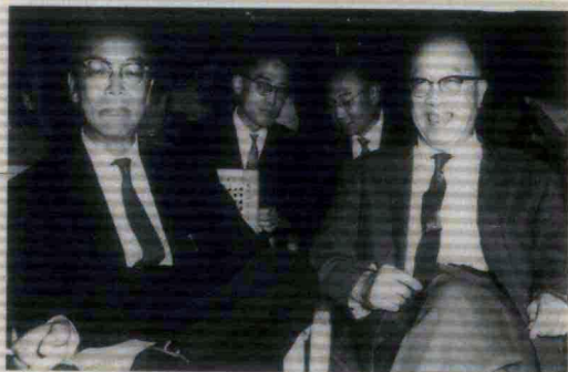
1964年4月23日参加纪念莎士比亚诞生400周年大会， 与友人在耕莘文教院。