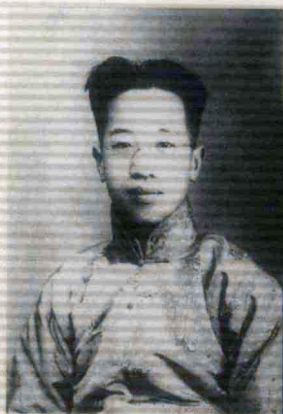
清华时期的梁实秋