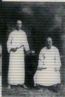
梁实秋与父亲梁咸熙