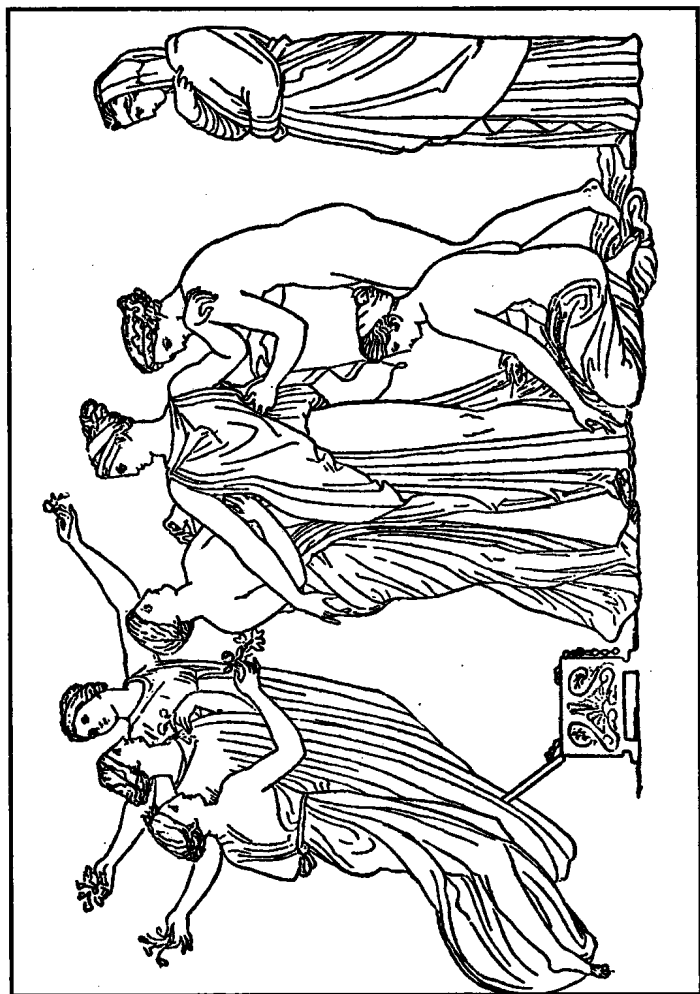
2. 潘多拉被美惠三女神与时光女神所装饰。