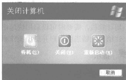
图 1-3 【关闭计算机】对话框