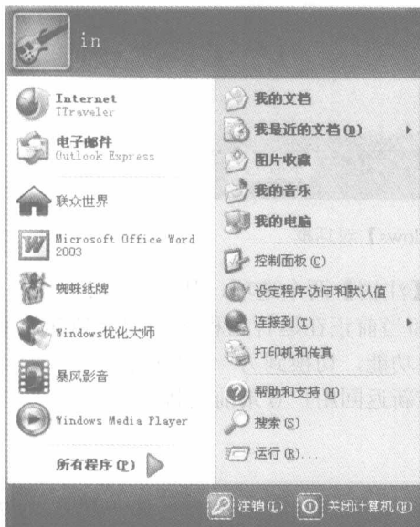
图 1-2 【开始】菜单选项

(2) 在出现的如图 1-3 所示的【关闭计算机】对话框中选择一种关闭方式，例如，单击【关闭】按钮后，退出 Windows XP 系统，就可以关闭计算机的主机和显示器的电源。