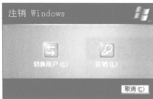
图 1-4 【注销 Windows】对话框

如果用户只想注销当前用户, 不想关闭计算机, 可以单击如图 1-2 所示的【注销】按钮, 打开【注销 Windows】对话框, 如图 1-4 所示。