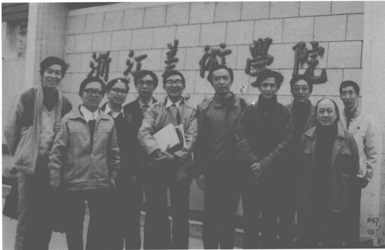
校庆七十周年油画系老同学留影