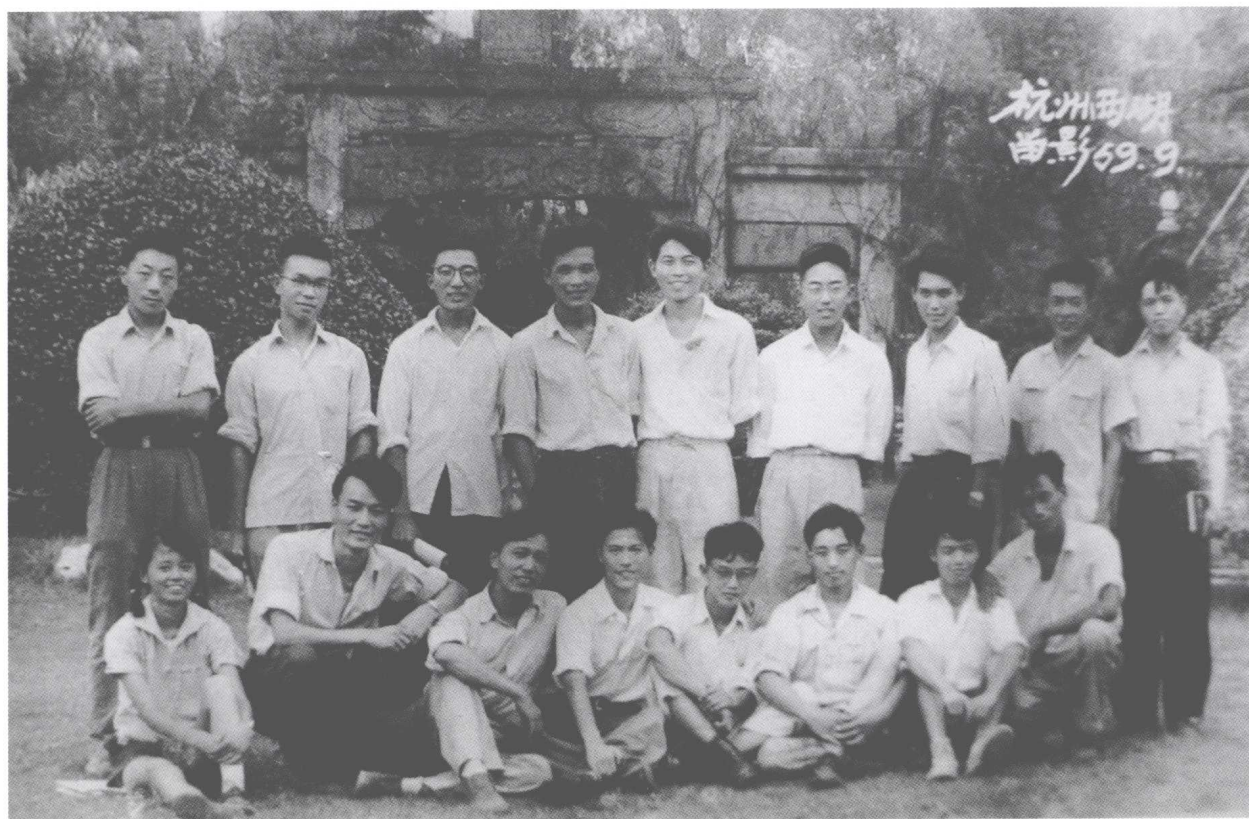
正当年青时（全班合影）