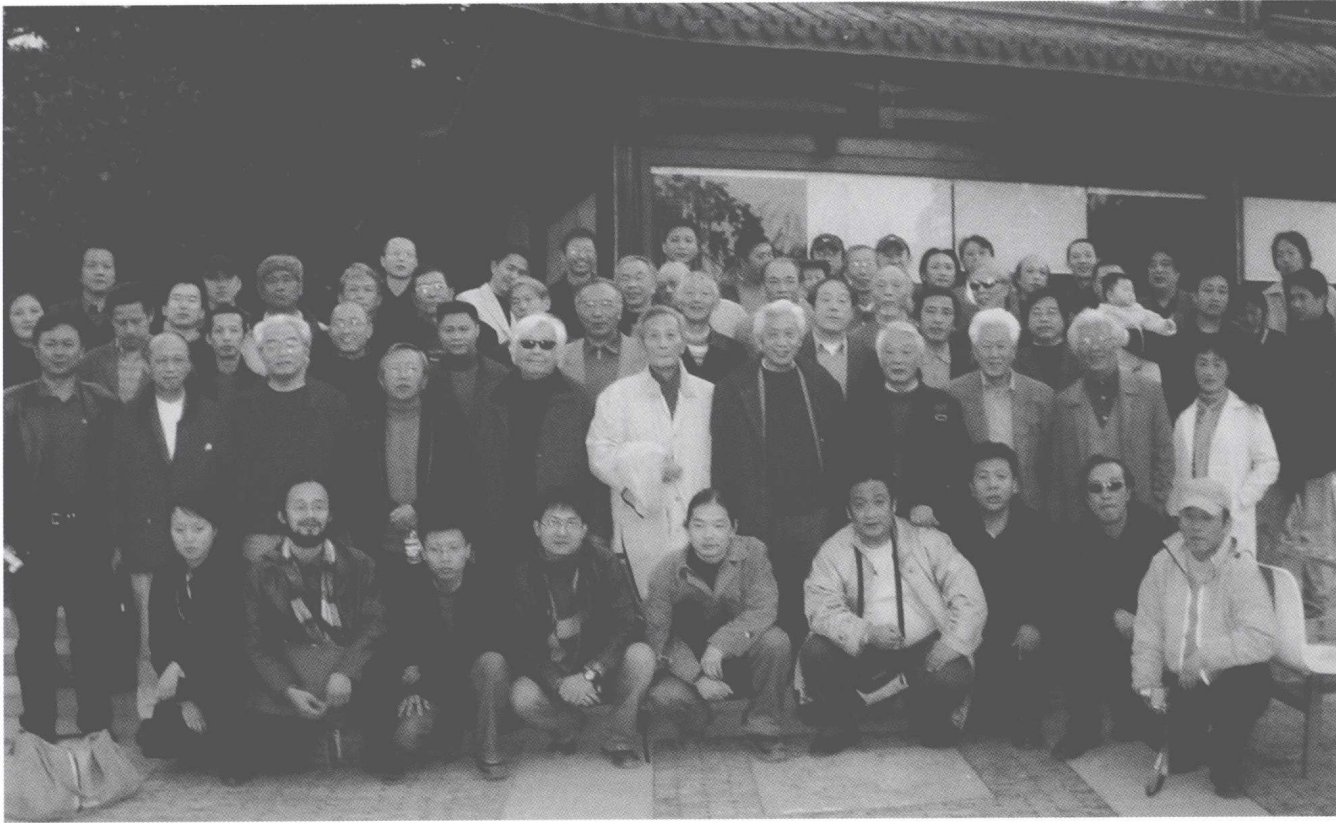
校庆七十五周年油画系师生合影