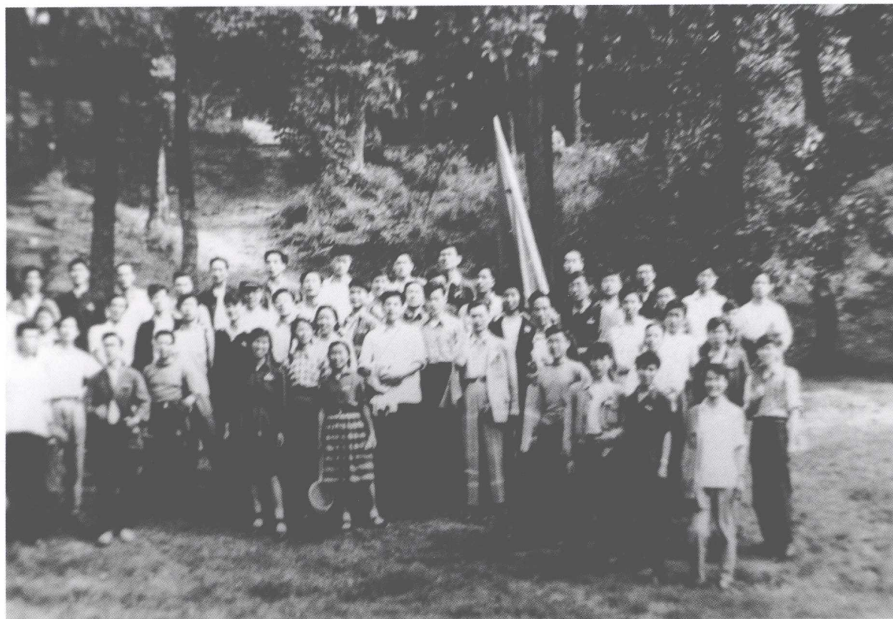
当年油画系团活动在孤山