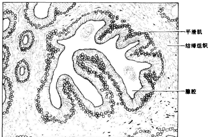
图 3 前列腺的内部结构

腺泡上皮的基础。前列腺腺体组织中管泡状的腺泡腔较大，中央是贮藏由腺泡上皮所分泌的液体的场所。这样的管泡状腺体组织总数可达到 30~50 个，它们总共汇集成 15~30 条排泄管，或者又称为前列腺导管，开口在前述的尿道精阜两边。除此之外，在前列腺腺体组织周围或间隔之中，还长着不少肌肉和纤维组织，仿佛簇拥与支撑着腺体，起着支持与保护的作用。位于前列腺周围最外边的纤维结缔组织，组成了一层前列腺包膜，使前列腺与周围脏器分开(图 3)。