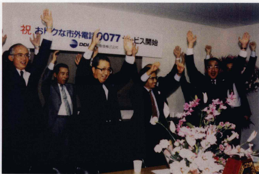
1984年6月 京瓷公司设立第二电电 株式会社正式涉足通信业务