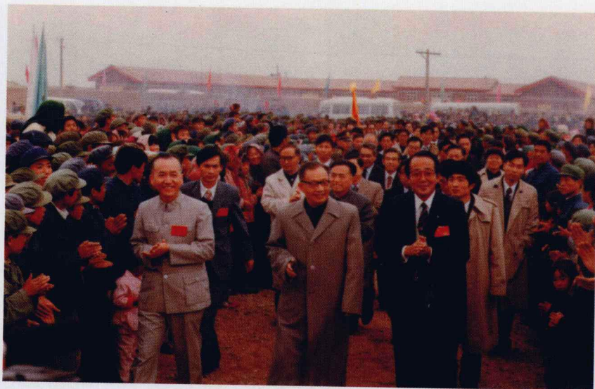
京瓷公司一行受到兰州郊区村民的热烈欢迎