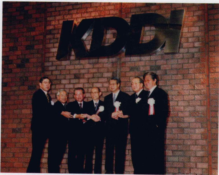
2000年10月 第二电电公司和KDD株式会社合并后成立KDDI