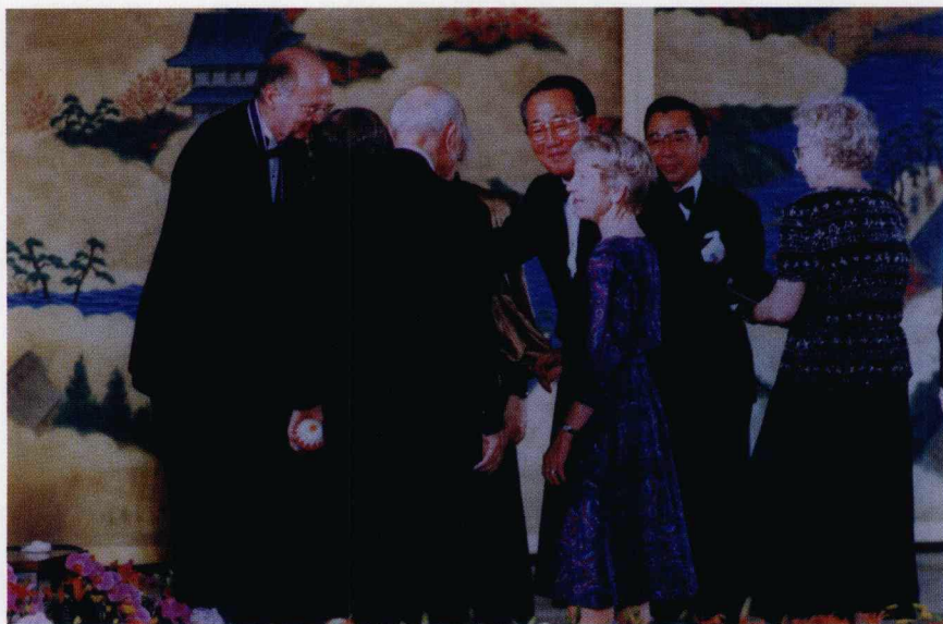
1984年 作者出资设立“京都奖”图为颁奖仪式现场