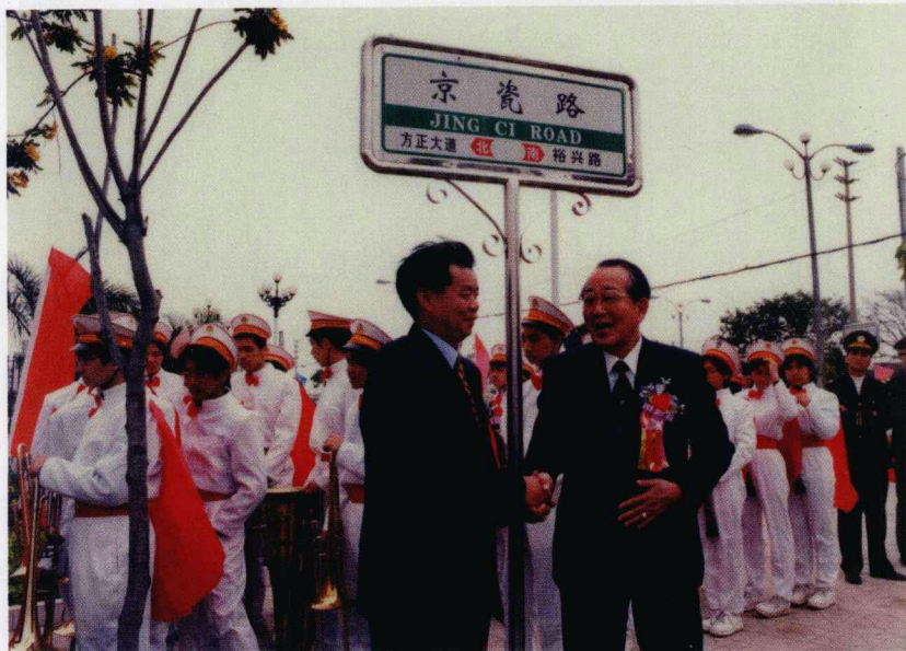
作者出席“京瓷路竣工仪式”