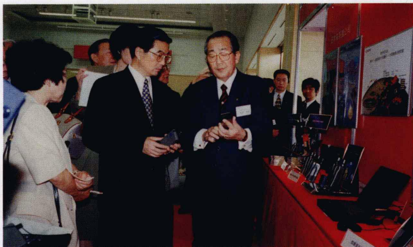
1998年4月 当时的国家副主席胡锦涛同志视察京瓷总公司