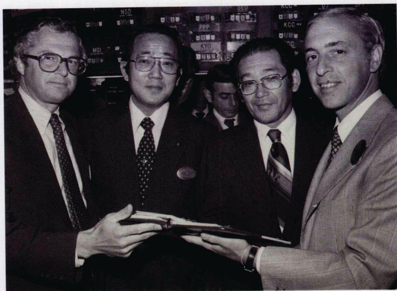
1976年2月 京瓷公司在美国发行ADR《美国信托证券》