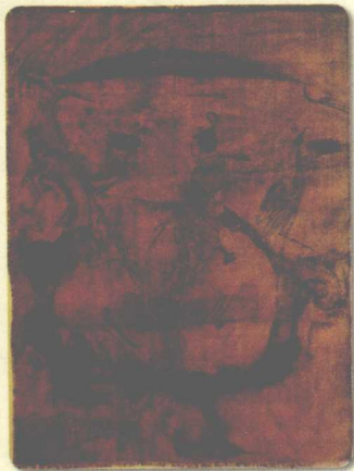
人物御龙图 战国时期的深衣

在春秋战国之前，我国古人不论男尊女卑，他们的服饰都分为上下两截，穿在上身的叫“衣”，穿在下身的叫“裳”。衣裳分穿不仅麻烦，而且，由于那时的裤没有裤裆，只能套在两腿之上，而裳又是由前后两片布片形成，稍有不慎就有暴露下体之虞。因此，当上衣下裳连缀，又加缀衣襟蔽体的深衣在春秋战国时期出现的时候，就得到了社会各界人士的欢迎，并从此传袭了几千年。深衣虽是衣裳连缀的，但在制作的过程中却是衣裳分裁的，然后将裁剪好的衣裳再缝缀成一整体，在腰部的右侧用绳带系结，穿着的时候还要在腰部加系一条腰带。