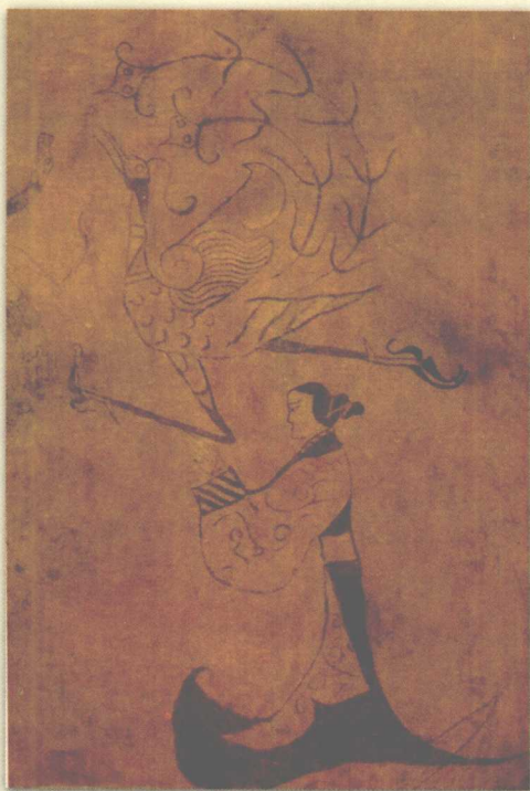
人物龙凤图 战国时期的深衣

在从汉代到民国这个漫长的时期中，深衣也经历了多次的变化。首先是在裤有了裤裆之后，不存在暴露下体的危险了，就出现了直裾深衣。直裾深衣就是在曲裾深衣的基础上，省去了裳的右侧增加的那块衣襟，衣裾在身侧或侧后方垂直而下，不必绕腰身几周，这样既节省布料，穿着起来又更加轻便。后来，在直裾深衣的基础上又发展出了一种直裾的短深衣——襜褕，这种短深衣只用作平时的便服。再后来，襜褕和原本用作内衣的袍被融合成一体，统称为“袍”。深衣发展成袍以后，变化就不大了，各朝的官吏都采用袍制，寻常百姓也可以穿袍，只是在材质和工艺上有所区别。