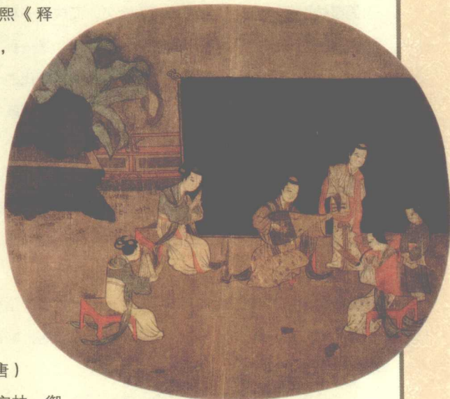
按乐图 古代披帔帛的乐伎

根据宋人陈元靓的《事林广记后集》记载，帔帛起源于秦代。刘熙《释名·释衣服》：“帔，披也，披之肩背不及下也。”因此，帔帛也称为披帛。因其“围巾护项，偏压垂之”（《旧唐书·舆服志》），六朝时又被称为“斜领”。唐朝是帔帛最为流行的时代，甚至女子帔帛成了皇家制度。五代马缟《中华古今注》载：“女人帔帛，古无其制。（唐）开元中，诏令二十七世妇及宝林、御女、良人等，寻常宴参侍令披画帛，至今然已。”由于帔帛质地轻盈，常在上面施以彩绘和手绣的方法点缀上图案花纹，色彩