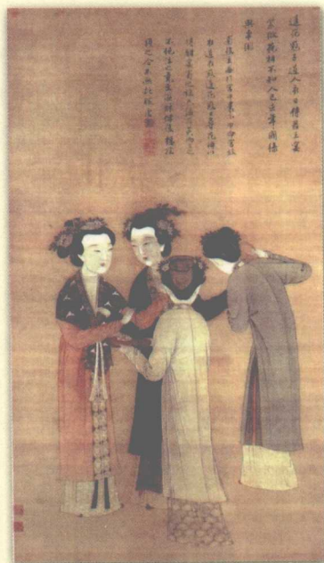
孟蜀宫妓图轴 (明·唐寅)

到了五代和宋辽金时期，帔帛发生了分化，出现了霞帔和直帔两种形式。据《事物纪原》载：“今代帔有二等：霞帔，非恩施