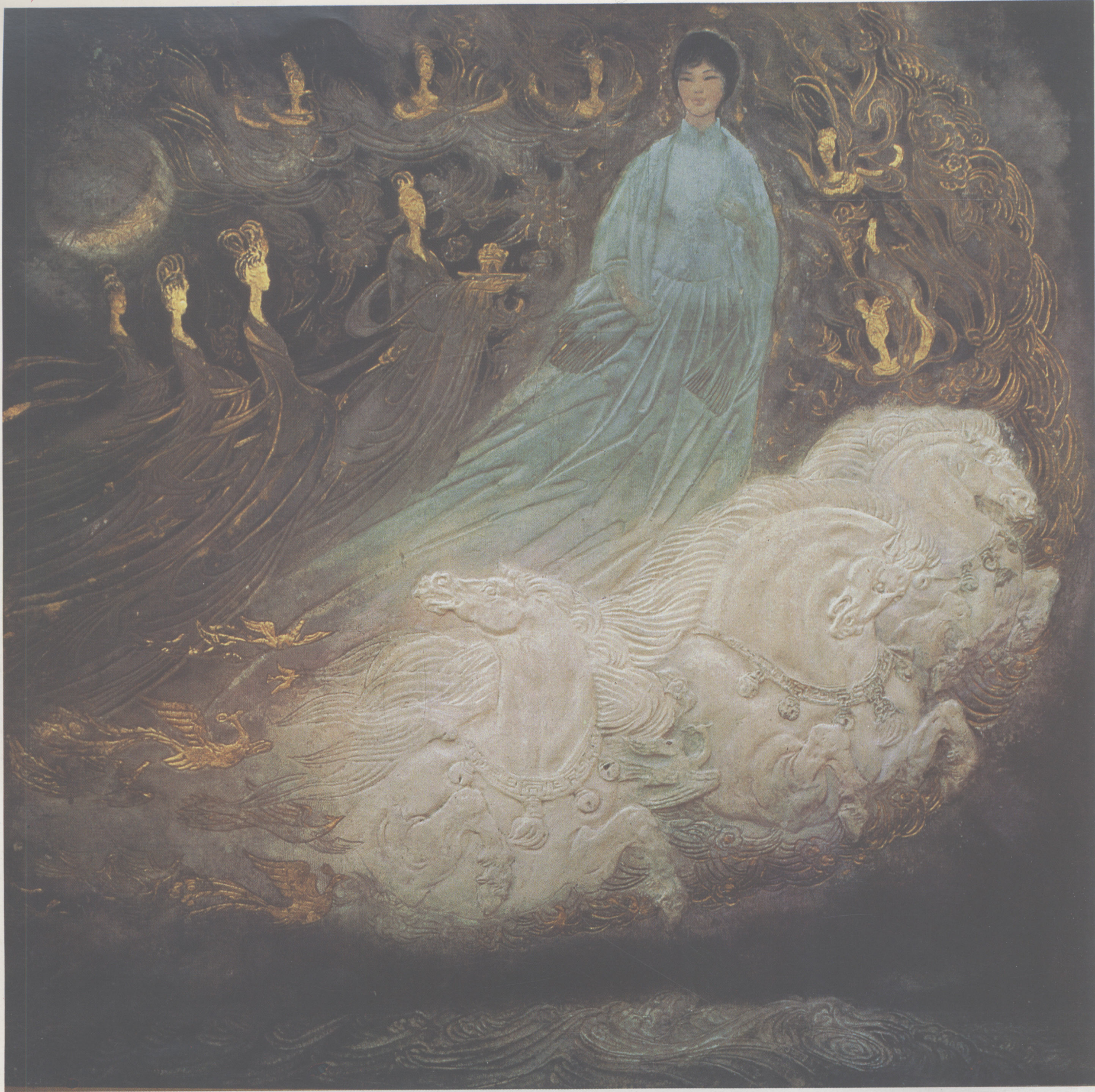
王熙民 蝶恋花 200 cm × 200 cm 彩色浮雕 1981