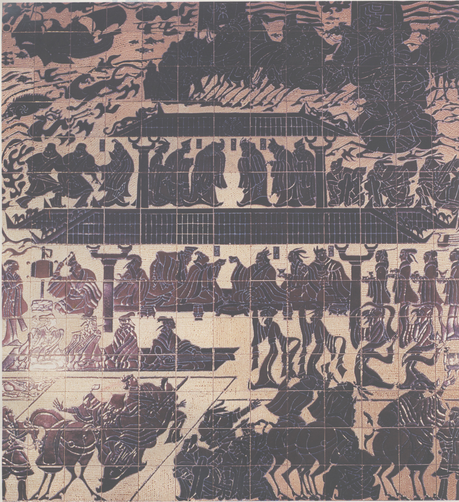
孙景波 孙权筑城 360 cm × 330 cm 陶板