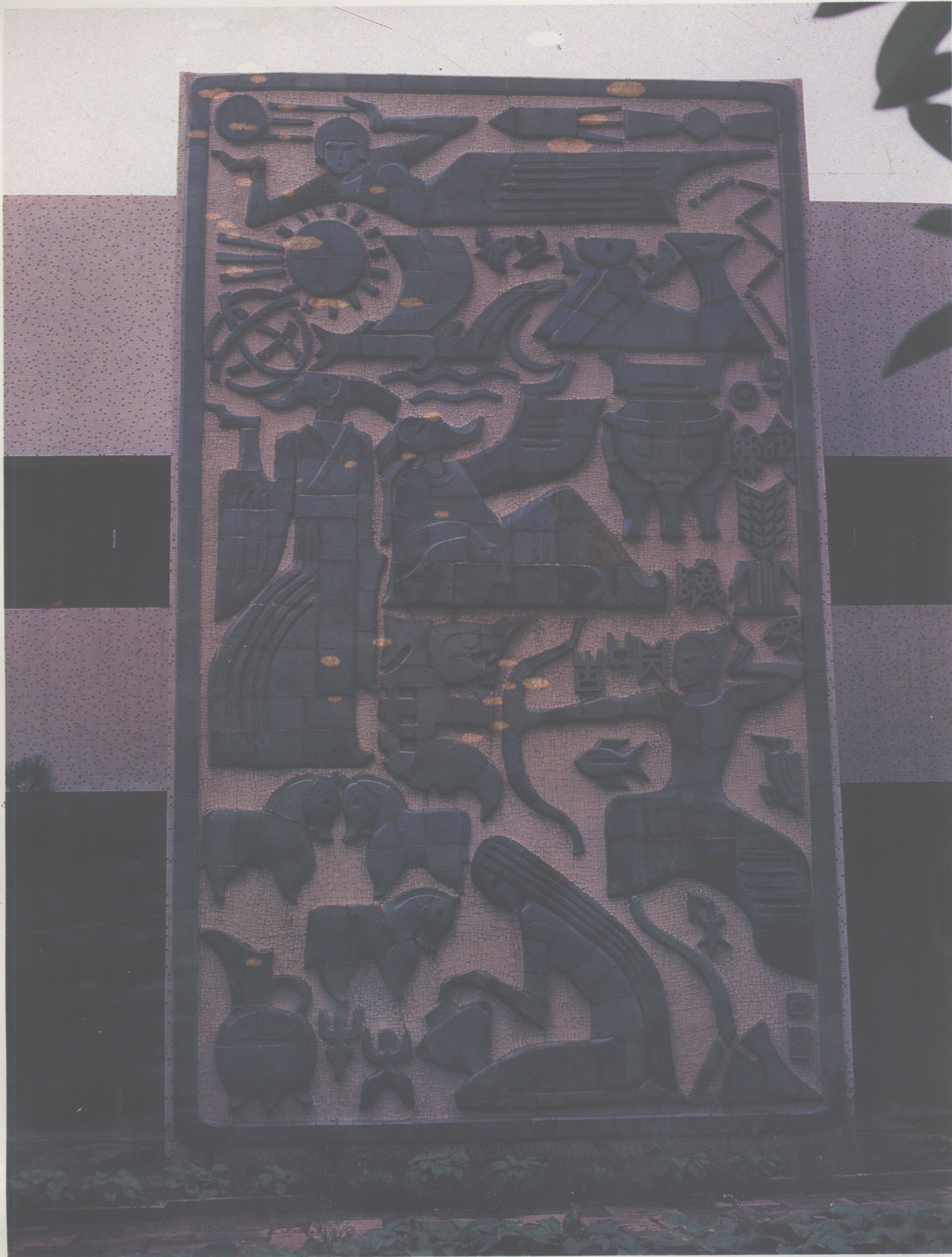
侯一民 上下五千年 600 cm × 900 cm 粗陶浮雕马赛克镶嵌