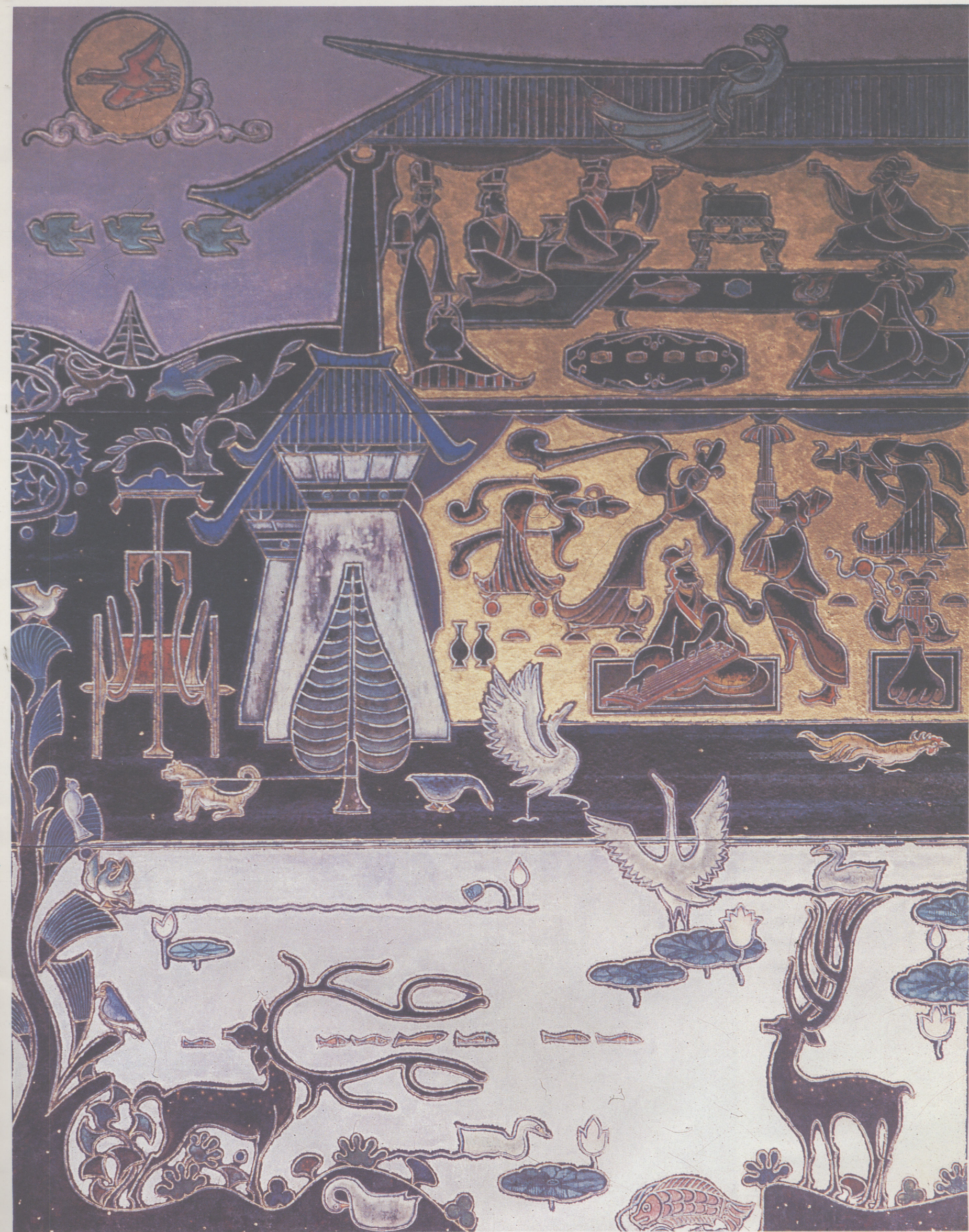
王文彬 鹿鸣 600 cm × 300 cm 重彩沥粉贴金