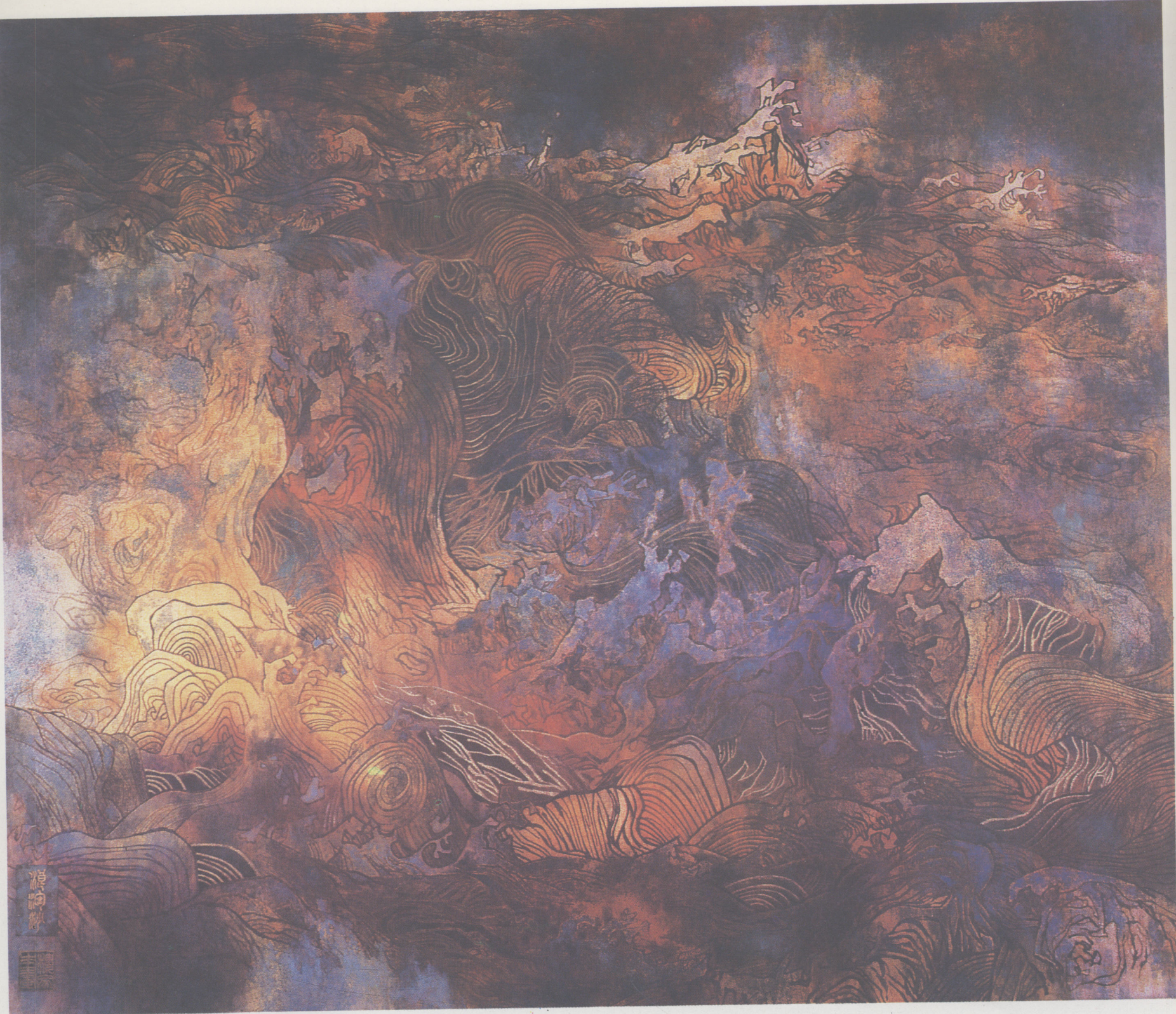
楼家本 江天浩翰（局部）重彩 湖北武汉黄鹤楼 1988