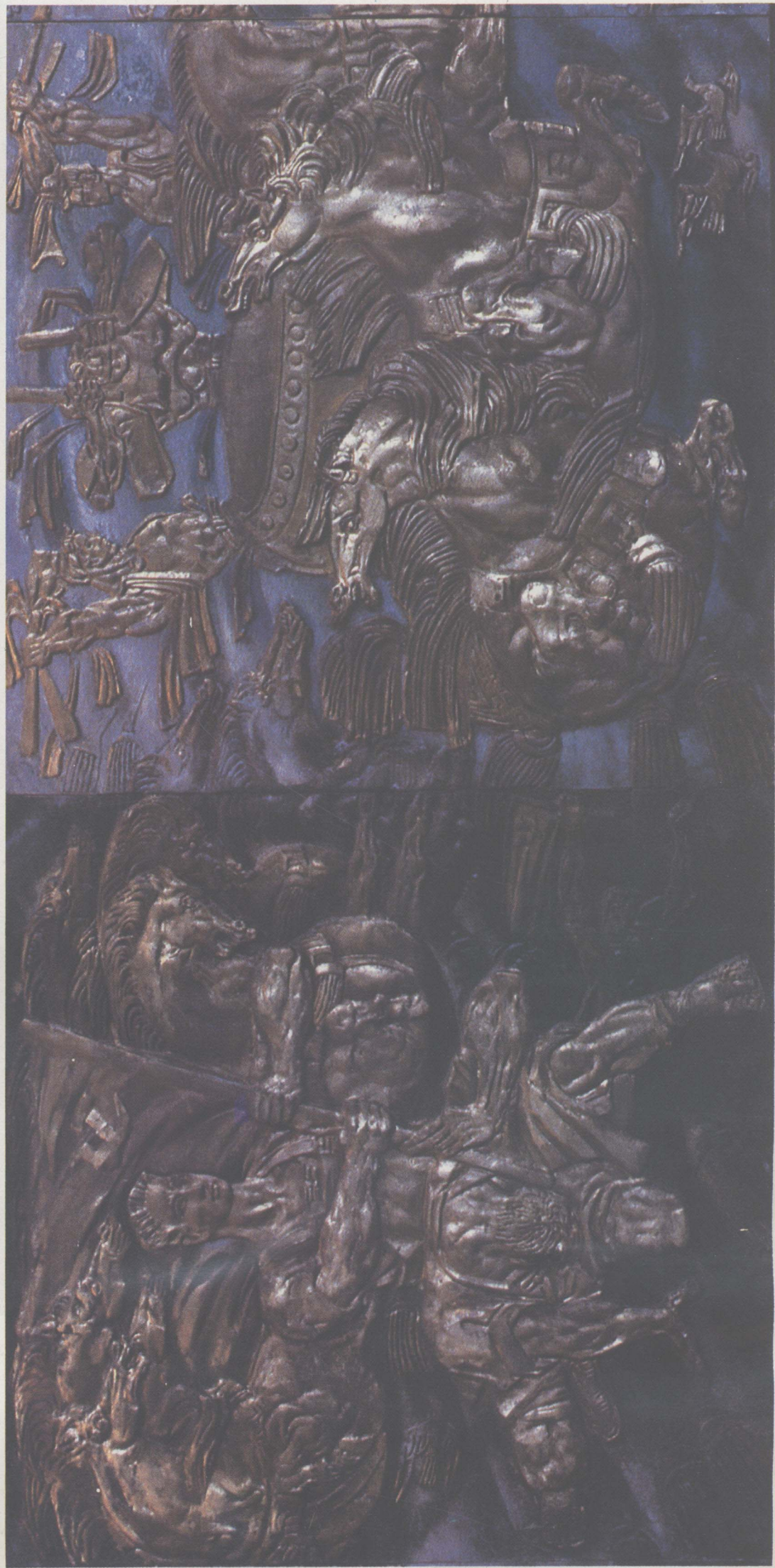
难忘的三、四十年代 (局部)