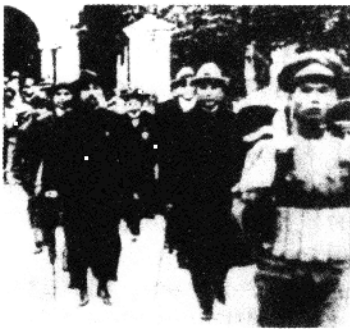
孙中山与李大钊步入 中国国民党“一大”会场

工人罢工的失败，使党从挫折中认识到，要战胜异常强大的敌人，必须建立广泛的革命统一战线。早在1922年8月，在共产国际的帮助下，中国共产党召开了西湖特别会议，讨论了和孙中山领导的国民党合作的问题。1923年6月，党的“三大”又正式确定了建立革命统一战线的方针。共产党员可以个人身份加入国民党，把国民党改组成为工人、农民、小资产阶级和民族资产阶级的革命联盟，同时共产党保持政治上、思想上和组织上的