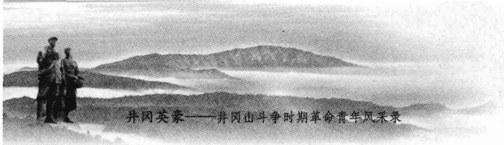
井冈山英雄——井冈山斗争时期革命青年风采录